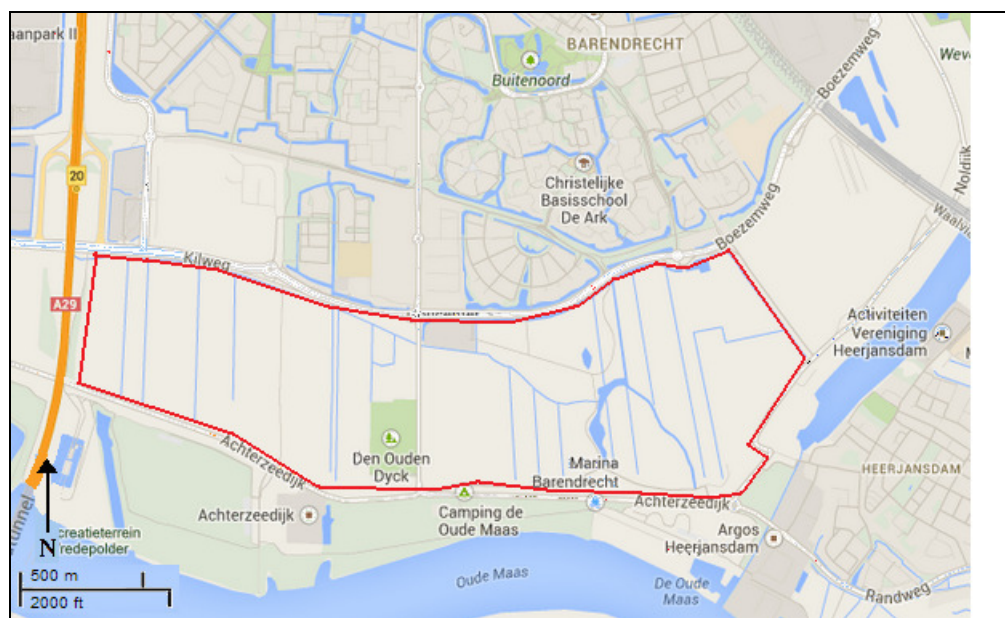
Figuur 4. Gebiedsgrenzen Zuidpolder.

De in het gebied gelegen woonerven en het kerkhof worden niet meegenomen tijdens deze vogelmonitoring.