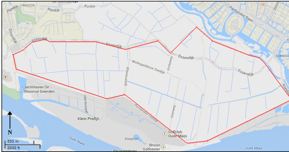
Figuur 2. Gebiedsgrenzen Buitenland (Google Maps).