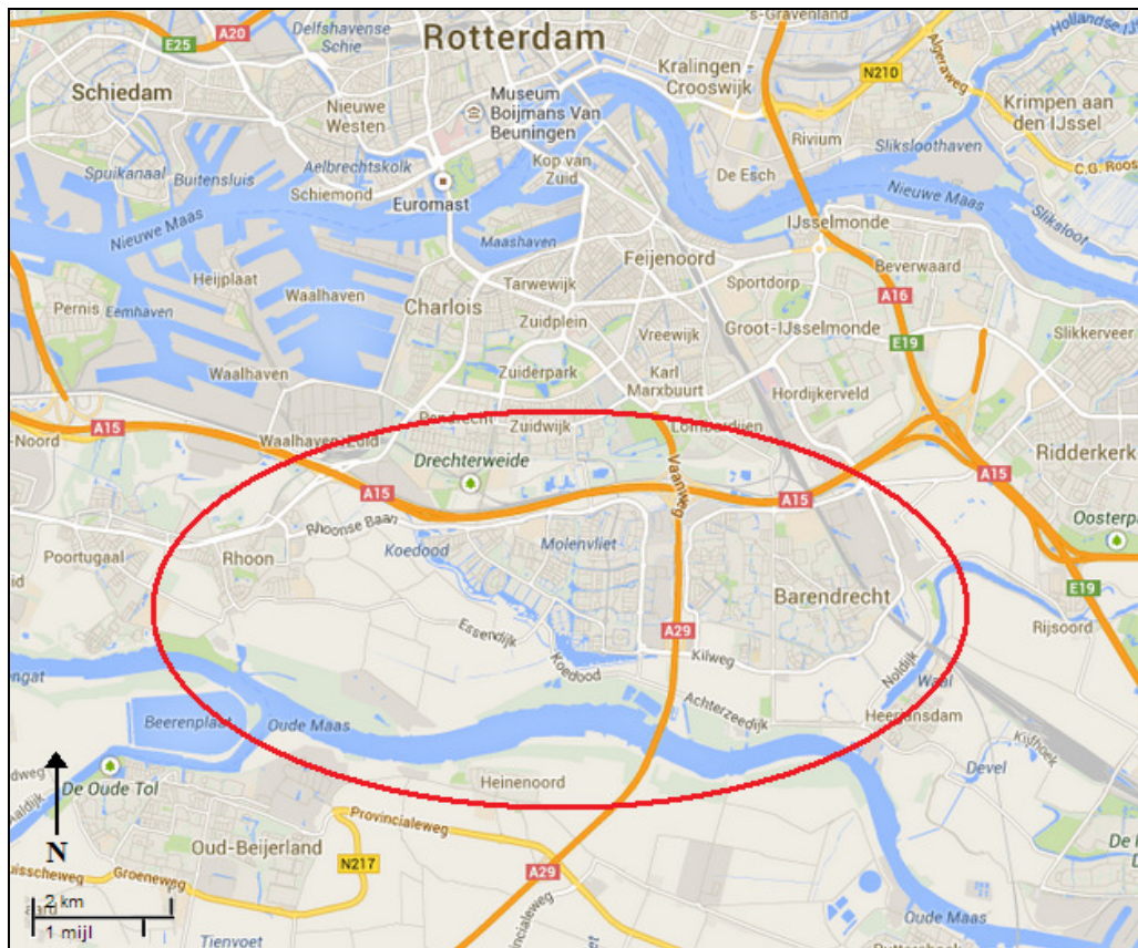
Figuur 1. Ligging projectgebied (Google Maps).

Het projectgebied ligt op het eiland IJsselmonde in de gemeenten Albrandswaard en Barendrecht (Figuur 1). Hier bevinden zich enkele groengebieden bestaande uit agrarisch cultuurgebied en recent omgevormd natuurgebied. Het projectgebied is opgedeeld in drie deelgebieden: de polder het Buitenland in Rhoon, de Koedoodzone in Rhoon en de Zuidpolder in Barendrecht. Deze deelgebieden worden in de volgende paragrafen besproken.