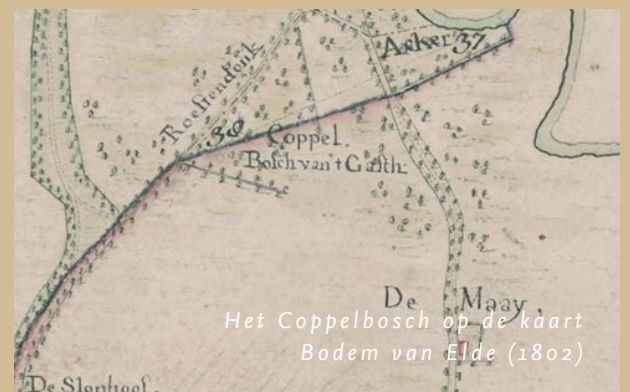
Het Coppelbosch op de kaart Bodem van Elde (1802)

De Maai, onder het Liempdse buurtschap Kasteren, is dé verbinding tussen het centrale deel van De Geelders en de Dommel. Hier kocht Brabants Landschap in 2019 het Coppelbosch, tot dan toe eigendom van Stichting Mannengasthuis uit Boxtel. Het was de allereerste keer sinds de instelling van het Kadaster (1832) dat dit bos verkocht werd. De eigenaar van het gebiedje, dat in de 17e eeuw waarschijnlijk al een bos was bouwde in 1650 in Boxtel een mannengasthuis. Dat heeft bestaan tot 1919. In het Coppelbosch komen middeleeuwse grenswallen voor. Ook is er een perceel essenhakhout, dat in Het Groene Woud bijna niet meer is te vinden.