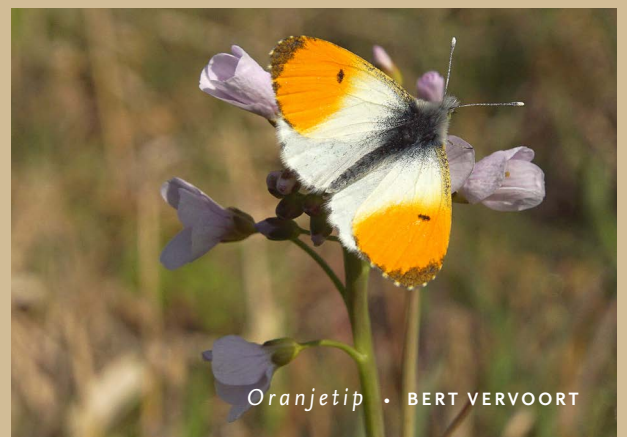
Oranjetip • BERT VERVOORT

Bovenstaande zwart-witillustratie is van de hand van Annelies Ebregt die er een stukje geschiedenis mee laat zien: de grenswal (ca. 1550) langs Het Speet in de Geelders. Grenswallen dienden als scheiding – een grens – tussen twee ‘eigendommen’. Deze grenswal op de illustratie scheidde Sint-Oedenrode en Liempde en maakte deel uit van een complex van grens- en kampwallen rondom Het Speet en de Buitenkamp/Batencamp. Annelies Ebregt vertelt over de illustratie: ‘Grenswallen waren wat breder en hoger dan de kampwallen. Op deze illustratie zie je dat aan beide kanten van de wal vlechthekken en sloten zichtbaar zijn om het wild en het vee tegen te houden, zodat ze niet de wal met hakhout op konden. Er waren weinig bomen in de drassige omgeving. Je ziet slechts een enkele oude wintereik en wat bosschages van wilg, eiken en elzen. Op de wal groeien zomereik, hazelaar, mispel en vuilboom. Wie goed kijkt, ziet in de vlechtheg van meidoorn ook hazelaar en een roos.’