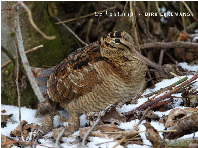
De houtsnip • DIRK EJKEMANS

Houtsnippen, de enige steltlopers die in het bos leven, zijn liefhebbers van grote bossen. Vandaar dat ze het in De Geelders goed toeven vinden. Ze leven vooral van wormen, waarbij regenwormen de voorkeur hebben. Ze peuteren hun prooien met hun lange, gevoelige snavel uit de vochtige bosgrond of onder dode bladeren en twijgen vandaan.