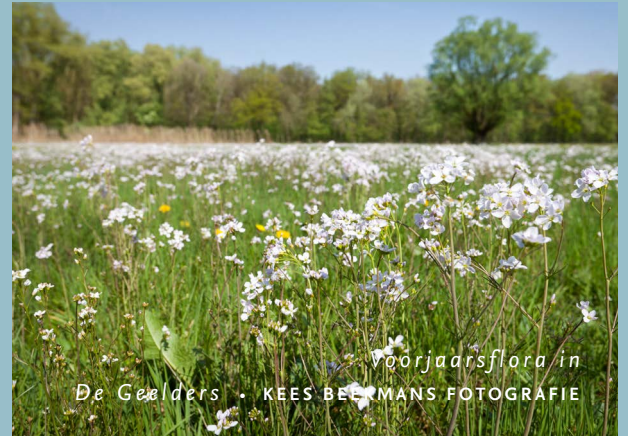
Voorjaarsflora in De Geelders • KEES BEEHMANS FOTOGRAFIE

Het is de bedoeling dat de natuurontwikkeling op voormalige agrarische gronden in De Geelders straks naadloos aansluit bij het omliggende bos. Maar hoe is het eigenlijk gesteld met die bestaande bossen? Uit een onderzoek van Bosgroep Zuid blijkt dat de leembossen in De Geelders het vooral in de zomer zwaar hebben. Dat komt door de grondwaterstand die dan diep wegzakt door verdamping en ontwatering. Herstel van de waterhuishouding is dan ook een must om de bossen te herstellen, volgens de onderzoekers. Daarnaast is het kiezen van de juiste boomsoorten belangrijk omdat die bepalend zijn voor de voedselvoorziening van de bodem.