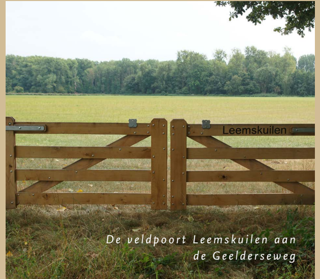
De veldpoort Leemskuilen aan de Geelderseweg

Een houtsnip ontdekken in het wild is behoorlijk moeilijk. De schutkleuren imiteren zo perfect de bosbodem dat hij zo goed als onzichtbaar is als hij zijn lijf tegen de bodem drukt. Houtsnippen zijn schaars in Nederland. Vrijwilligers hebben vele malen (ook in 2020) met speciale simultaantellingen in Het Groene Woud tot 83 baltsende mannetjes vastgesteld. Geschat wordt dat het er in werkelijkheid meer dan honderd moeten zijn. Daarmee kunnen we stellen dat de bossen in Het Groene Woud tot de Nederlandse topgebieden voor de houtsnip behoren. Kijkend naar landelijke schattingen gaan we ervan uit dat minstens drie tot vier procent van de populatie hier broedt. Rond De Geelders kun je eind mei op verschillende plekken baltsende houtsnippen waarnemen. Dan vliegen ze in de schemering met vertraagde, stijve vleugelslag in grote banen over het bos en maken ze knorrende geluiden. Een bijzondere natuurervaring die je maar op weinig plekken in Nederland zo goed kunt zien.