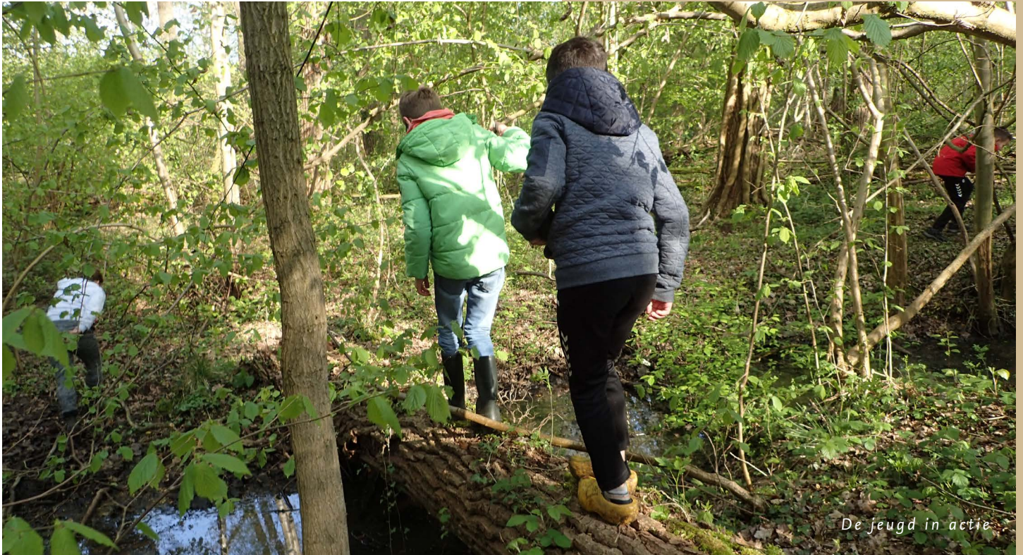
De jeugd in actie