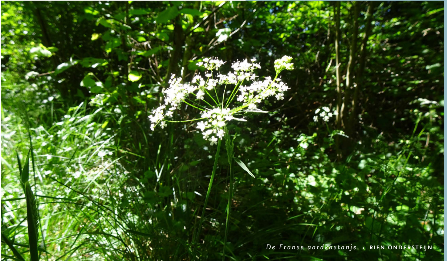
De Franse aardkastanje • RIEN ONDERSTEIJN