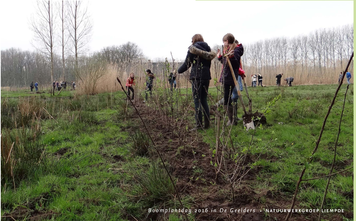
Boomplantdag 2016 in De Geelders