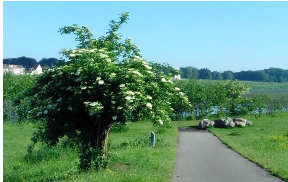
De Vlier bloeit.

De kruidlaag zorgt voor bloemen : stuifmeel- en nectarkroegen voor de insecten. De kinderen zijn verbaasd dat ze die mogen plukken.