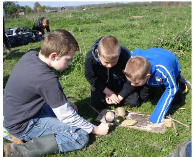
“ Wij maken vuur. Dan kunnen de vrouwen koken”