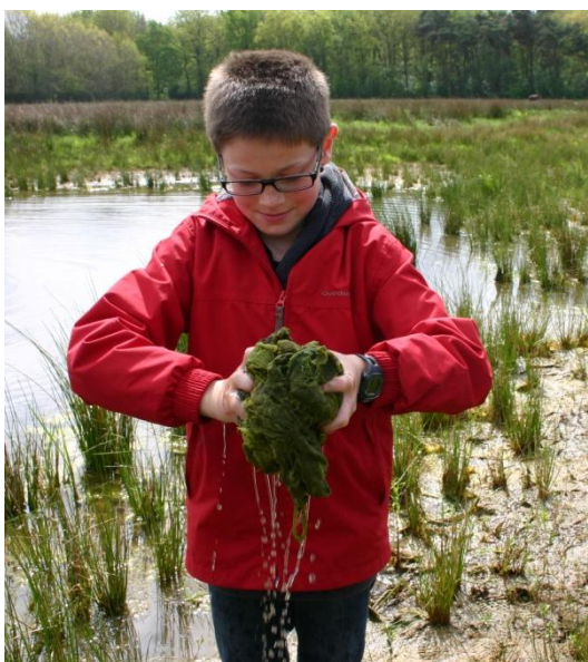
Sponswerking in een klimaatbuffer.

De juf van De Wieken maakt al planetjes voor volgend jaar: we maken er een hele dag van, 2 groepen samen, met picknick!