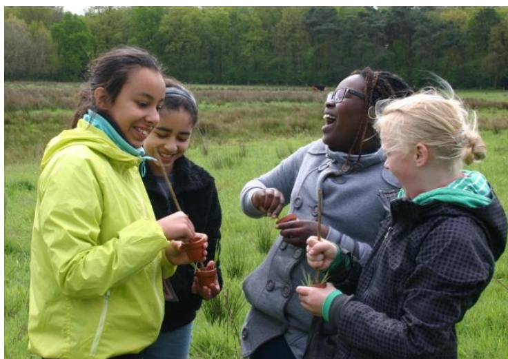
Zelf een geurenmengsel samenstellen.