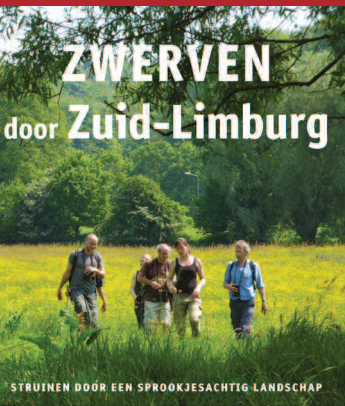
STRUINEN DOOR EEN SPROOKJESACHTIG LANDSCHAP