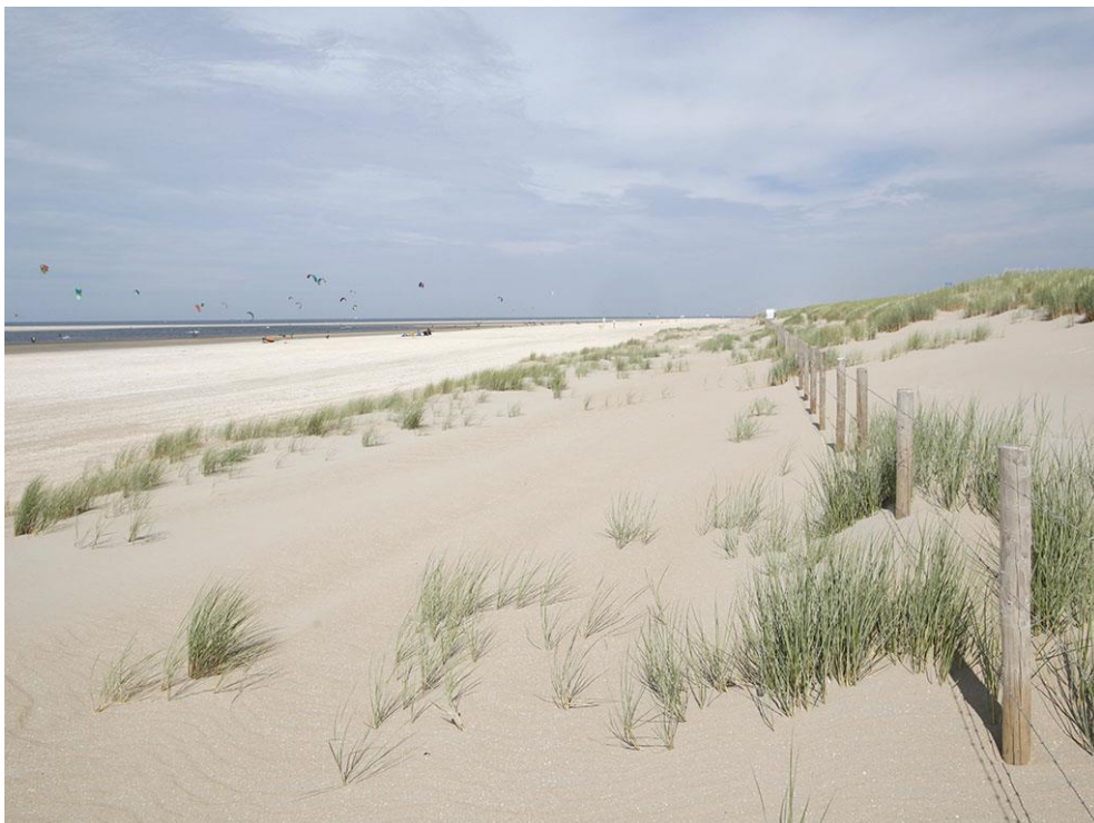
Foto 36: Op de overgang van strand naar de zanddijk van de Delflandse kustversterking is een langgerekte keten van jonge duintjes ontstaan.