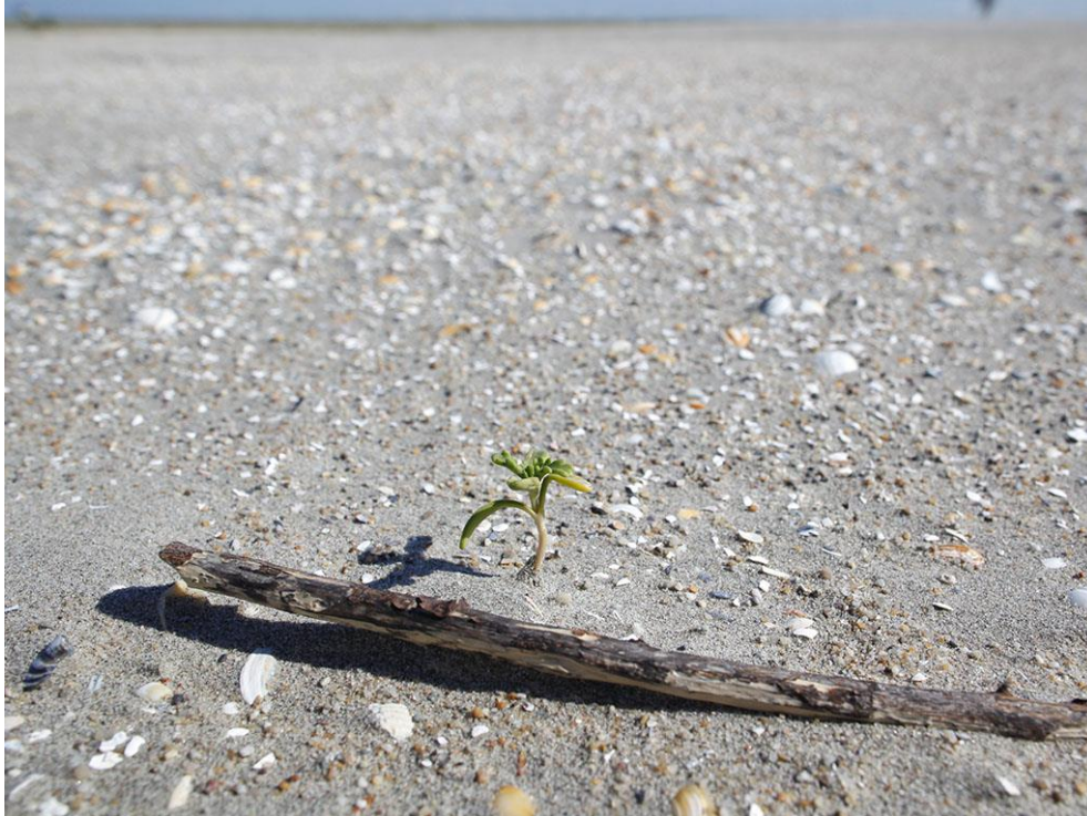
Foto 71: De hoge delen raken maar moeizaam begroeid. Erosie overheerst en jonge planten hebben moeite om bijtijds met hun wortels tot aan het grondwater te reiken. Deze zeeraket doet een dappere poging.

eigenlijk pas net op gang gekomen. Nu al is er veel plantengroei in de eerste twee gebieden. Dat geldt in veel mindere mate voor de aangelegde hoog gelegen delen. Het grondwater zit hier te diep voor een goede begroeiing door planten, zodat de successie hier niet of moeizaam op gang komt. Eigenlijk past dit biotoop beter bij stuifzanden in het binnenland of woestijnen elders op de wereld dan bij een kustlandschap. Kenmerkende pioniersoorten van de kust hebben het er dan ook moeilijk.