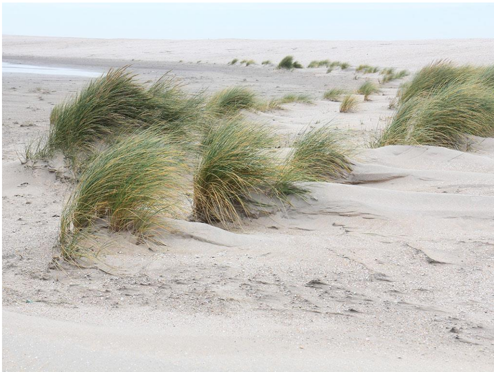
Foto 38: Aan de noordzijde van het duinmeer komt onderaan de helling een jong duin tot ontwikkeling. Helm domineert hier, maar er groeit ook biestarwegras, zeepostelein en stekend loogkruid.