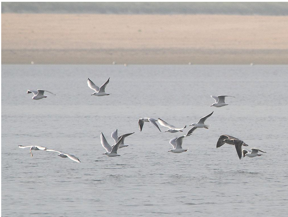
Foto 70: De baai met zijn wadplaten en intergetijdengebied zit vol leven. Vogels profiteren daarvan.

De Zandmotor is een groot succes, maar uiteraard zijn er ook lessen te leren voor de toekomst. Met betrekking tot de biodiversiteit is het duidelijk dat de baai en de laaggelegen brede stranden veel toevoegen, net als het jonge witte duin en de embryonale duintjes. De ontwikkelingen in de baai, het duinmeer en het strandmeer zijn