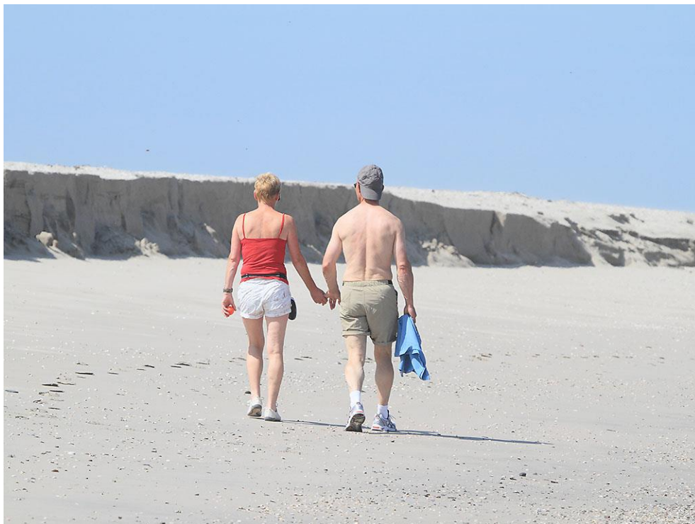
Foto 4: Het zand van de platen komt van de eroderende westzijde van de Zandmotor. Lokaal ontstaan hier zelfs enkele lage kliffen. 4 juli 2012.