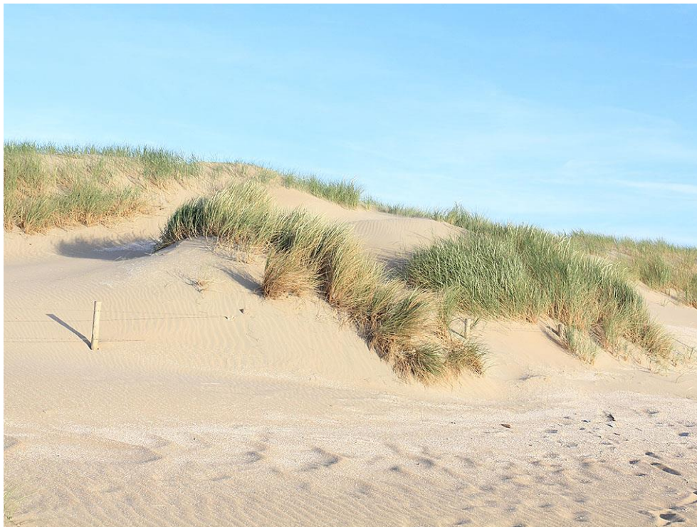
Foto 34: Het prikkeldraad is plaatselijk bijna helemaal onder vers zand verdwenen net als de zanddijk.