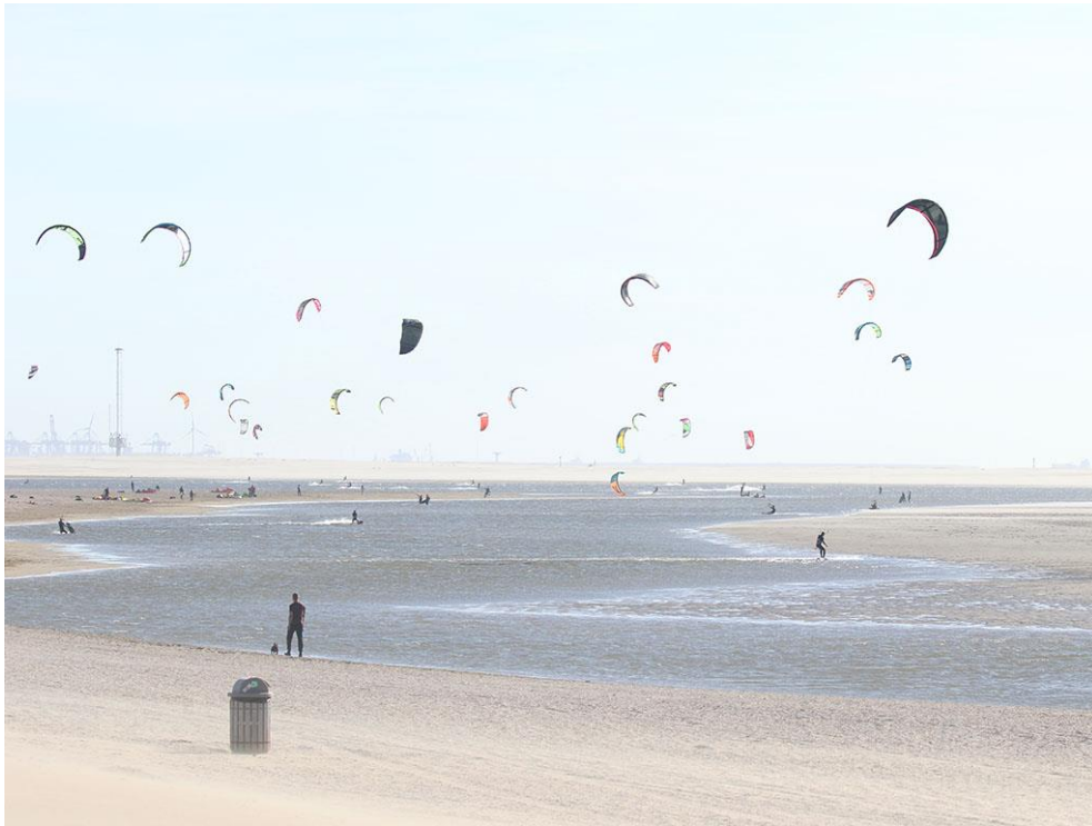
Foto 64: Soms vraag je je af of dat wel goed gaat met zoveel zeilen bij elkaar: raken ze nou nooit in elkaars draden verstrikt?