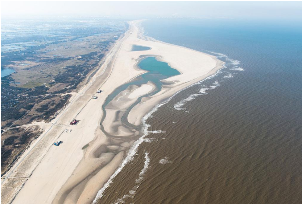
Foto 5: Regelmatig ontstaat een dubbel kreenstelsel, zoals deze foto van 27 maart 2013 laat zien.