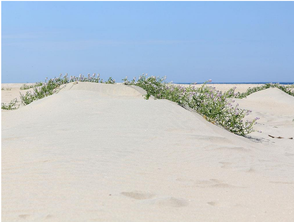
Foto 69: In het tweede jaar van de Zandmotor ontstonden er bovenop de hoog gelegen delen heuse zandduinen rondom de talrijke zeeraket. In later jaren bleven de duintjes veel lager.