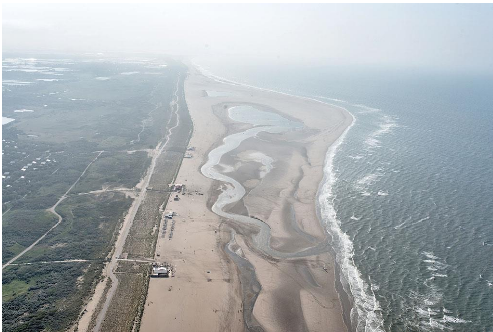
Foto 8: Door natuurlijke processen is op 13 september 2014 de korte geul weer hersteld en slibt de lange geul weer dicht.