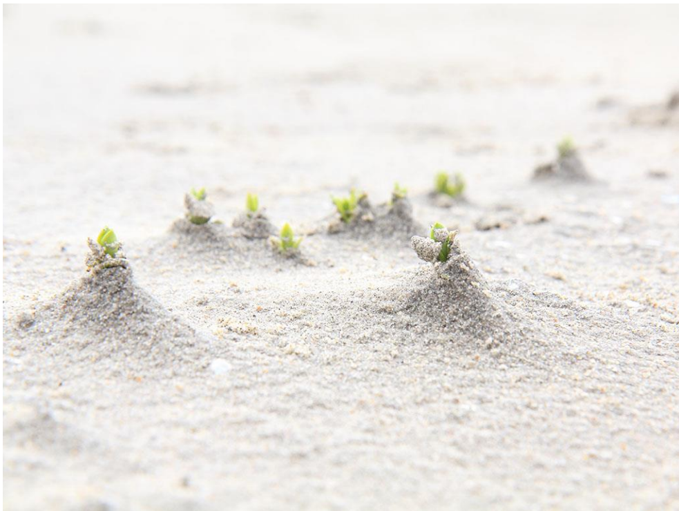
Foto 15: Zeepostelein ontkiemt dwars door een vers afgezette laag zand, ingevangen doordat de laaggelegen bodem hier door grondwater vochtig is.