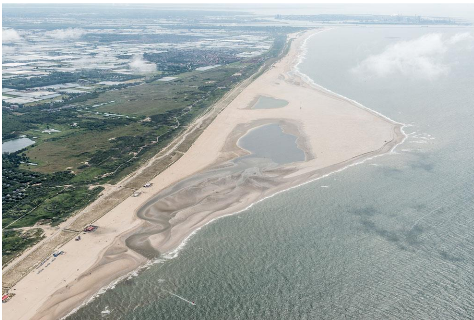
Foto 6: De Zandmotor op 1 juli 2013. Duidelijk is te zien dat de oude getijdenkreek richting Kijkduin steeds verder verzandt en langzaam verdwijnt. Er is nog maar één monding en de nieuwe kreek meandert nu sterk.