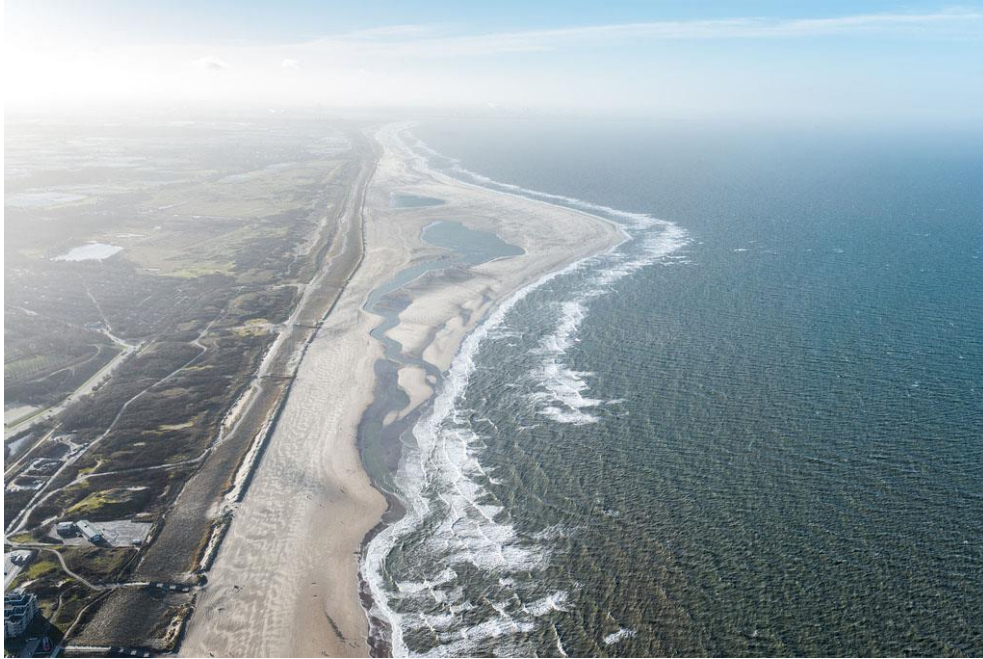
Foto 7: Op 20 december 2013 is de meanderende geul weer fors naar het noorden gegroeid.