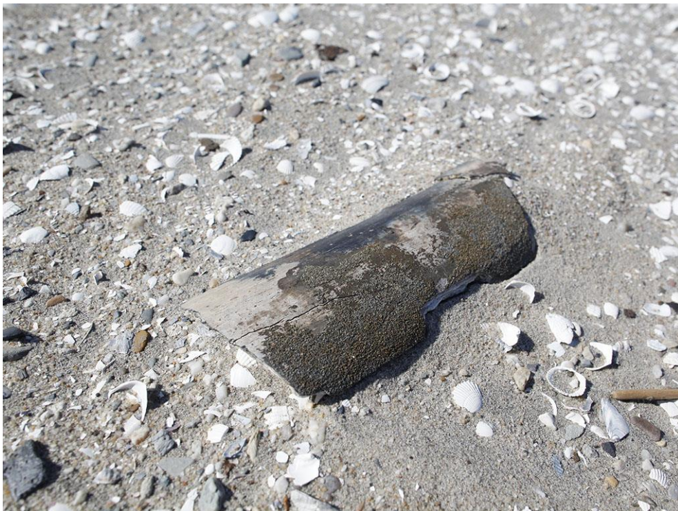
Foto 67: Een stukje slagtang van een mammoet als terloopse strandvondst op de Zandmotor.