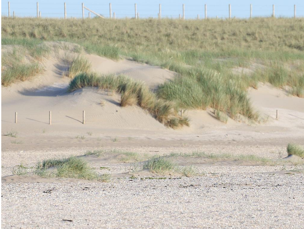
Foto 31: De helm op het jonge witte duin oogt veel frisser groen dan de rijtjes aangeplante helm op de zanddijk op de achtergrond. Op de jonge duintjes heeft helm de kans gekregen om met het opstuivende zand mee omhoog te groeien. Op de voorgrond groeien lage duintjes met veel biestarwegras en wat jonge helm.

In het derde jaar komen er steeds meer grassen en duikt ook zandhaver op. Zeepostelein vormt grote pollen en soms ook heuse duintjes. De jonge embryonale duintjes aan de voet van de zanddijk vormen lokaal al forse dynamische complexen vol helm en biestarwegras, de eerste stukjes wit duin. Waar op de zanddijk het in rijtjes gepote helm geel staat weg te kwijnen, oogt de helm op de jonge duintjes vitaal fris groen.