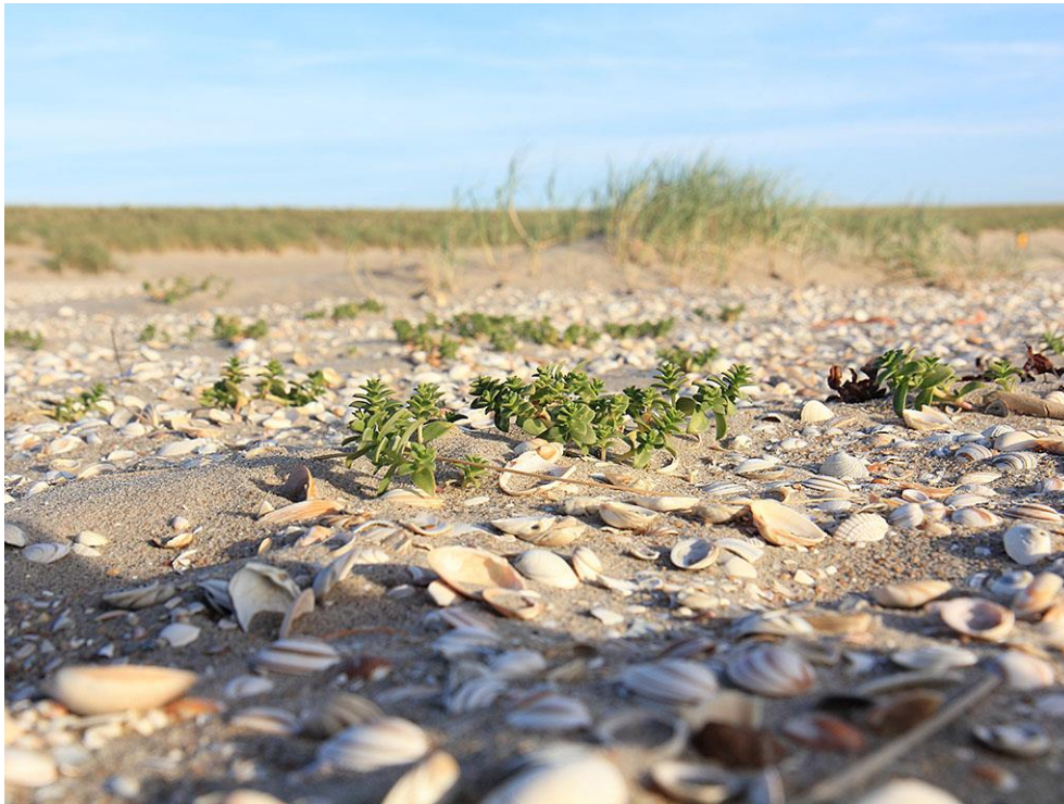
Foto 42: Waar erosie domineert, liggen hele vlaktes vol schelpen. Plantjes als zeepostelein hebben het hier veel moeilijker.