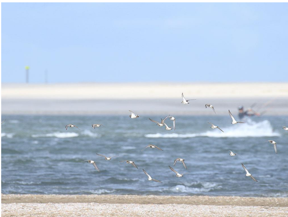
Foto 61: Deze bontbekplevieren en bonte strandlopers trekken zich weinig aan van de vele kitesurfers in de baai, zolang er maar geen wandelaars of honden te dichtbij komen.