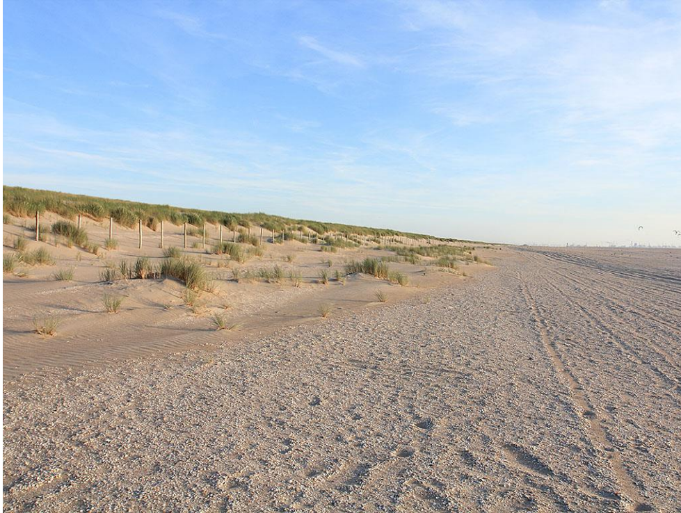
Foto 68: Zo ver als het oog rijkt vindt er natuurlijke jonge duinvorming plaats aan de voet van de aangelegde zanddijk.

De hoog gelegen delen raken nauwelijks begroeid doordat planten er weliswaar kunnen kiemen, maar droge periodes moeilijk overleven. De snelste natuurwinst ontstaat daar waar de omstandigheden goed passen bij natuurlijke omstandigheden: op strandvlaktes en aan de voet van bestaande duinen.