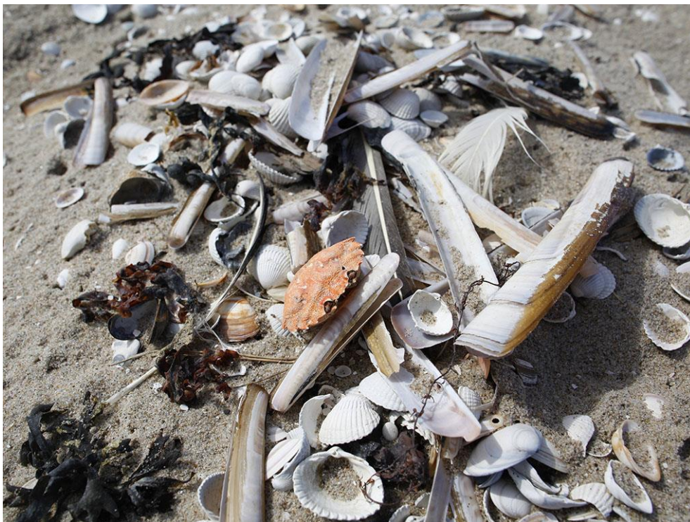
Foto 45: Een rugschild van een strandkrab naast tal van aangespoelde schelpen en wieren.

De natuur op de Zandmotor wordt steeds completer. Dat de zee rijk is, blijkt als na een storm het strand weer vol ligt met aangespoelde wieren, schelpen, krabben, kwallen en tal van meer bijzondere soorten. Na de talloze pioniers komen nu ook de soorten die een rijk gedekte dis zoeken. De knobbelzwanen, kuifeenden, middelste zaagbekken en futen laten zien dat er inmiddels overal vis, schelpdieren en waterplanten te vinden zijn. Op