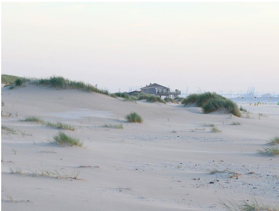
Foto 40: Ter hoogte van de strandopgang Molenslag bij Ter Heijde is spectaculaire jonge duinontwikkeling te vinden.

Niet alleen aan de voet van de zanddijk zijn jonge duintjes verschenen, maar ook verspreid over het gebied. De spreiding is echter verre van egaal. De meeste hoog gelegen delen zijn nagenoeg onbegroeid. Locatie D (zie figuur 1) is daar een kleine uitzondering op, maar dat lijkt samen te hangen met aanplant ten behoeve van