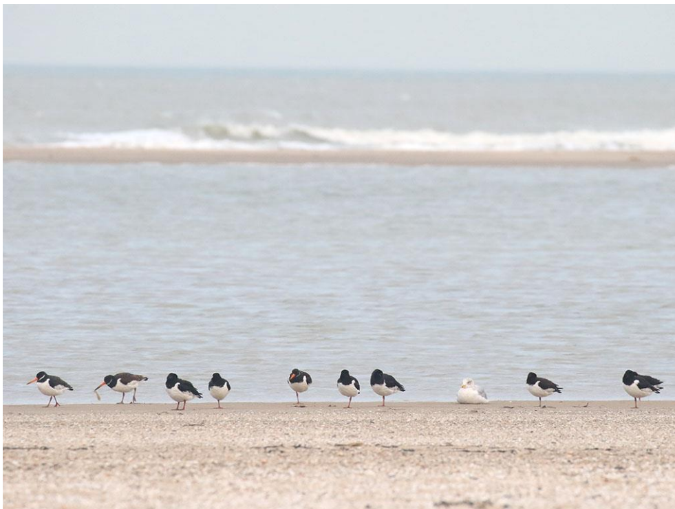
Foto 25: Scholeksters en een stormmeeuw rusten uit aan de oever van het nieuwe strandmeer.