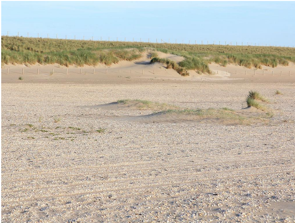
Foto 37: Lokaal komen pionierduintjes op het strand tot ontwikkeling, met zeepostelein (links), biestarwegras (midden) en helm (rechts).