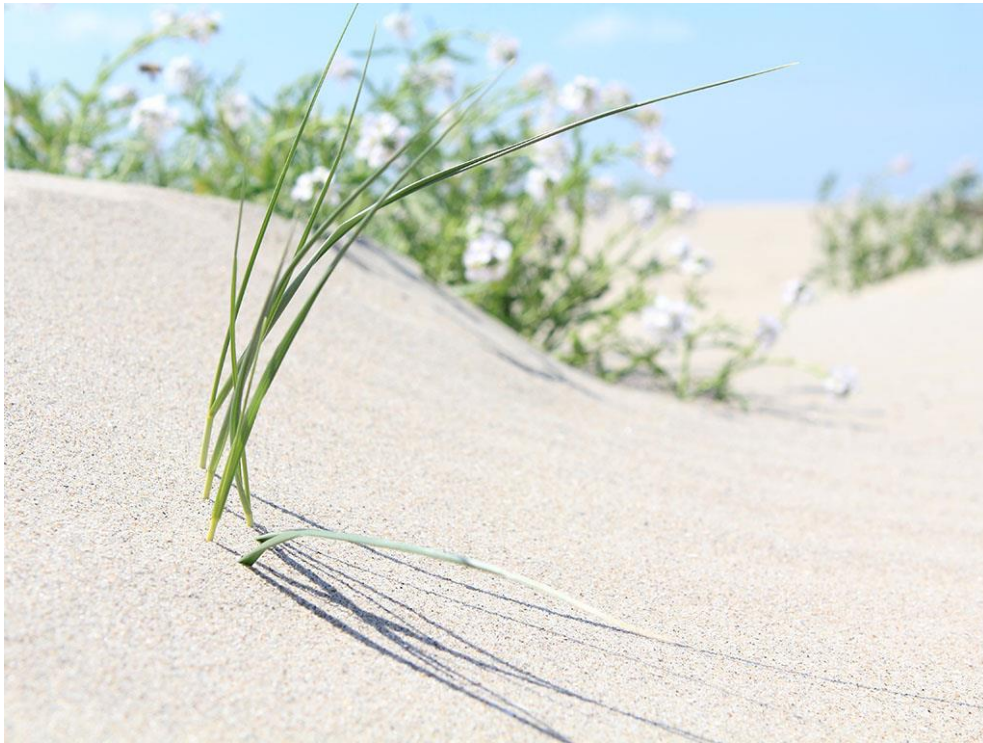
Foto 29: Her en der groeit jonge helm aan de rand van forse pionierduintjes met zeeraket. Juli 2012.