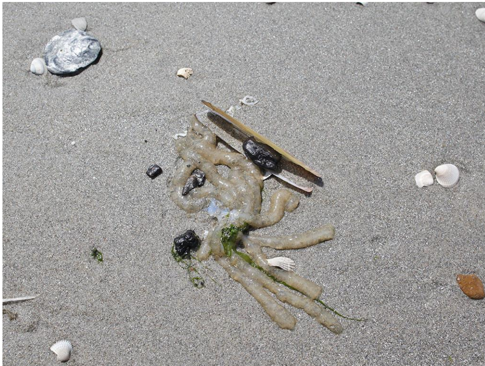
Foto 46: Aangespoelde eikapsels van een pijlinktvis en een zwaardschede.

doortrek zoeken steeds meer steltlopers hun voedsel in de getijdezone en in de nazomer zitten er veel sterns met hun jongen.