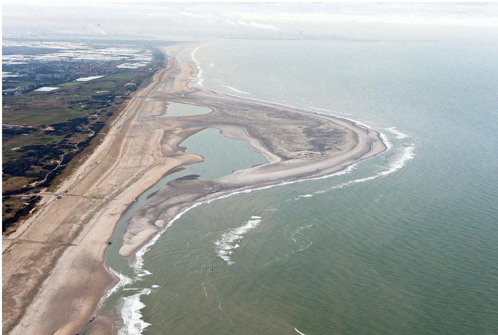
Foto 2: Op 10 januari 2012 is de baai al afgesloten en is het eerste stukje getijdenrivier zichtbaar.

Zand dat van de buitenrand van de Zandmotor erodeert wordt voor de monding van de baai door zeestromingen afgezet in de vorm van een langgerekte zandbank. Deze almaar groeiende zandbank sloot de baai binnen een half jaar tijd vrijwel helemaal af. Eb- en vloedstromingen houden de baai echter open. Met elke vloed stroomt er met kracht water naar binnen dat dwars door de zandbank heen een opening open schuurt. De langzamere ebstroom houdt de stroomgeul op diepte. Het meegevoerde zand wordt afgezet in een wirwar van wadplaten tussen baai en zandbank. Zowel de zandbank als de stroomgeul zijn in de afgelopen vier jaar steeds langer geworden. De stroomgeul is nu een meanderende getijdenrivier, de zandbank een strandwal en de ondiepe baai een lagune omzoomd door uitgestrekte wadplaten. Alles is constant in beweging en verandert van vorm, waardoor de Zandmotor altijd weer anders is. In de winter, als de zee krachtiger is, wordt de stroomgeul langer om in de zomer weer te krimpen.