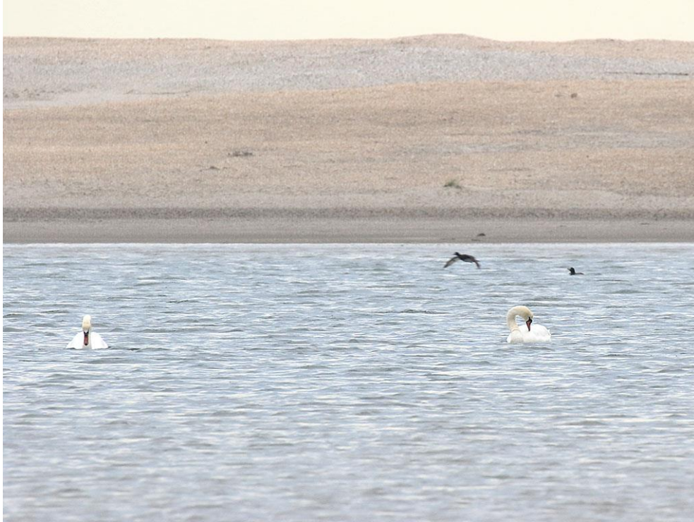
Foto 16: Knobbelzwaan en kuifeend waren in 2015 nieuwkomers in het duinmeer. Beide zochten er fanatiek naar voedsel. De eerste soort toont aan dat er volop goed bereikbare waterplanten in het duinmeer groeien, de tweede dat er onder water ook de nodige schelpdieren te vinden zijn.