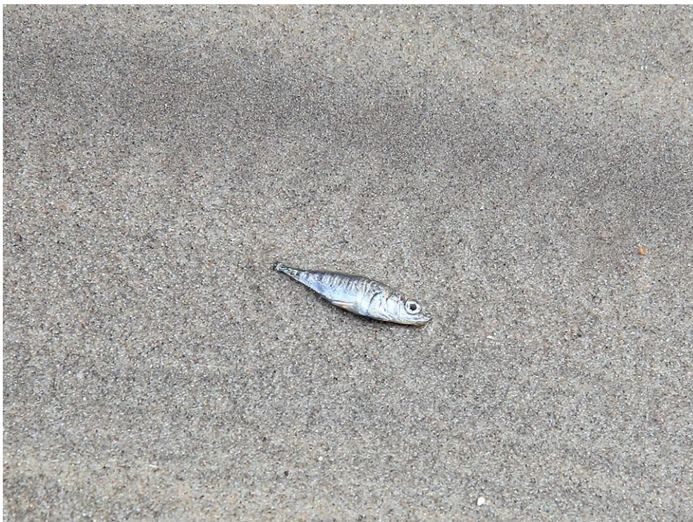
Foto 17: Een dode driedoornige stekelbaars op de oever van het duinmeer toont aan dat er in 2015 nog steeds (of alweer) vis in het steeds zoetere water leeft.