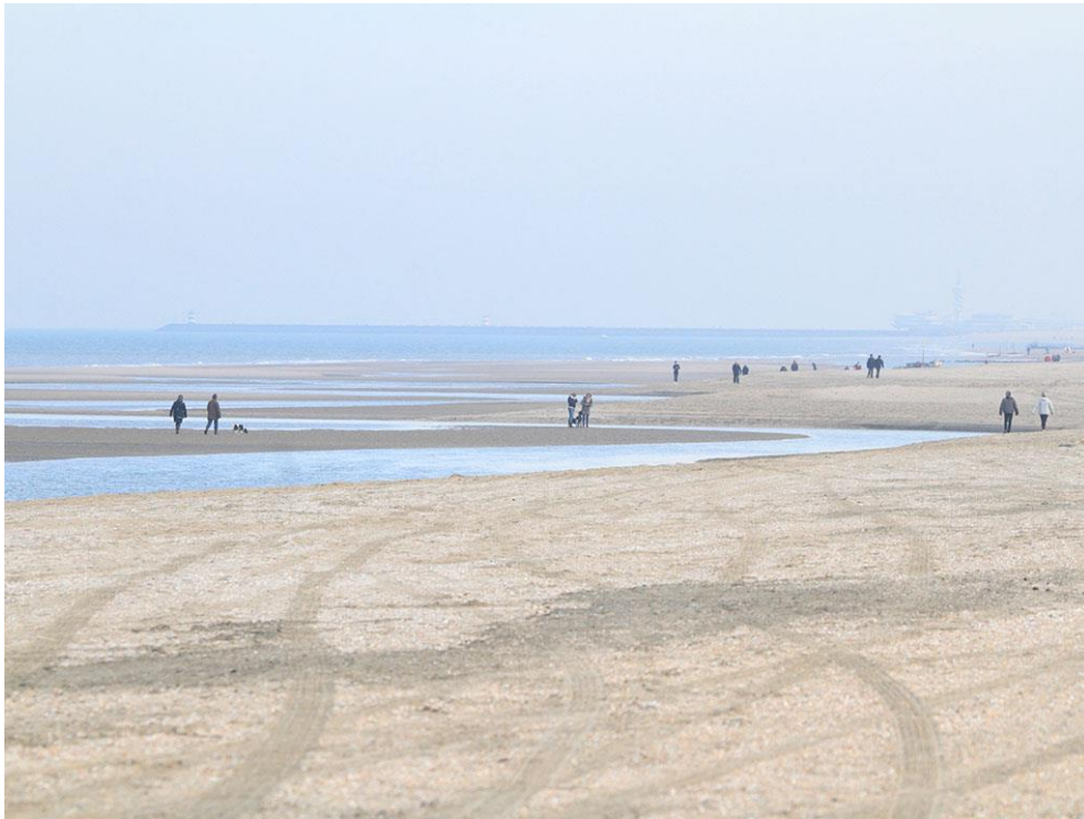
Foto 9: De getijdengeul meandert door het landschap. Het strand ligt beduidend hoger dan de zandplaten links van de geul.