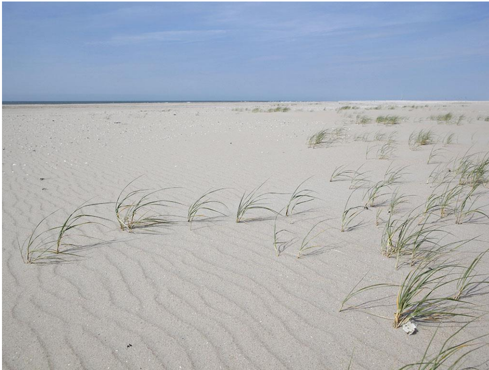
Foto 39: Op het lage strand bij A komt her en der biestarwegras op.