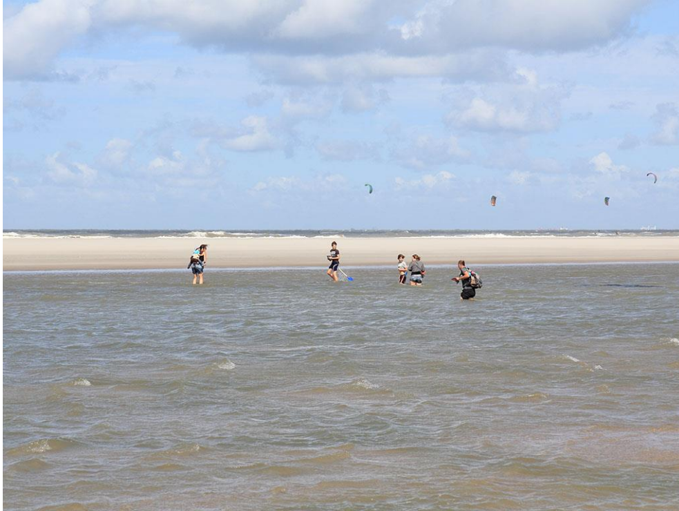
Foto 58: Met een beetje lef en een rugzak vol droge kleren kan je de getijdenrivier oversteken.