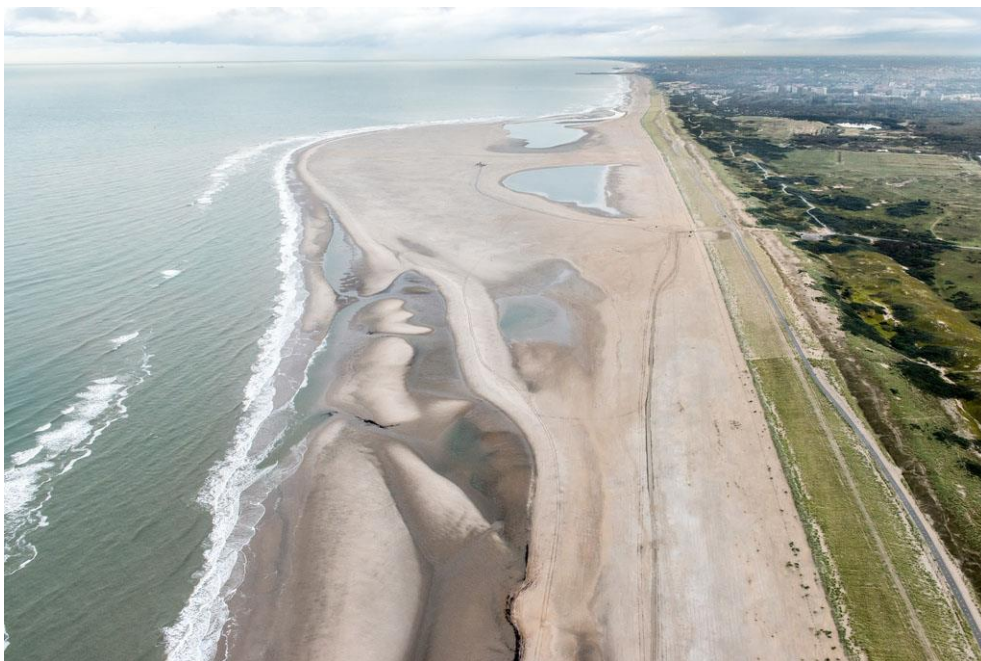
Foto 19: De zuidzijde van de Zandmotor op 31 oktober 2012, anderhalf jaar na aanleg van de Zandmotor. Een strandmeer, zwinnen, muien en zandbanken laten een indrukwekkende dynamische aangroeikust zien. Een radicaal ander beeld dan de gladde kustlijn van de Zandmotor direct na de aanleg.