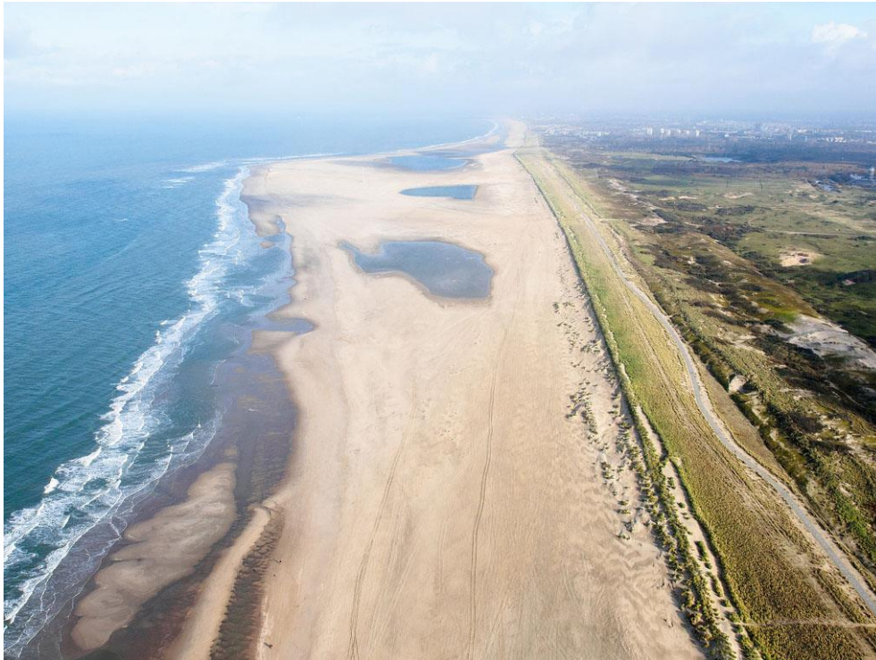
Foto 24: Op 12 november 2015 is er echter opnieuw een strandmeer te zien. Nu groter dan ooit.

Het droge voorjaar van 2015 zorgt voor een lage grondwaterstand en daarmee het uitstuiven van de uitgedroogde zuidelijke strandvlakte. Het uitgestoven zand gaat richting jonge duintjes aan de voet van de zanddijk van de Delftlandse kustversterking, die fors aangroeien. De hevige regens later in het jaar verhogen het grondwaterpeil en laten in de uitgestoven laagte een heus strandmeer ontstaan.