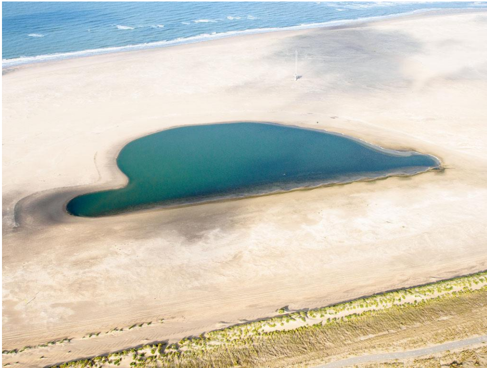
Foto 35: Deze luchtfoto van het duinmeer laat linksonder zien dat voor de zanddijk een nieuwe rij jonge duintjes groeit. Ook is duidelijk te zien dat aan de voet van de zanddijk een ononderbroken band van wit duin met vitaal groen helm aanwezig is.