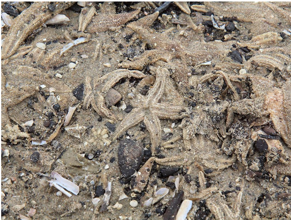
Foto 43: Het water rondom de Zandmotor zit vol leven. Na een storm is dat soms goed te zien op het strand en ligt de hoogwaterlijn vol met schelpen, kwallen of gewone zeesterren, zoals hier op de foto.