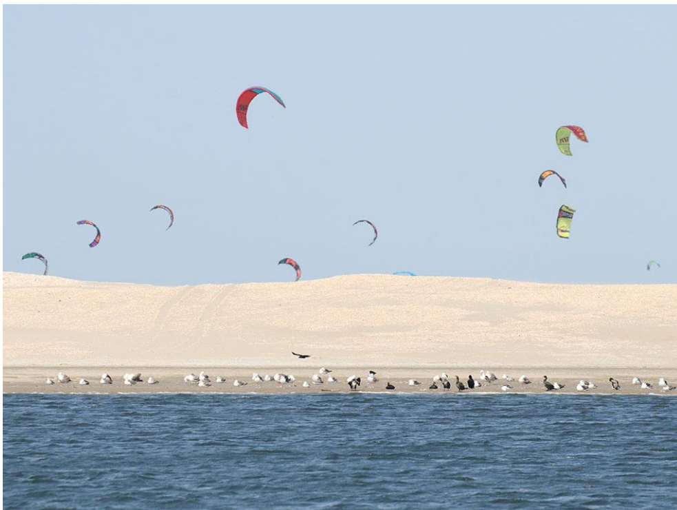
Foto 59: Vogels zoeken vaak een rustige plek op en storen zich niet aan de vele kitesurfers even verderop. Het aantal kitesurfers is de afgelopen vier jaar gestegen (bron: Recreatiemonitor Zandmotor 2015).