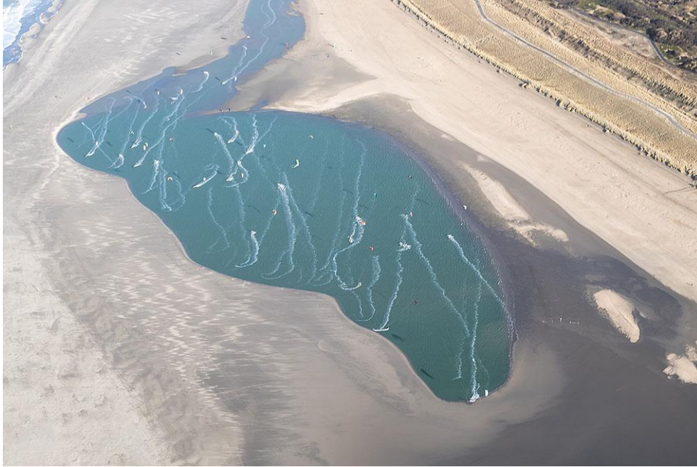
Foto 14: Deze foto van de baai op 24 januari 2015 laat naast de vele kitesurfers ook patronen van stuivend zand zien. De donkere vlek aan de zuidkant (rechtsonder op de foto) is het getijdengebied dat dagelijks bij vloed onder water loopt. Het getijdenwater zet hier twee keer per dag kleideeltjes af en als het waait, voert de wind een dun laagje zand aan.