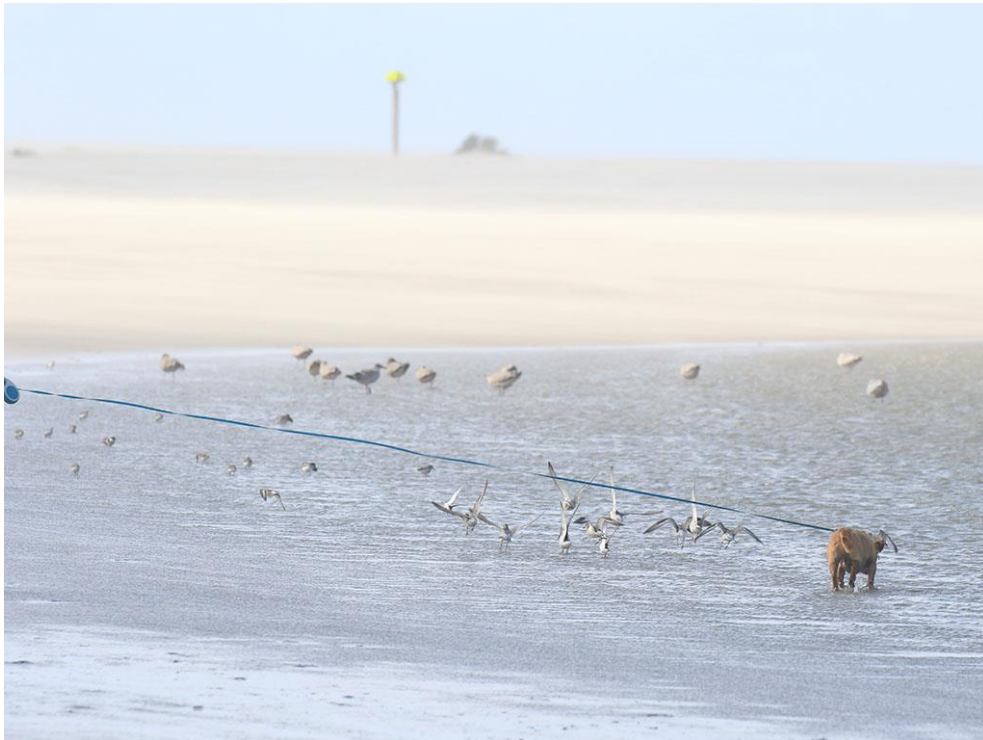
Foto 60: Niet altijd gaat het goed. De hond zit weliswaar aan de lijn, maar kan toch de vele steltlopers in de baai opjagen. Het aantal bezoekers met hond is de afgelopen vier jaar gestaag toegenomen (bron: Recreatiemonitor Zandmotor 2015).