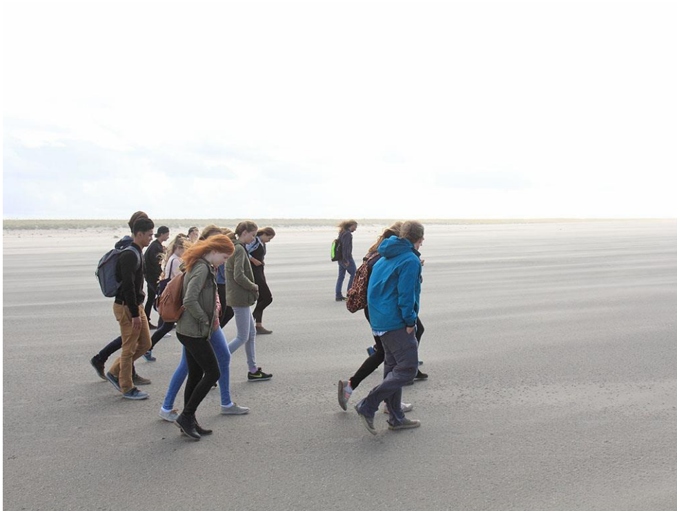
Foto 56: Lekker uitwaaien tijdens een excursie. Er tussenuit zijn is een belangrijk motief voor bezoekers van de Zandmotor. Bezoekers associëren de Zandmotor vooral met rust en ruimte (bron: Recreatiemonitor Zandmotor 2015).