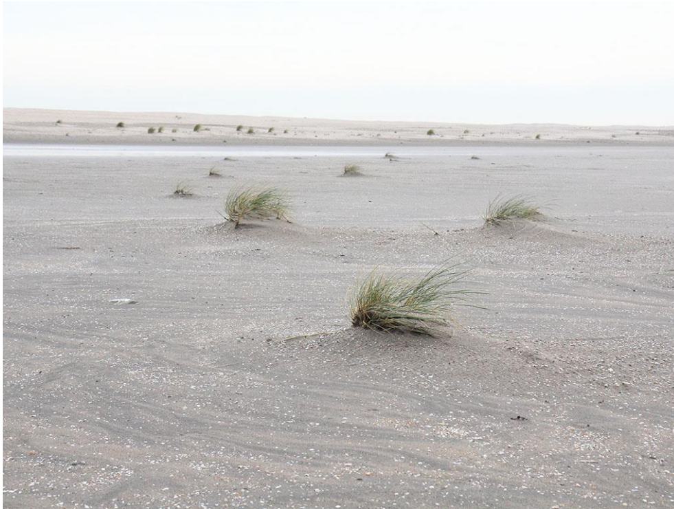
Foto 28: Drijfzand aan de zuidwestkant van het duinmeer. Inmiddels was de bodem nog zacht, maar weer veilig te belopen.

In droge tijden pakt de wind zand op en voert het richting duinen, waar het ingevangen wordt in de vegetatie of tegen een helling blijft liggen. Maar niet alleen daar blijft stuivend zand achter. Ook de vochtige oevers en het water van de baai, het duinmeer en de strandmeren vangen veel stuivend zand in. De losse stapeling van zand kan dan voor onstabiele, zachte bodems zorgen. Dit fenomeen komt vaker voor langs de kust en wordt naast drijfzand ook wel klapzand, onstabiele bodem of zachte bodem genoemd. Meestal is het voor passanten geen probleem en zak je maar langzaam weg. Op tijd een voet opzij zetten is dan voldoende. Voor ruiters en voertuigen kan het echter eerder problematisch zijn. Na enkele dagen zakt het zand uit en wordt de bodem weer compact. Maar deze herfst was het heftiger dan ooit en kwam iemand voor het eerst echt vast te zitten. Gelukkig is deze persoon snel uit haar benarde positie gered. Op de eerste tekenen van drijfzand is telkens snel gereageerd met het plaatsen van waarschuwborden.