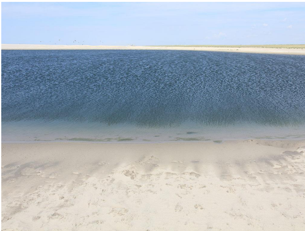
Foto 13: Zand waait in het duinmeer, dat daardoor bij elke storm langzaam kleiner wordt.