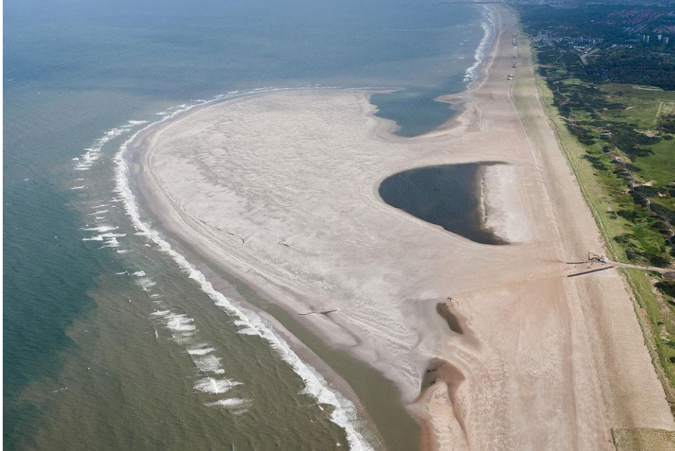
Foto 18: Op 26 juli 2011 is al te zien dat er een zandbank parallel aan de kustlijn van de Zandmotor ontstaan is.

Was de zuidzijde van de Zandmotor bij aanleg nog strak, al snel daarna ontstaat hier door constante aanvoer van zand een heel complex aan zandplaten, muien en zwinnen. Zwinnen zijn de natte geulen achter de zandbanken en muien zijn de geulen die dwars door de zandbank het getijdenwater aan- en afvoeren van en naar deze zwinnen.