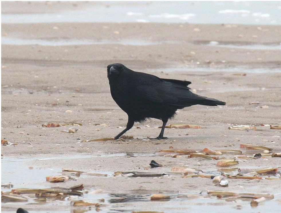
Foto 44: Een zwarte kraai verorbert een aangespoelde zwaardschede.