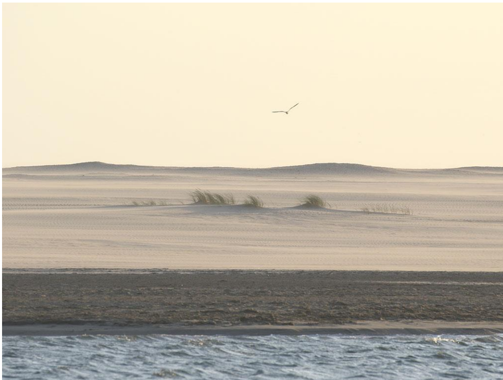
Foto 41: Op de hoog gelegen delen van de Zandmotor komt maar weinig vegetatie tot ontwikkeling. De meeste planten groeien er op de randen van de hoogvlaktes, halverwege of onderaan de hellingen. Daar is het grondwater dichterbij en is er meer ruimte voor sedimentatie.

onderzoek. Begroeiing komt met name tevoorschijn op de laag gelegen strandvlakte bij A en op de randen van hoog gelegen delen, zoals bij B, C, E en F. Hier komt zoet kwelwater uit de hoger gelegen delen te voorschijn, zodat de vegetatie minder afhankelijk is van de schaarse regenbuien. Bovenop de hoge delen zakt dit regenwater snel weg naar grotere dieptes. Kiemplantjes kunnen hier in natte zomers goed overleven, maar moeten in droge tijden in een rap tempo wortels maken tot wel 7 meter diep. De meeste lukt dit niet en deze sterven alsnog in de eerste droge periode. Bovendien overheerst winderosie op de hooggelegen delen. Nu veel zand is weggeblazen, ligt er een tapijt van schelpen en vormen zich alleen nog lage duintjes. Dit in tegenstelling tot het eerste en tweede jaar, toen er bovenop de hoogste delen forse jonge zandduinen ontstonden rondom de opgekomen zeeraketplantjes.