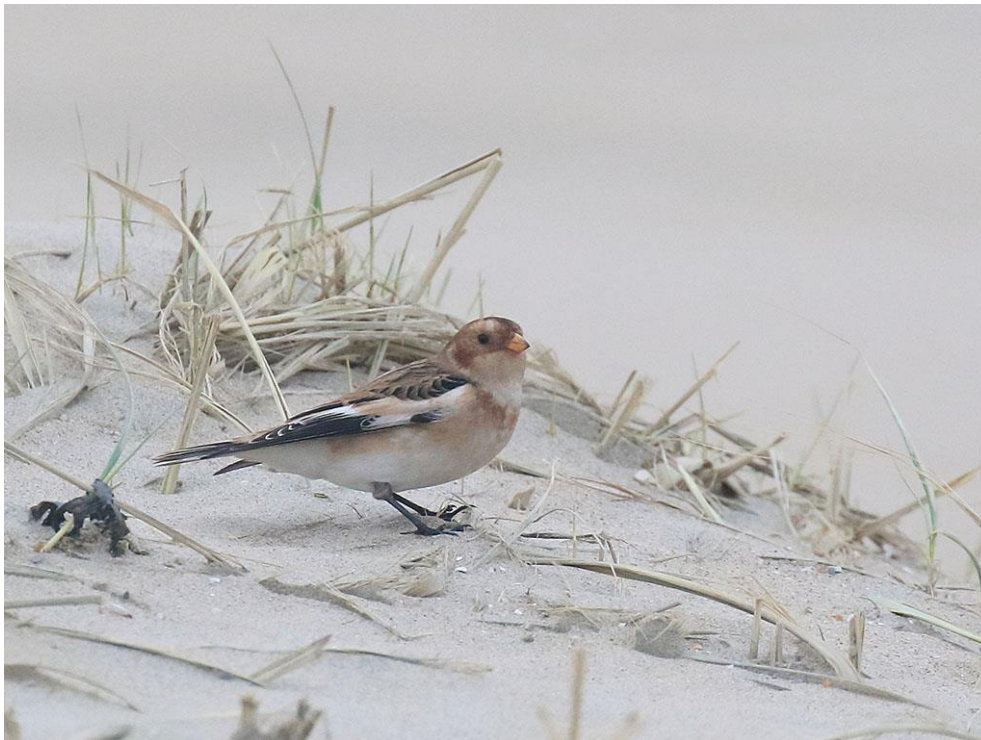
Foto 55: Diverse sneeuwgorzen genoten in de late herfst van het pionierlandschap op de Zandmotor.

Sneeuwgorzen zijn graag geziene wintergasten, die alleen op stranden zitten die niet geschoond worden en waar dus volop plantenzaden blijven liggen. De eerste zandhagedis is al gespot en naarmate het jonge witte duin steeds verder uitgroeit zal ook dit gebied geschikt worden voor deze liefhebber van kaal zand naast een rijke vegetatie.