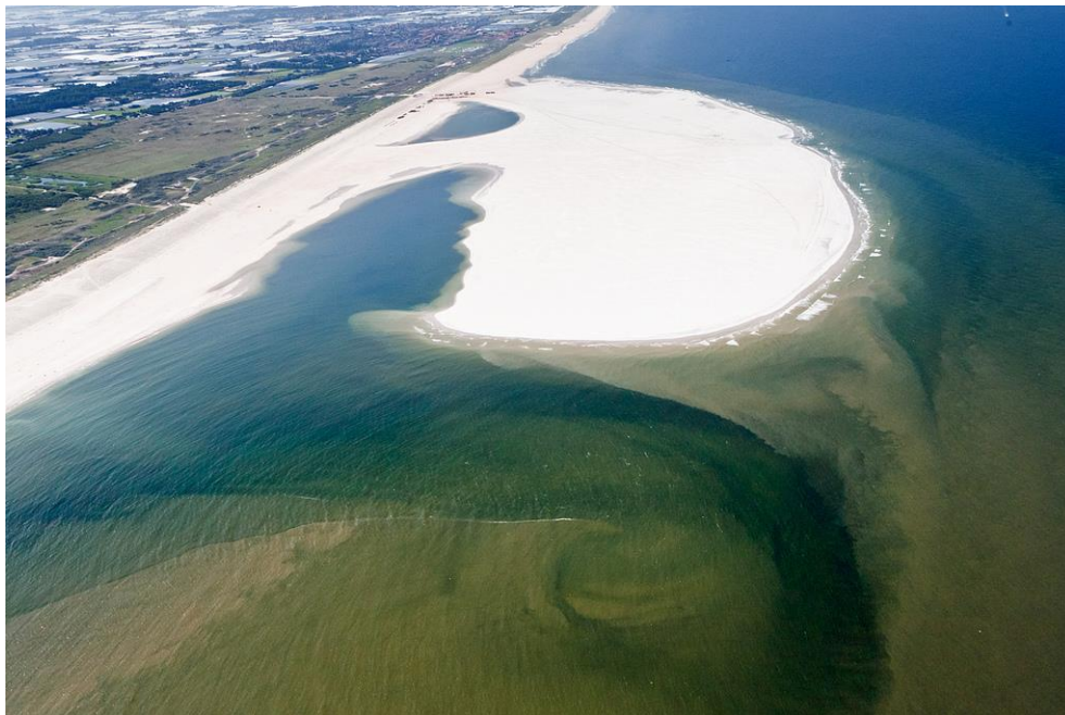
Foto 1: De Zandmotor op 11 juli 2011 vlak na aanleg. Aan de noord- en de zuidzijde zijn nog geen strandwal, zandbanken, geulen, zwinnen en muien te zien. Wel is het sedimenttransport duidelijk te zien en de eerste aanzet voor een zandbank vanaf de punt van de Zandmotor.

In het voorjaar en de zomer van 2011 is de Zandmotor aangelegd, waarbij de contouren steeds duidelijker werden. Vanaf de eerste scheepsladingen zand reageert de natuur op de veranderde kustlijn. Zeestromingen, eb en vloed, brandingsgolven, wind en regenwater verplaatsten het zand onder en boven water. Aan de westkant erodeert de Zandmotor continu en dit zand wordt niet alleen aan de noordkant, maar ook aan zuidkant weer afgezet. Slechts een heel klein deel lijkt te verdwijnen uit de directe omgeving van de Zandmotor. Storm geeft deze natuurlijke processen extra energie. De golven zijn dan krachtiger en nemen meer zandkorrels mee om elders weer af te zetten. Na een eerste spectaculair jaar vol stormen zorgen ook de drie jaren daarna voor tal van veranderingen in de vorm van de Zandmotor. De luchtfoto's van Joop van Houdt hieronder laten dit proces mooi zien. De veranderingen gaan vaak langzaam, maar soms verbluffend snel: elke maand ziet de Zandmotor er weer anders uit. Eerst wordt de baai en getijdenrivier besproken, daarna het duinmeer en dan de strandmeren, muien en zwinnen.