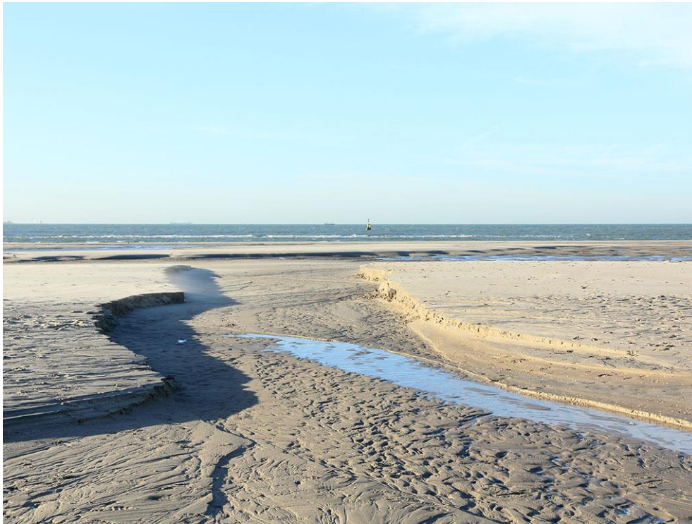
Foto 22: Uitstroomopening van een (voormalig) strandmeer. Vaak worden strandmeren met hoge vloed opnieuw gevuld, maar door de daaropvolgende uitstroom kan een lage plek in de afsluitende strandwal verder uitslijten, waarna het strandmeer leegloopt of een permanente in- en uitstroomopening ontstaat. In dat laatste geval ontstaat er op de plek van de uitstroom een mui en wordt het strandmeer weer een zwin. Door instromend en inwaaiend zand worden de meertjes steeds ondieper, waardoor er uiteindelijk niet veel meer overblijft dan een vage verdieping in het strand.