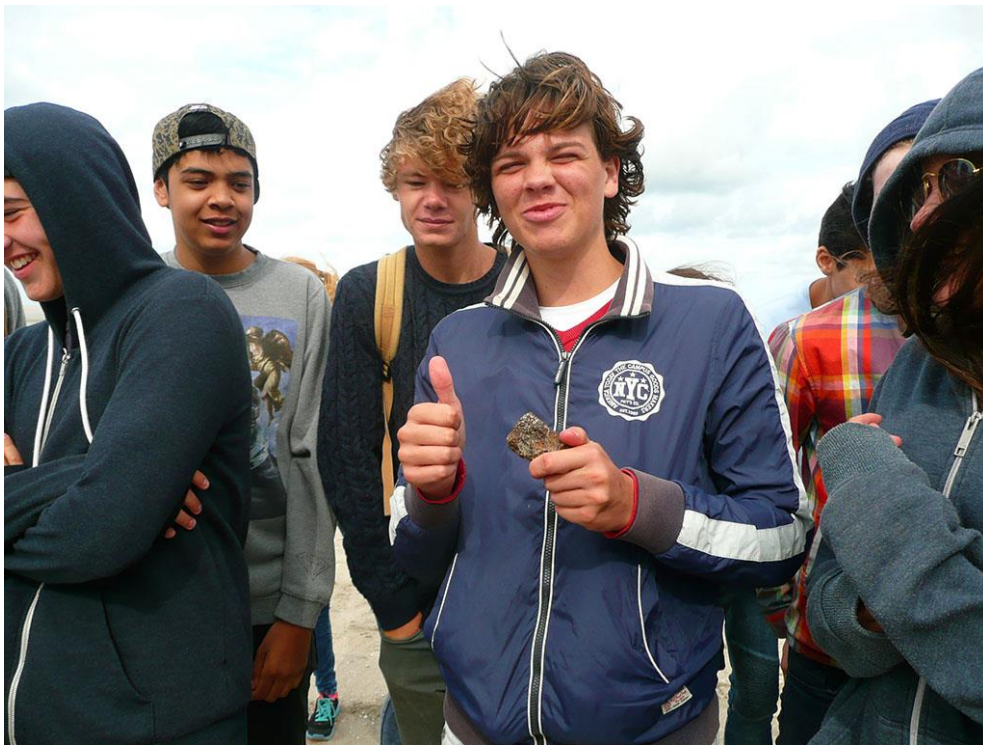
Foto 65: Tal van schoolklassen bezoeken de Zandmotor en genieten van wat die te bieden heeft.