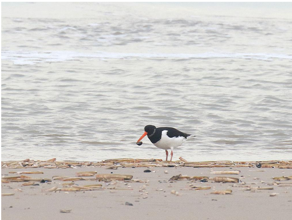
Foto 53: Een scholekster heeft een verse mossel gevangen. Nu nog de sluitspier open zien te krijgen...