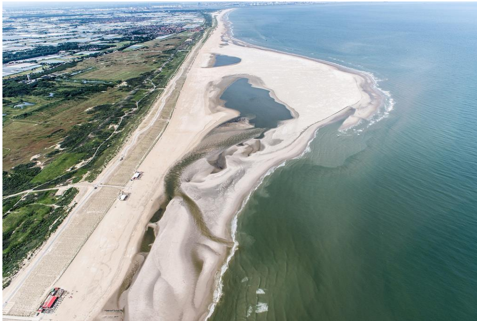
Foto 3: Op 2 juli 2012 zijn zandbank en wadplaten flink gegroeid. Vanwege de hoge stroomsnelheid is de lange stroomgeul afgedamd en is er een nieuwe, korte verbinding met de Noordzee gegravend.