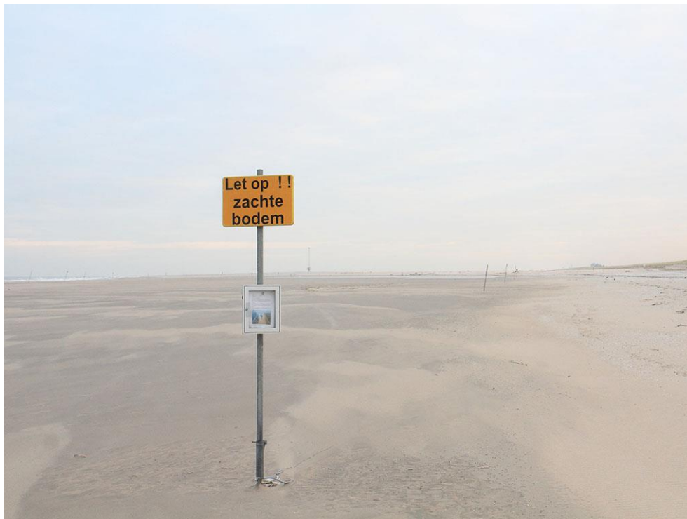
Foto 26: Een van de vele waarschuwingsborden bij een tijdelijke locatie met klapzand of drijfzand.