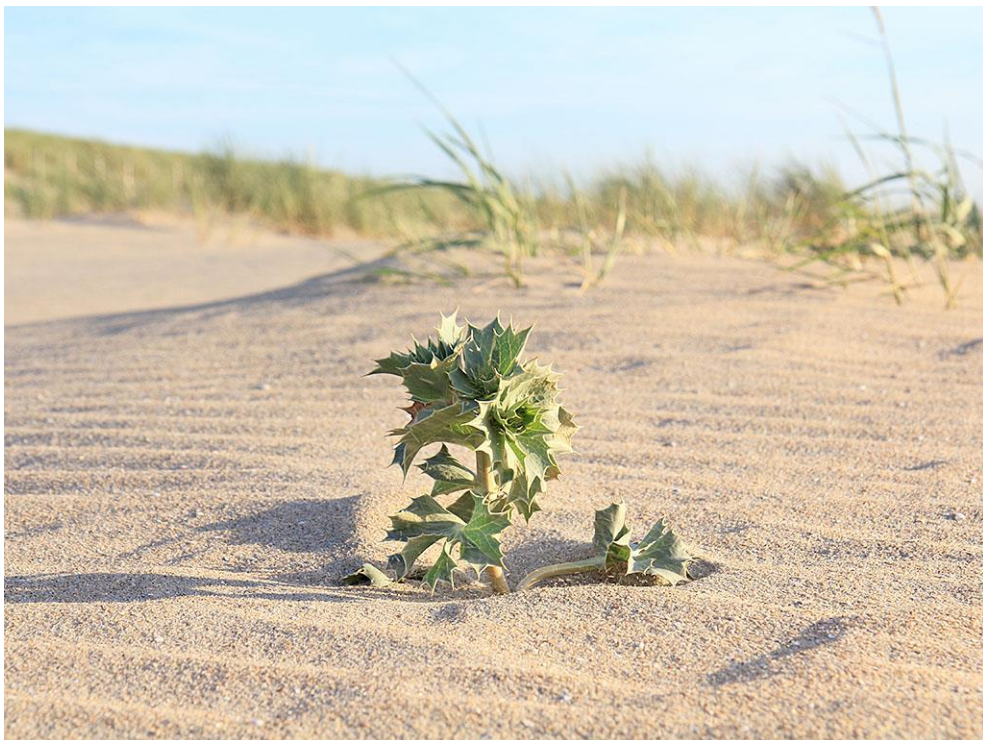
Foto 30: Blauwe zeedistel en zandhaver (op de achtergrond) groeien aan de voet van het jonge witte duin.

In het tweede jaar ontstaan nieuwe pionierduintjes rondom zeeraket en een enkeling rondom polletjes helm en biestarwegras van het jaar daarvoor. Ook verschijnen de eerste jonge duintjes aan de voet van de zanddijk, die was aangelegd in het kader van de Delftlandse kustversterking. Zeeraket voert nog steeds de boventoon, maar soorten als