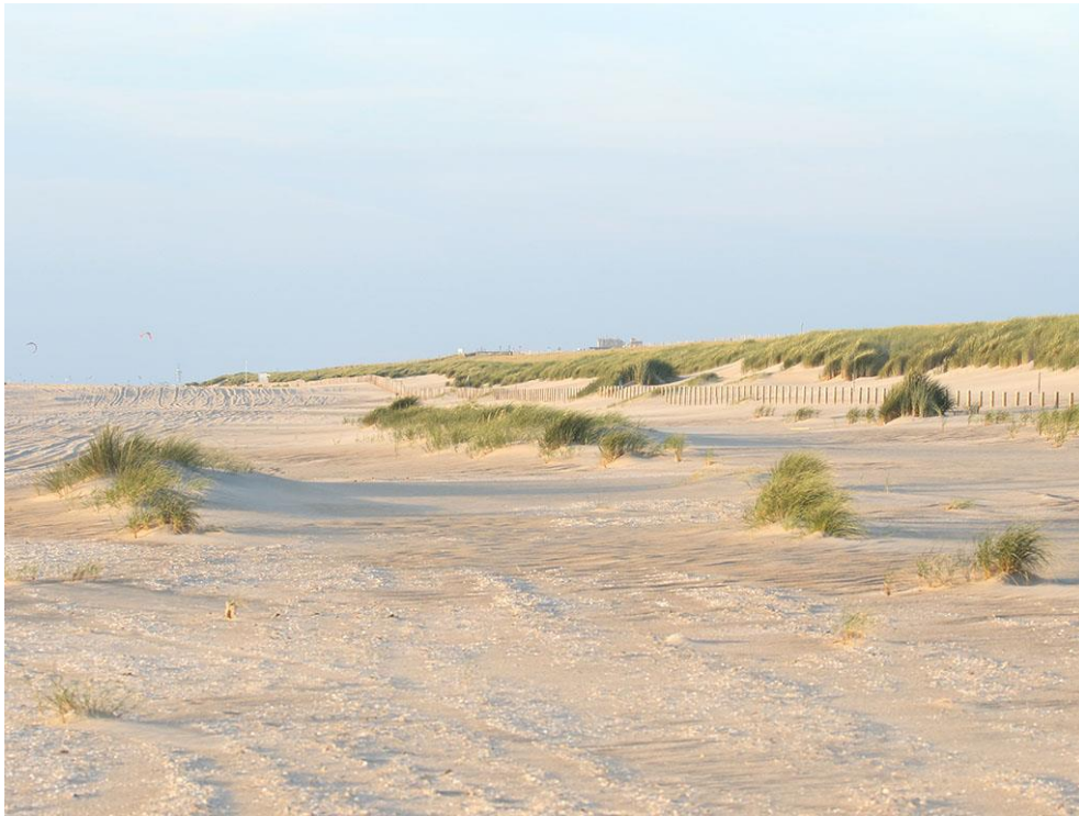
Foto 72: Door de Zandmotor ontstane jonge pionierduintjes en jong wit duin versterken nu al de kust tussen Monster en Den Haag.

Na ruim vier jaar heeft de Zandmotor tot een enorme groei aan embryonale duintjes en wit duin geleid. De variatie aan planten en dieren is nog beperkt, maar neemt duidelijk toe en zal de komende jaren verder toenemen. De aanwezigheid van de Zandmotor als golfbreker en zandbuffer voor de achterliggende duinen vormt niet alleen de motor achter het ontstaan van embryonale duintjes en wit duin, maar heeft het ook mogelijk gemaakt dat wind en water mogen spelen met deze jonge duinen, zodat erosie en sedimentatie elkaar op de lange termijn in evenwicht kunnen houden. En laat dat nu juist de motor zijn achter de natuurlijke biodiversiteit van jonge duinen aan de kust. Natuurlijke biodiversiteit die er dankzij de Zandmotor weer mag zijn.