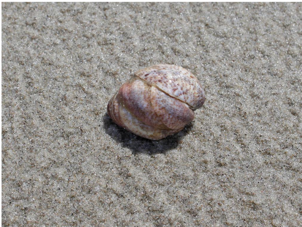
Foto 47: Aangespoelde muiltjes, een soort zeelak. De bovenste is een mannetje, de middelste veranderen van geslacht en de onderste is vrouwtje.