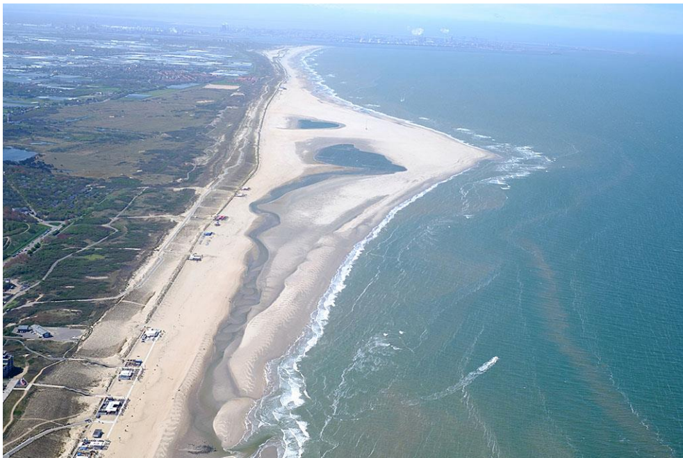
Foto 10: De Zandmotor op 4 mei 2015. De stroomgeul is langer dan ooit tevoren, er zijn meer wadplaten en zandbanken, maar de westpunt is smaller geworden. Sterke aanvoer van zand vanaf de westpunt naar het noorden laat de zandbank groeien. Sterke meandering van de stroomgeul zorgt daarentegen soms voor doorbraken door de zandbank en daarmee krimp van de geul.