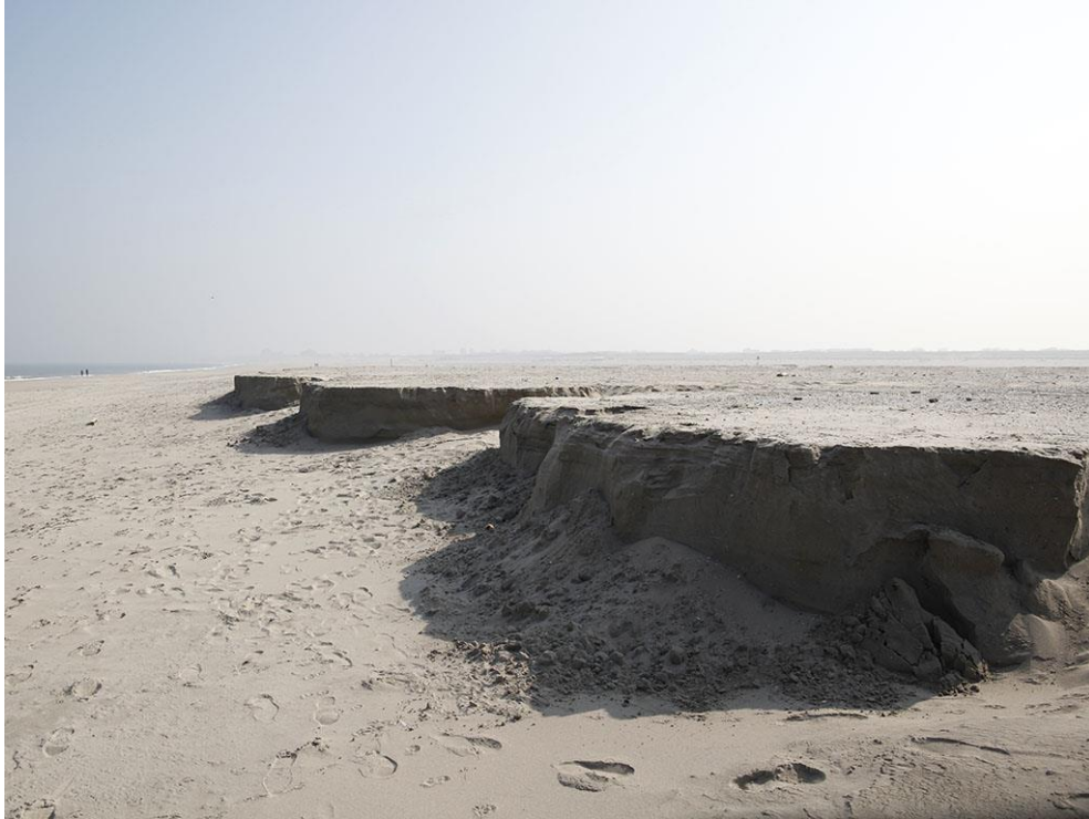
Foto 66: De voortschrijdende erosie maakt dat telkens weer nieuwe fossielen uit het zand tevoorschijn komen.