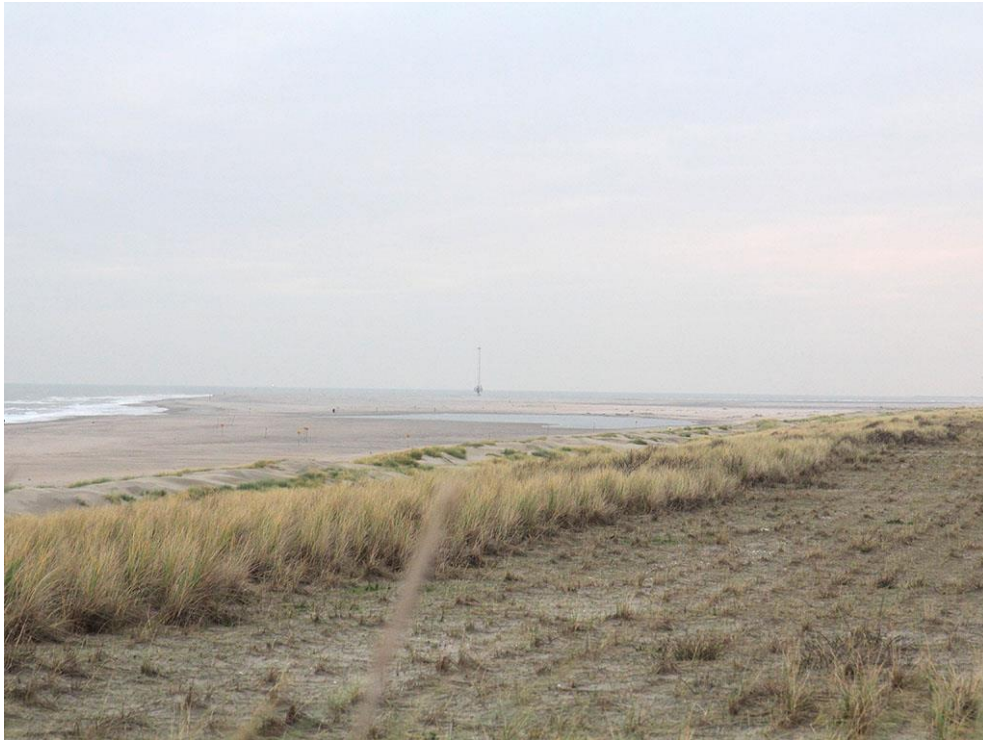
Foto 32: Op de zanddijk kleurt het helmgras geel, maar daarachter op het witte duin groen.

forse pollen biestarwegras, zandhaver en zeepostelein. Her en der staan jonge blauwe zeedistels en wat stekend loogkruid.