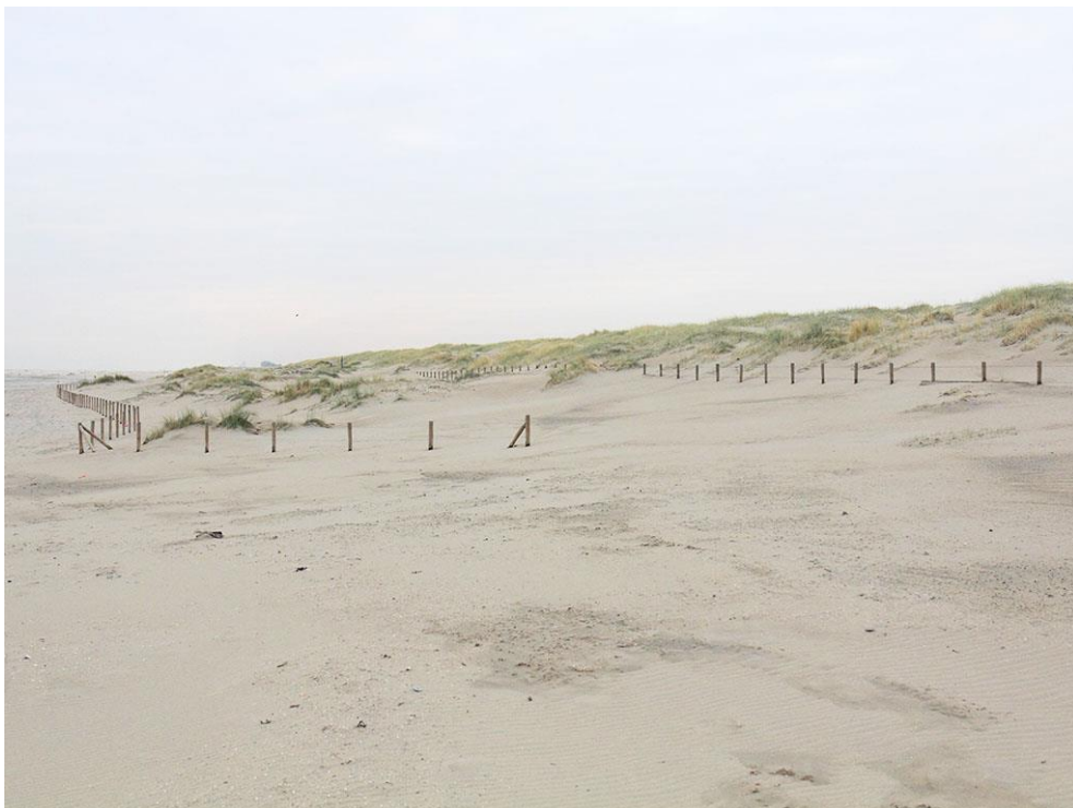
Foto 33: Een nieuwe rij draad beschermt de jonge duintjes. Het oude raster is deels ondergestoven. De meeste bezoekers van de Zandmotor zien echter liever geen raster (bron: Recreatiemonitor Zandmotor 2015).