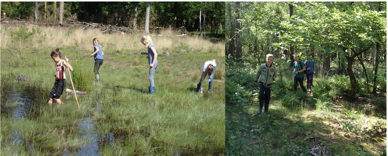
Bij de veldles draait het om struinen, genieten, ontdekken en verwonderen.

In groepjes van 4 -6 kinderen met een begeleidende ouder gaan de kinderen aan de slag. De speciaal voor deze locatie ontwikkelde opdrachtkaarten helpen hen om beter te kijken en te onderzoeken. Titels van de opdrachtkaarten: Op expeditie; Wisenten; Vraat; Vogels; Planten; Kleine beestjes; waterdierdjes; Bos en bomen; Dood dier; Dit gebied; Poep.