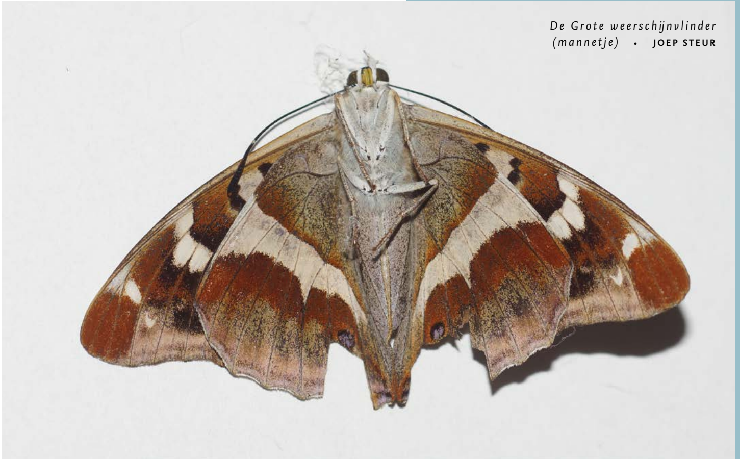
De Grote weerschijnvlinder (mannetje) • JOEP STEUR