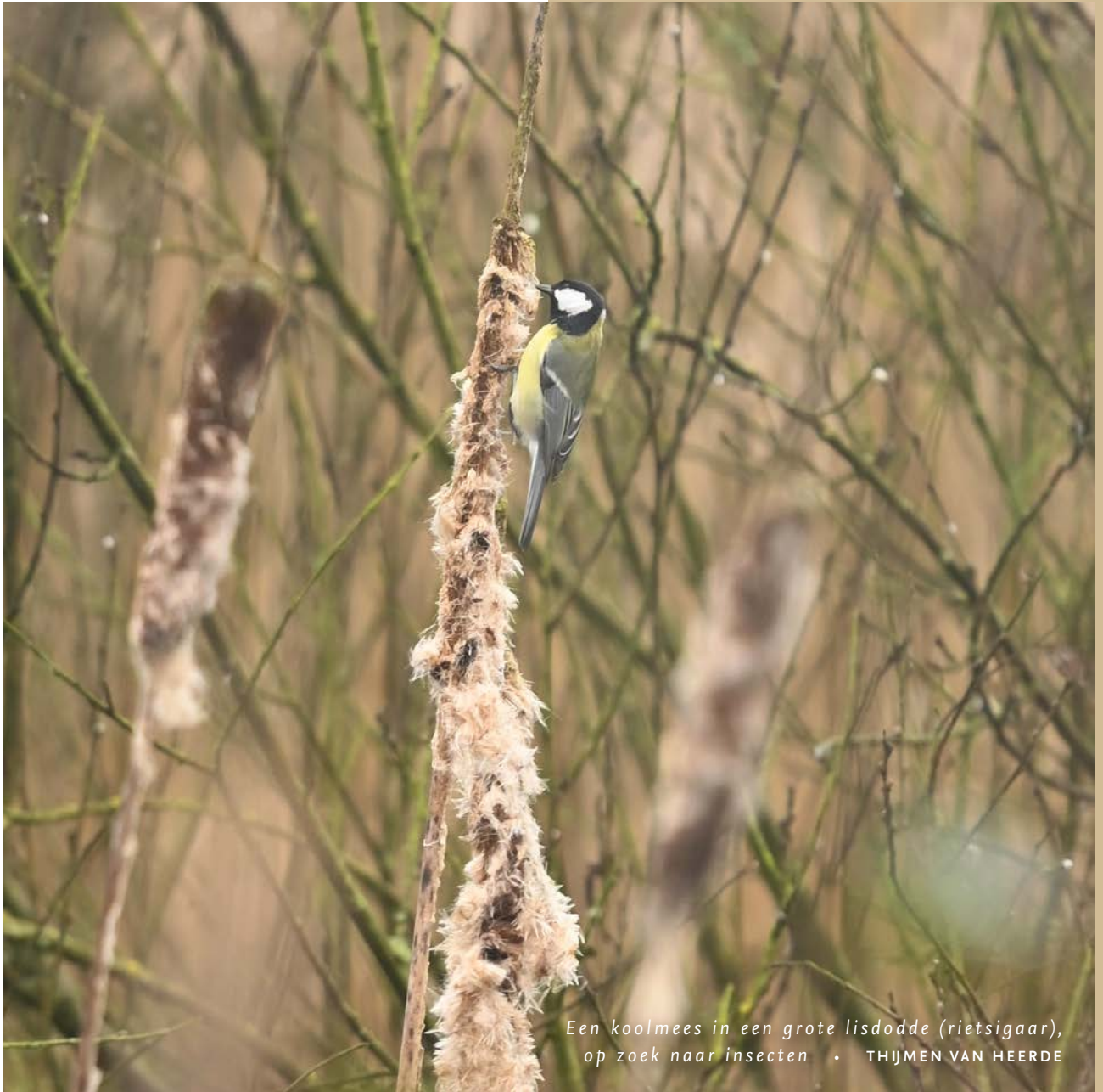
Een koolmees in een grote lisdodde (rietsigaar), op zoek naar insecten • THIJMEN VAN HEERDE