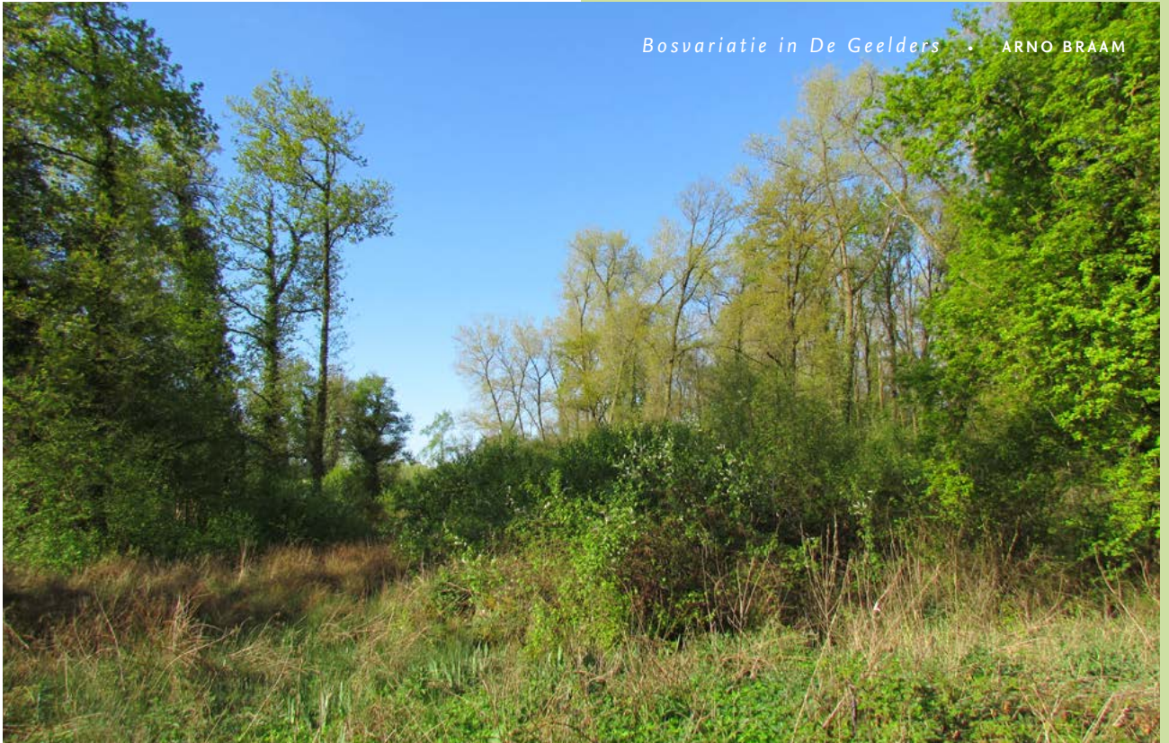
Bosvariatie in De Geelders • ARNO BRAAM