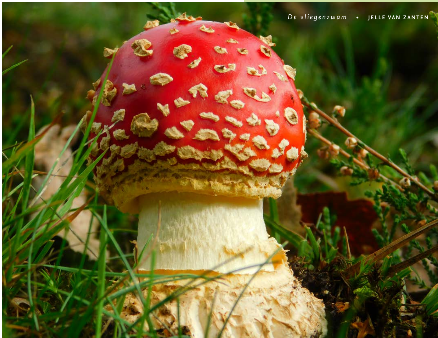
De vliegenzwam • JELLE VAN ZANTEN