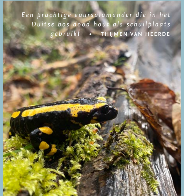
Een prachtige vuersalamander die in het Duitse bos dood hout als schuilplaats gebruikt

Borkener Paradies is een oud bos dat al heel lang begraaasd wordt. De dieren lopen hier tussen het voorjaar en het najaar vrij rond. Met hun aanwezigheid zorgen ze voor kleinschalige open plekjes en houden ze de aanwezige open weides kort. Op de tweede locatie, Am Baumweg, stonden we stil bij prachtige haagbeuken die vroeger werden geknot en daardoor heel bijzondere vormen aannamen. Tot een aantal jaren geleden werd ook dit gebied begraaasd. Hierdoor is het haagbeuken-eikenbos langzaam veranderd in een beukenbos.