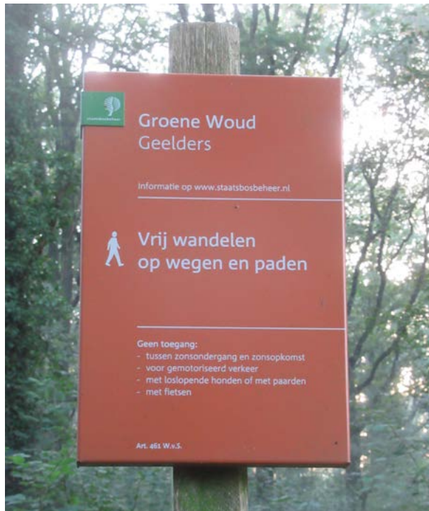
In De Geelders en op andere plaatsen wijzen borden van Staatsbosbeheer eveneens op een verbod op loslopende honden.