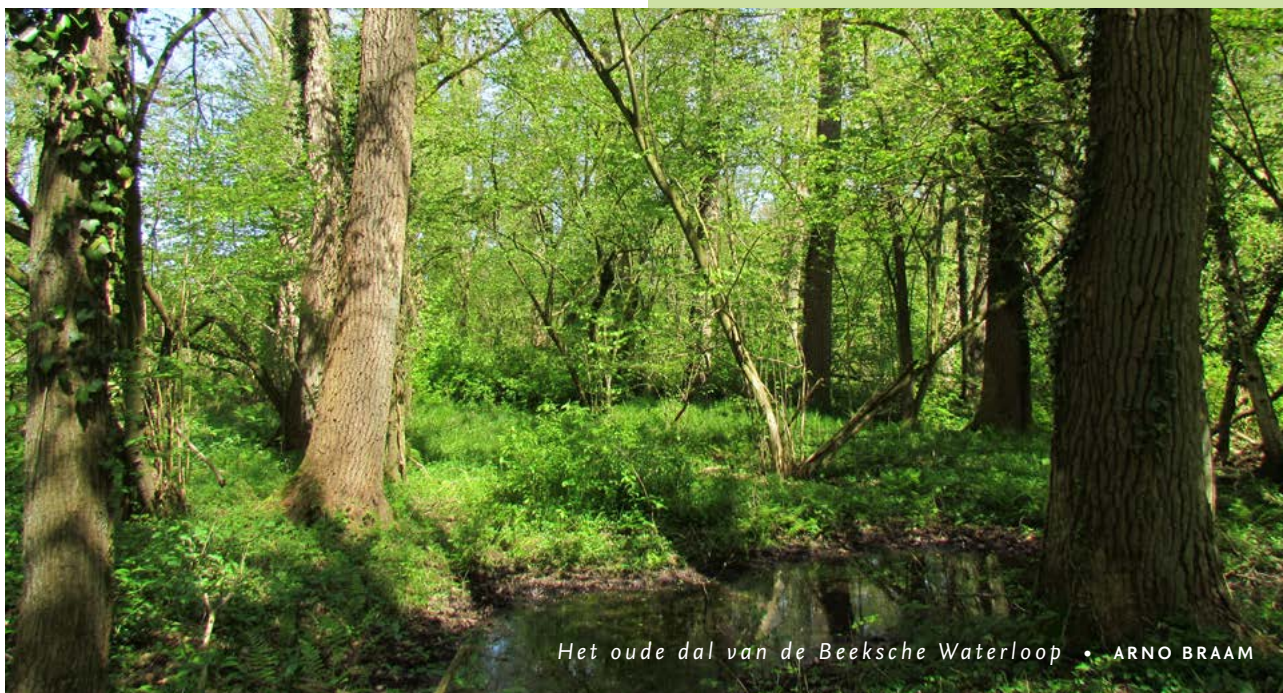
Het oude dal van de Beeksche Waterloop • ARNO BRAAM

De hoge delen (donkergroen) van Hooge Beek planten we aan met hoge snel- en langzaam groeiende boomsoorten. Op de lage delen (middelgroen) komen langzaam groeiende boomsoorten. De overige delen (lichtgroen) blijven open.