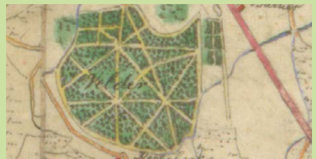
Een fragment van de kaart van Hendrik Verhees (1794) met Velder en het westelijk gelegen landgoedje.

decennialang niet meer herkenbaar als zodanig. Enkel op een moderne, zeer gedetailleerde digitale hoogtekaart zijn kleine hoogteverschillen te zien die een landgoedachtige structuur prijsgeven. Verder licht de Meerijkaart uit 1794 van de Boxtelse kaartenmaker Hendrik Verhees nog een tipje van de sluier op. Daarop wordt het landgoedje namelijk goed weergegeven, inclusief lanen. Op een kaart van Verhees van vijf jaar eerder zijn die lanen nog niet te zien. Zo hebben we dus een indicatie van wanneer de lanen zijn aangelegd. Opmerkelijk: dit gebiedje draagt het toponiem Sterrebos. Daarmee heeft de geschiedenis van dit deel van 'Groot-Velder' toch ergens een plekje veroverd in het collectieve geheugen.