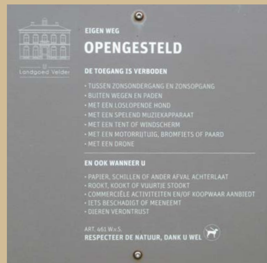
Op Velder hangen bordjes waarop staat dat loslopende honden niet zijn toegestaan.

In beide gebieden geldt dat mensen er gewoon mogen komen, maar wel op voorwaarden van de terreineigenaren. Dit is conform artikel 461 in het Wetboek van Strafrecht. Die voorwaarden behelzen hier onder meer een 'verbod op loslopende honden'. Verder is er nog de Wet natuurbescherming – artikel 3,24 lid 5. Die legt hondeneigenaren een zogenoemde zorgplicht op. Deze houdt in dat hondeneigenaren moeten voorkomen dat een hond schade veroorzaakt aan flora en fauna. Daarom doen we voor onze ARK-percelen een oproep: wees welkom in de natuur, maar houd uw hond aangeliend.