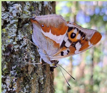
Grote weerschijnvlinder DIRK EIJKEMANS