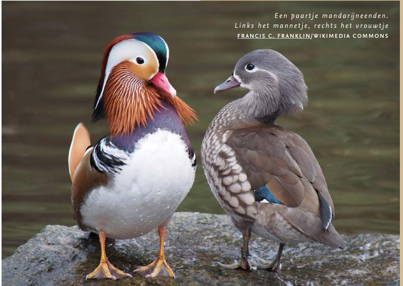
Een paartje mandarijneenden. Links het mannetje, rechts het vrouwtje