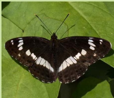
Kleine ijsvogelvlinder DIRK EIJKEMANS

Om het Natuurnetwerk Brabant te realiseren, verwerft ARK Rewilding Nederland gronden in Het Groene Woud. Dat doen we in het kader van het natuurrealisatieproject Brabants Goud in Het Groene Woud. Per 1 oktober 2023 beschikten we over ruim 387 hectare grond. De ARK-methode: we verwerven gronden, zorgen voor de natuurinrichting en het tijdelijk beheer ervan. Ons meest recente Brabants Goud-perceel ligt aan de Hoogstraat op Savendonk in De Geelders.