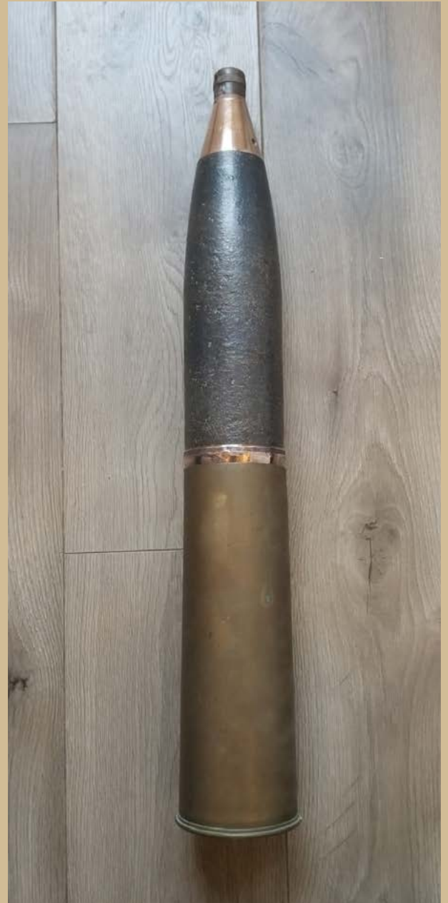
Zo zagen de granaten (zoals het gevonden exemplaar) eruit in ongeschonden vorm DIRK EIJKEMANS

Bij het aanplanten van de ARK-percelen op de Wielse Kamp vond Dirk Eijkemans begin april 2024 de resten van een granaat uit de Tweede Wereldoorlog. Deze is vermoedelijk afkomstig van de geallieerden die in het najaar van 1944 met de zogenoemde granaatweken Schijndel in angst hielden. Daarbij werden in Schijndel meer dan honderd huizen en boerderijen volledig vernield en vielen er 85 dodelijke slachtoffers.