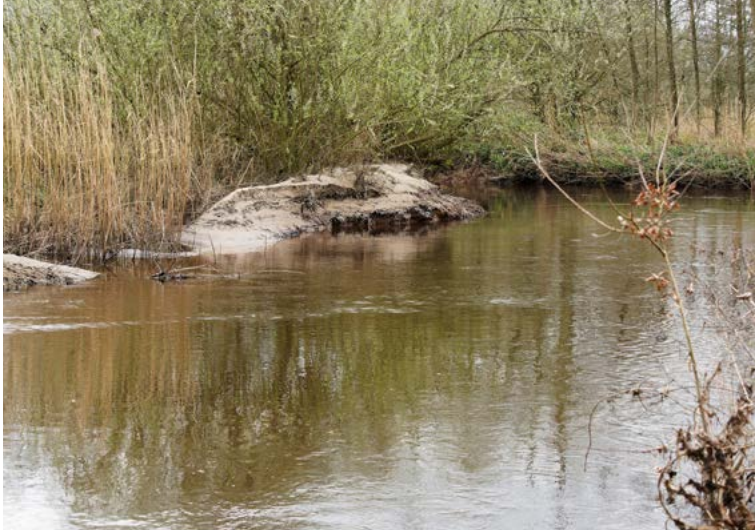
Sediment op de Dommeloever in De Maai bij Liempde (maart 2024)