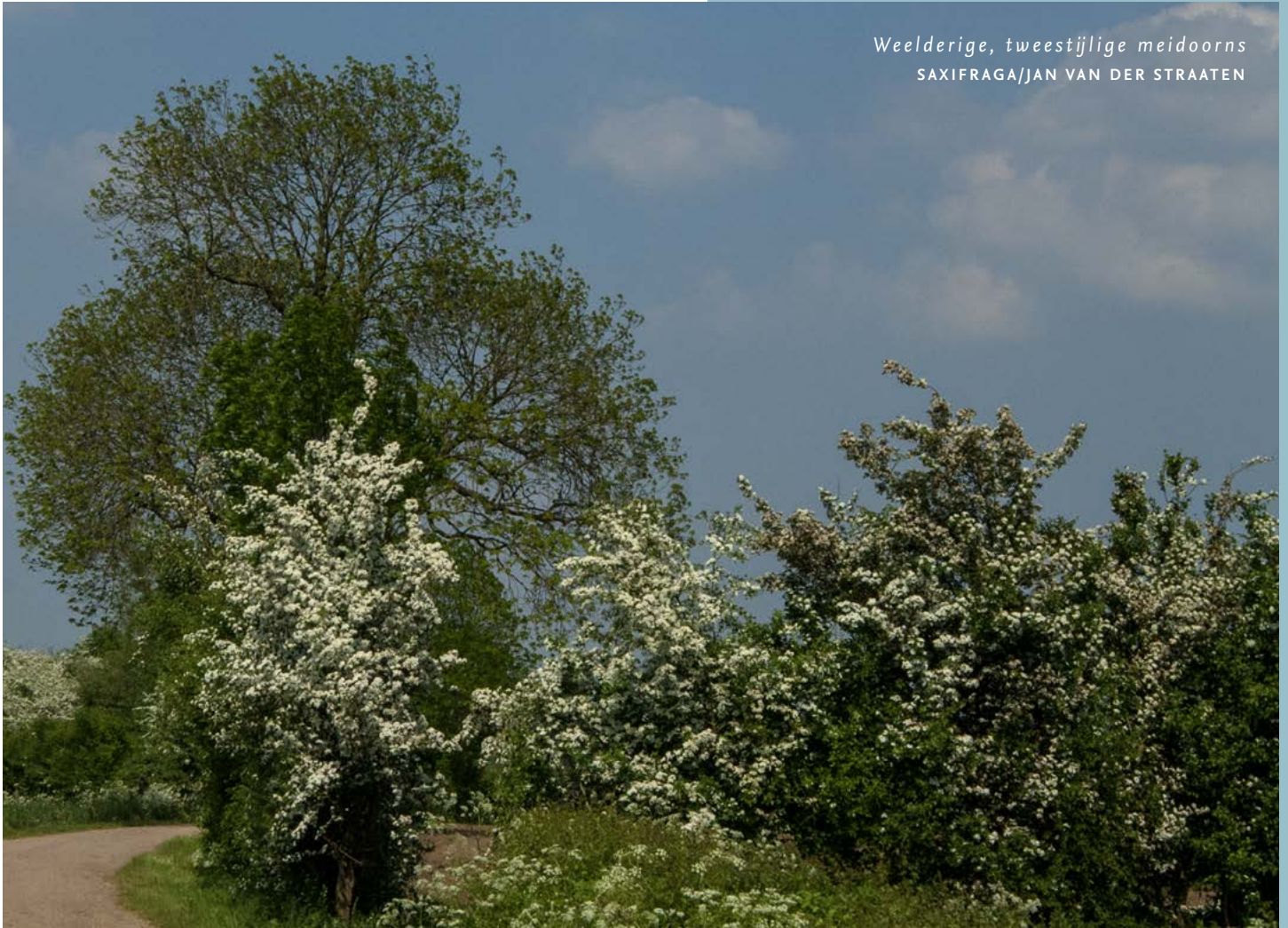
Weelderige, tweestijlige meidoorns