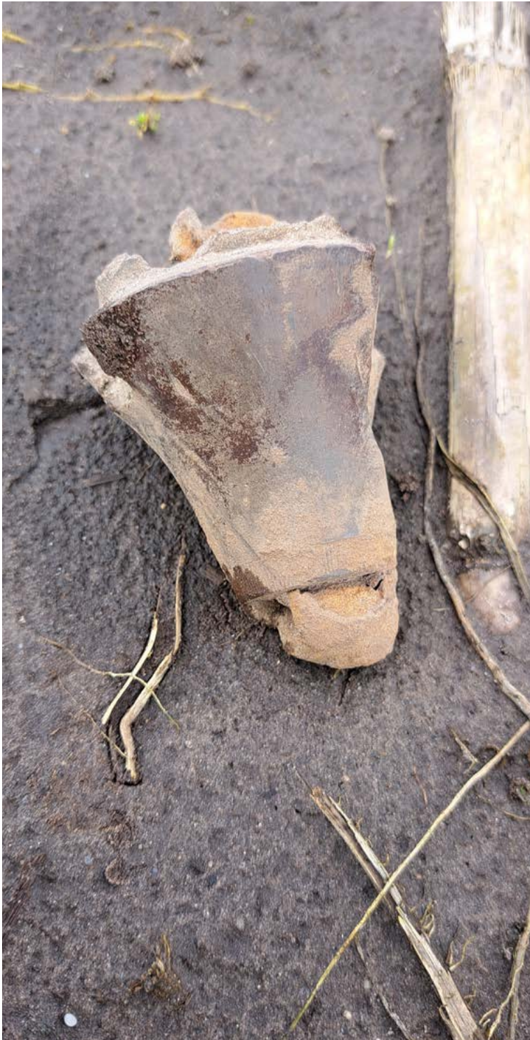
De gevonden granaatresten op de Wielse Kamp DIRK EIJKEMANS