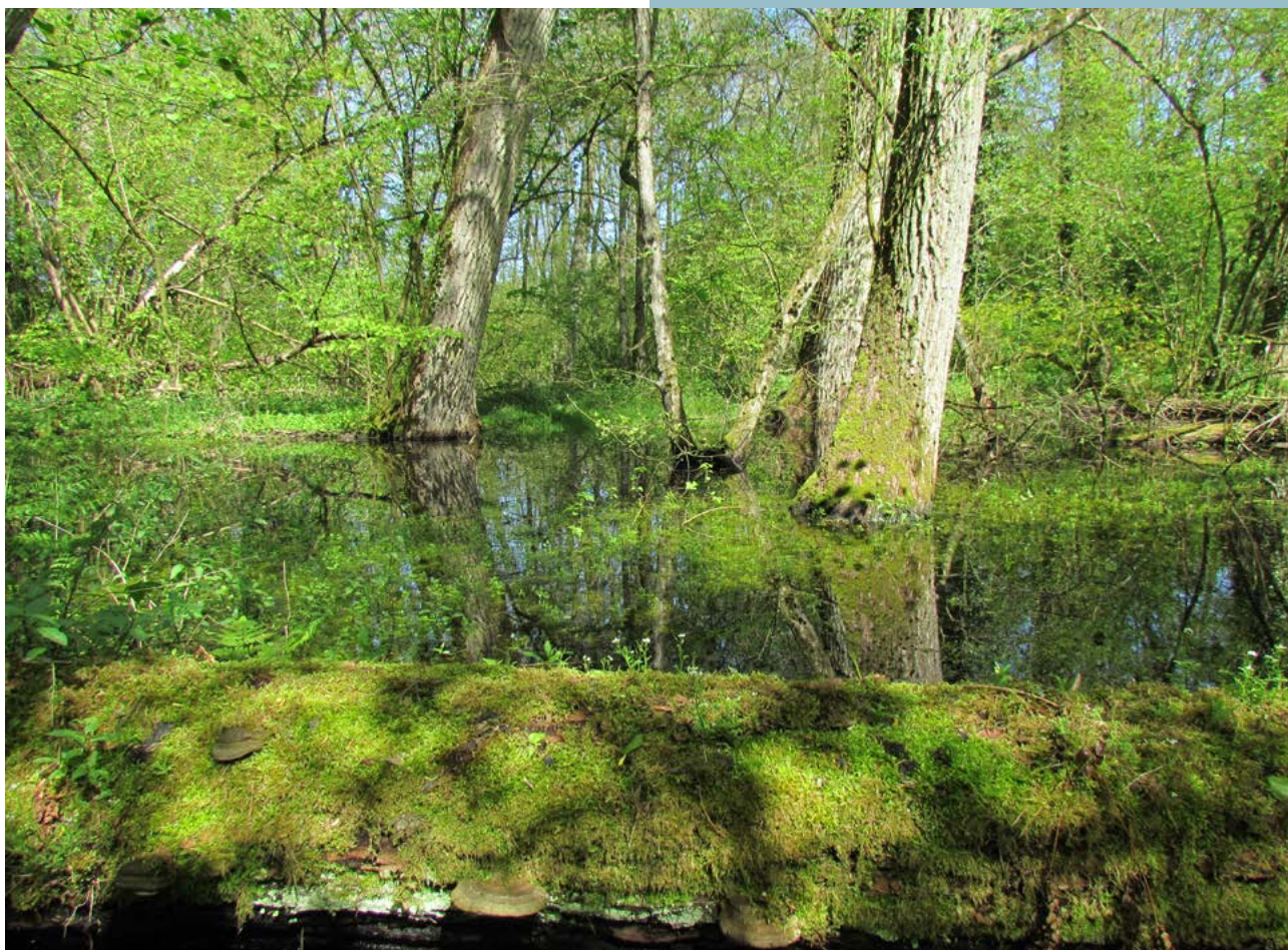
Robuuste natuur in De Gelders, in het dal van de Beeksche Waterloop