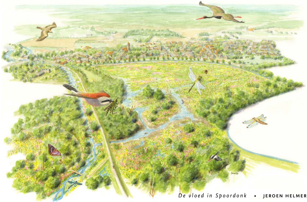
De vloed in Spoordonk • JEROEN HELMER