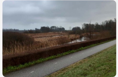
Openheid moeras: verwijderen populierenrij voor en na (okt/nov. 2021)