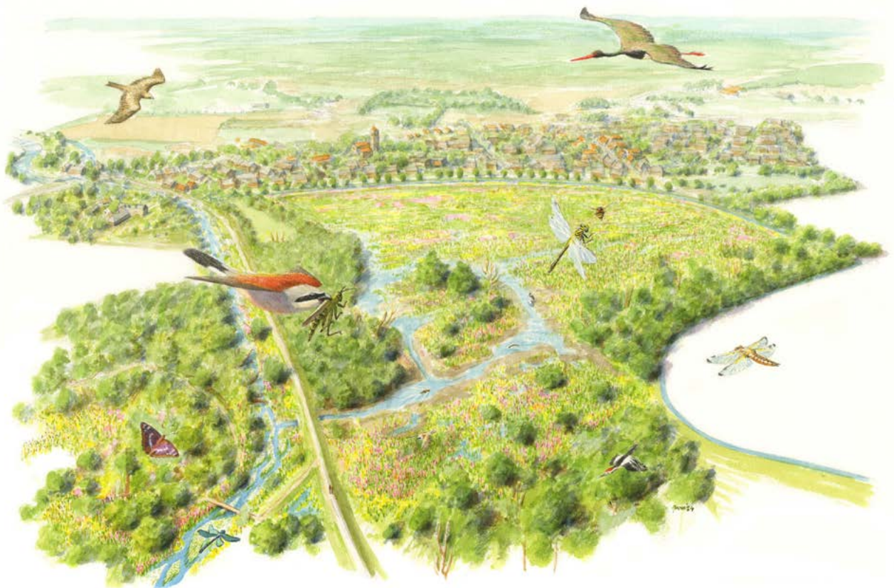
Deze sfeerschets laat zien hoe De Vloed er na de inrichting uit komt te zien. • JEROEN HELMER

Tijdens de informatieavond lichtten we onder meer toe hoe het plan tot stand is gekomen, welke onderzoeken er hebben plaatsgevonden en welke partijen daar allemaal bij betrokken waren. Daarna was er volop ruimte voor dialoog. Daarbij stonden we ook uitvoerig stil bij de zorgen die buurtbewoners hebben over de waterhuishouding; al sinds de jaren '60 van de vorige eeuw ervaart Beerseveld met regelmaat wateroverlast. Een hydroloog van Royal Haskoning gaf daarop uitleg over de werking van het watersysteem dat we hier voor ogen hebben. Daarbij werd ook duidelijk dat de herintroductie van De Vloed geen nadelig effect heeft voor omwonenden. Dat komt omdat de bestaande, ervaren overlast buiten het plangebied ligt. Hierover gaan de gemeente Oirschot en Waterschap De Dommel dan ook apart met bewoners in gesprek.