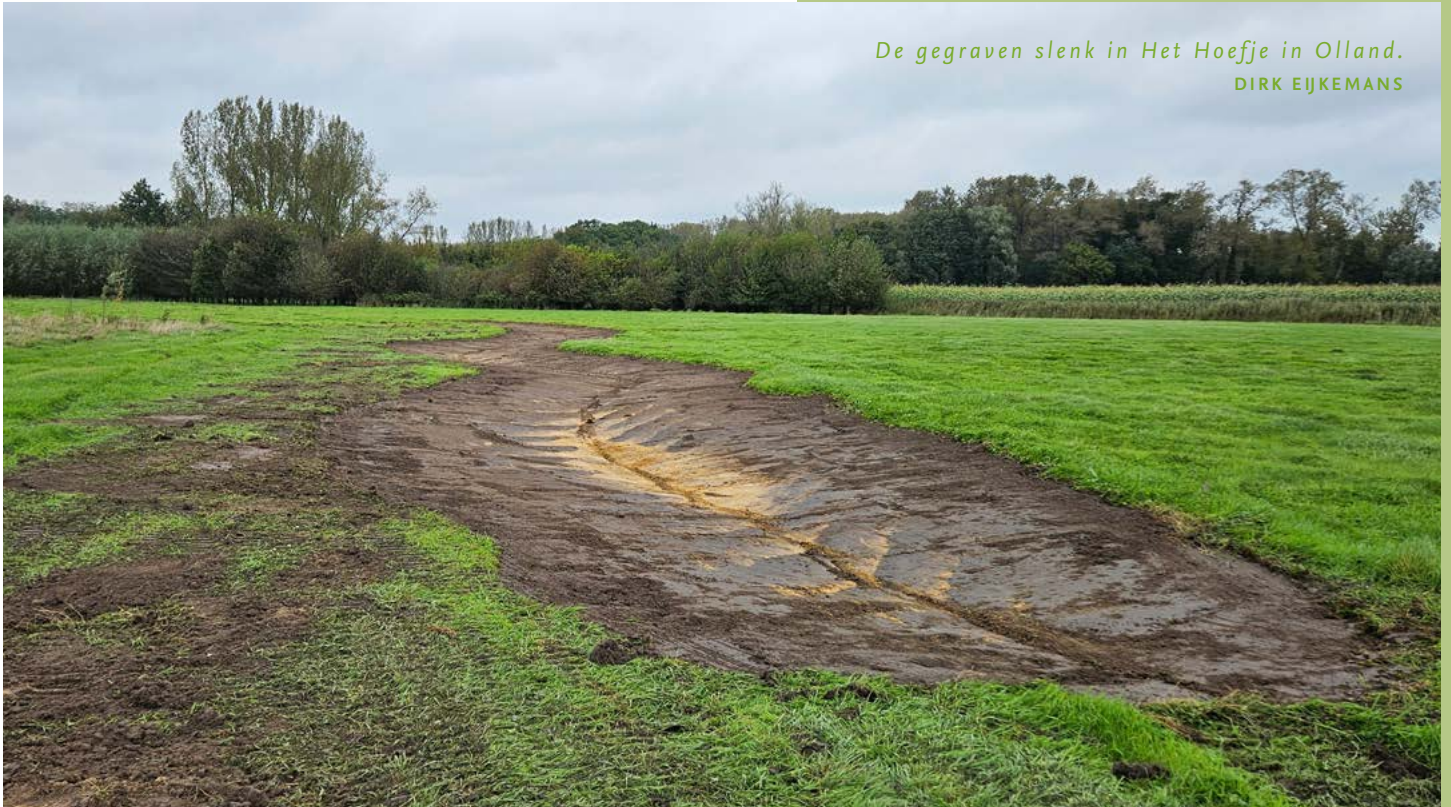
De gegraven slenk in Het Hoefje in Olland.