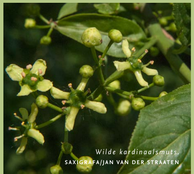
Wilde kardinaalsmuts.