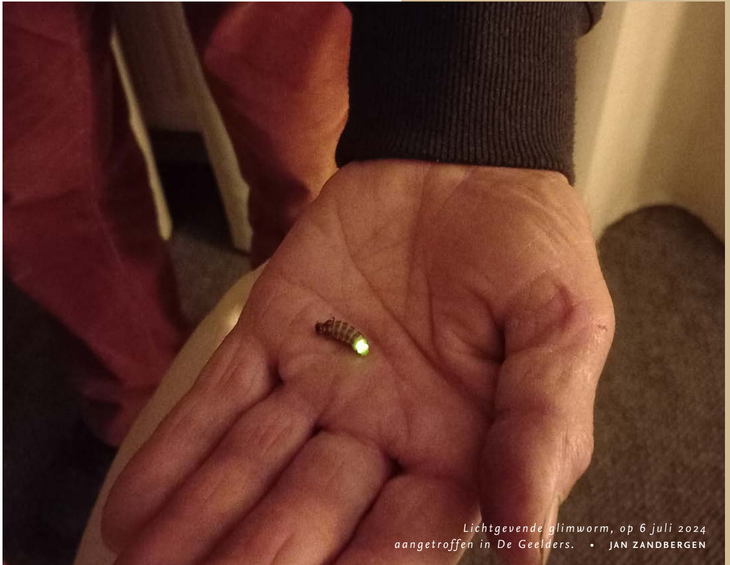
Lichtgevende glimworm, op 6 juli 2024 aangetroffen in De Geelders. • JAN ZANDBERGEN

Bijzonder aan glimwormen is dat ze een geelgroenig licht produceren. Dit proces heet 'bioluminescentie'. Hierbij spelen speciale organen in het achterlijf, het enzym luciferase en (oxidatie van) het pigment luciferine een hoofdrol. Gecombineerd met een laag lichtproducerende cellen en een laagje kristallen(!) is het glimwormlijfje wonderbaarlijk genoeg in staat om licht te geven. Volwassen exemplaren gebruiken het licht om elkaar op te sporen tijdens de voortplanting. Hier zit hem meteen ook de kwetsbaarheid van de soort: in onze bewoonde omgeving is het 's nachts vaak te licht waardoor het glimwormen niet lukt een partner te vinden.