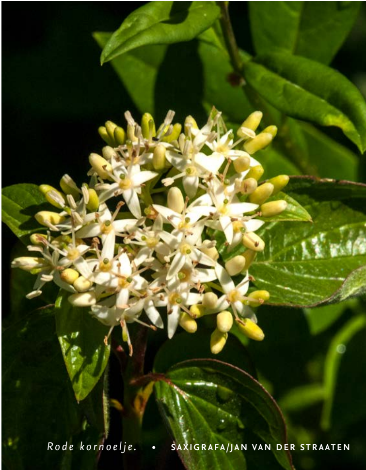
Rode kornoelje.