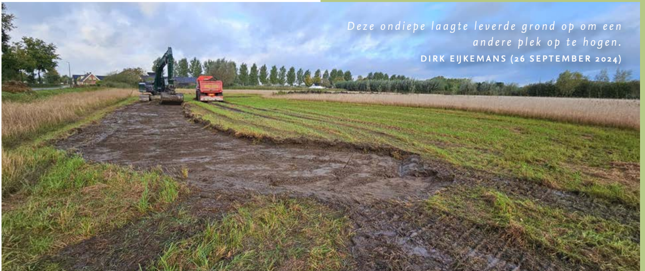
Deze ondiepe laagte leverde grond op om een andere plek op te hogen. DIRK EIJKEMANS (26 SEPTEMBER 2024)