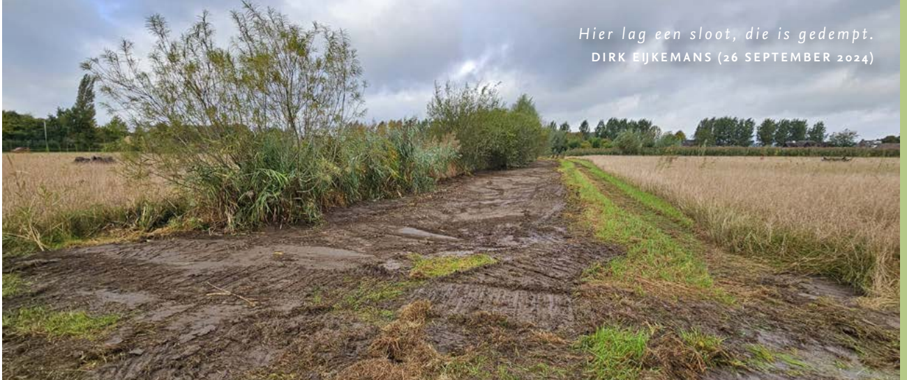
Hier lag een sloot, die is gedempt. DIRK EIJKEMANS (26 SEPTEMBER 2024)