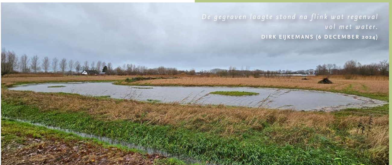
De gegraven laagte stond na flink wat regenval vol met water. DIRK EIJKEMANS (6 DECEMBER 2024)