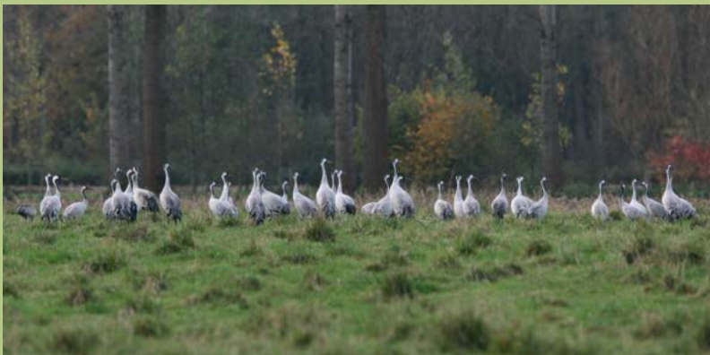
Kraanvogels in De Scheeken.

Om het Natuurnetwerk Brabant te realiseren, verwerft ARK Rewilding Nederland gronden in Het Groene Woud. Dat doen we in het kader van het natuurrealisatieproject Brabants Goud in Het Groene Woud. Per 1 december 2024 beschikten we over ruim 472 hectare grond. De ARK-methode: we verwerven gronden, zorgen voor de natuurinrichting en het tijdelijk beheer ervan. Een van onze meest recente Brabants Goud-aankopen ligt in de Mortelen-Polsdonken (Oirschot).