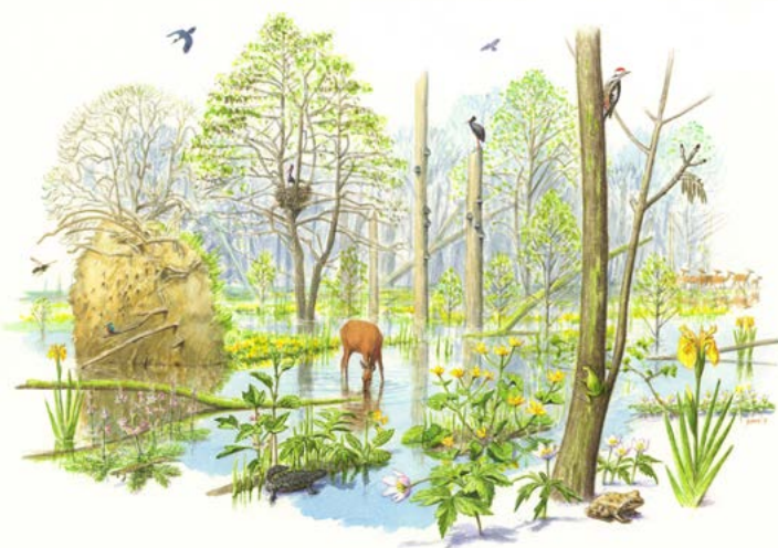
Het droombeeld van een leembos waar de natuur haar gang mag gaan.

Geboeid luisterden ze ook naar de uitleg over de waarde van omgevallen bomen en hoe dieren een rol spelen bij het laten ontstaan van een gevarieerd bos. Verhalend over de andere ARK-gebiedsprogramma’s in Nederland waren de kinderen bovenmatig geïnteresseerd in het herstel en de aanleg van oesterriffen in Zeeland en het waterleven in de Nederlandse rivieren en de Noordzee. Zo werd deze boomfeestdag in Lennisheuvel onverwachts een dag waarop de jonge generatie niet alleen kennismakte met het thema rewilding maar er ook erg enthousiast van werd.