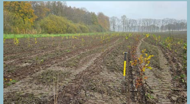
Aan de Leemweg op de Schijndelse Molenheide plantten we op 13 november jl. 2.575 bomen. ↑