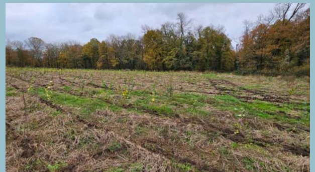
Op de Hooge Beek gingen op 14 november jl. 3.500 bomen de grond in. ↓