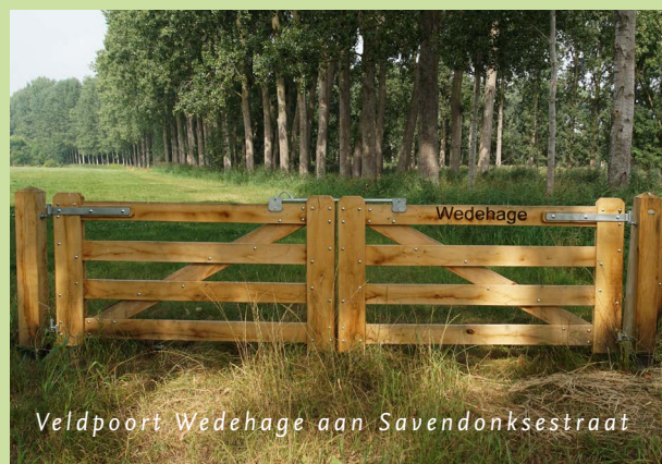
Veldpoort Wedehage aan Savendonksestraat

Soms is het nog nat in De Geelders, maar niet voor lange duur. Plan Savendonk moet het tij gaan keren. Weten hoe Savendonk er vanuit de lucht uitzag in maart 2020? Bekijk hier de dronebeelden van het gebied in deze periode.