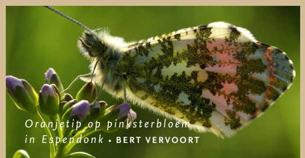
Oranjetip op pinksterbloem in Espendonk

In deze gebieden treffen we inrichtingsmaatregelen tegen verdroging. Dat doen we onder meer met de aanplant van nieuwe loofbomen en versterking van de bestaande bossen. Hierbij werken we nauw samen met onder meer Staatsbosbeheer. Die heeft met name ook rondom Wolfswinkel (tussen Nijnsel en Son) diverse gronden liggen. De nieuwe en versterkte bossen zullen, net zoals in De Geelders, de biodiversiteit bevorderen. Ook gaan ze hier als klimaatbuffer werken en zorgen ze voor meer sponswerking en een betere