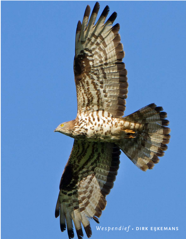
Wespendif • DIRK EJKEMANS