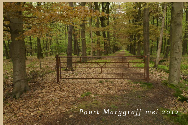
Poort Marggraff mei 2012