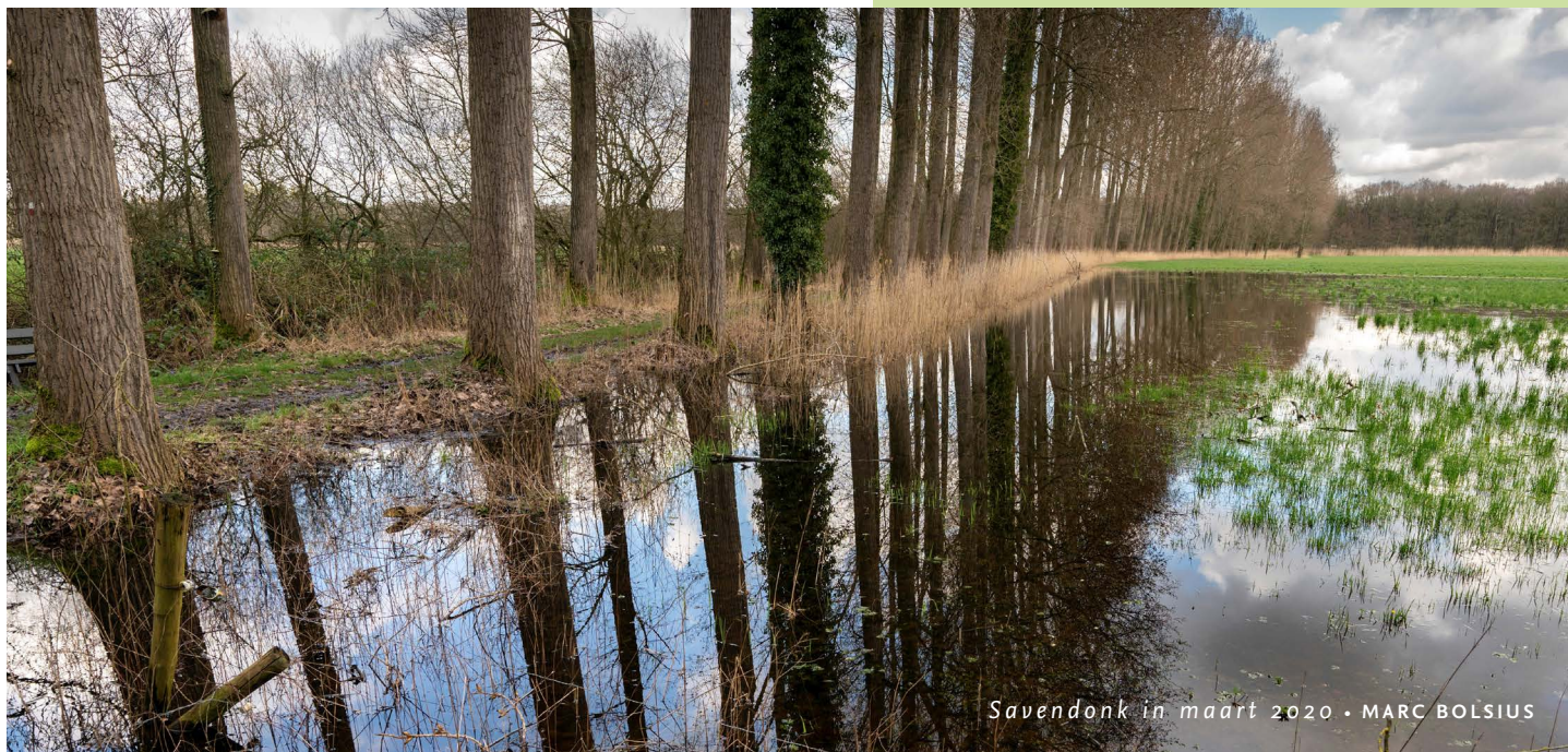
Savendonk in maart 2020