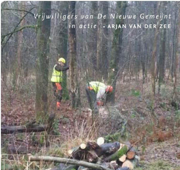
Vrijwilligers van De Nieuwe Gemeijnt in actie • ARJAN VAN DER ZEE

Zeven à acht keer per jaar werken ze in De Geelders: de twintig vrijwilligers van vereniging De Nieuwe Gemeijnt uit Boxtel. Zij onderhouden sinds 2014 een oude boskamp van circa zestien hectare aan de Boxtelse kant van het leembos, compleet met wallen en rabatten. Hun doel: dit deel van De Geelders opener en diverser maken en het historische landschap 'leesbaar' houden.