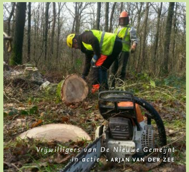
Vrijwilligers van De Nieuwe Gemeijnt in actie

werkdagen ontbreken de soep en broodjes niet, want het sociale aspect van dit vrijwilligerswerk vinden de verenigingsleden eveneens belangrijk. “Maar onze inzet is vooral terug te voeren op onze gedeelde liefde voor natuur, ecologie en de cultuurhistorische waarden van De Geelders. Die willen we in stand houden.” De boskamp die de vereniging beheert, heeft waarden genoeg. Zo liggen er nog wallen uit de Middeleeuwen en is in de rabatten in het gebied het zeldzame oranje-blauw zwemmend geraamte (kieuwpootkreeftje) aangetroffen. Alle reden voor De Nieuwe Gemeijnt om werk te blijven maken van haar beheer. Al heeft Staatsbosbeheer momenteel alle vrijwilligerswerk tijdelijk opgeschort vanwege de coronamaatregelen. Zodra het weer kan, gaan de vrijwilligers weer in De Geelders aan de slag.