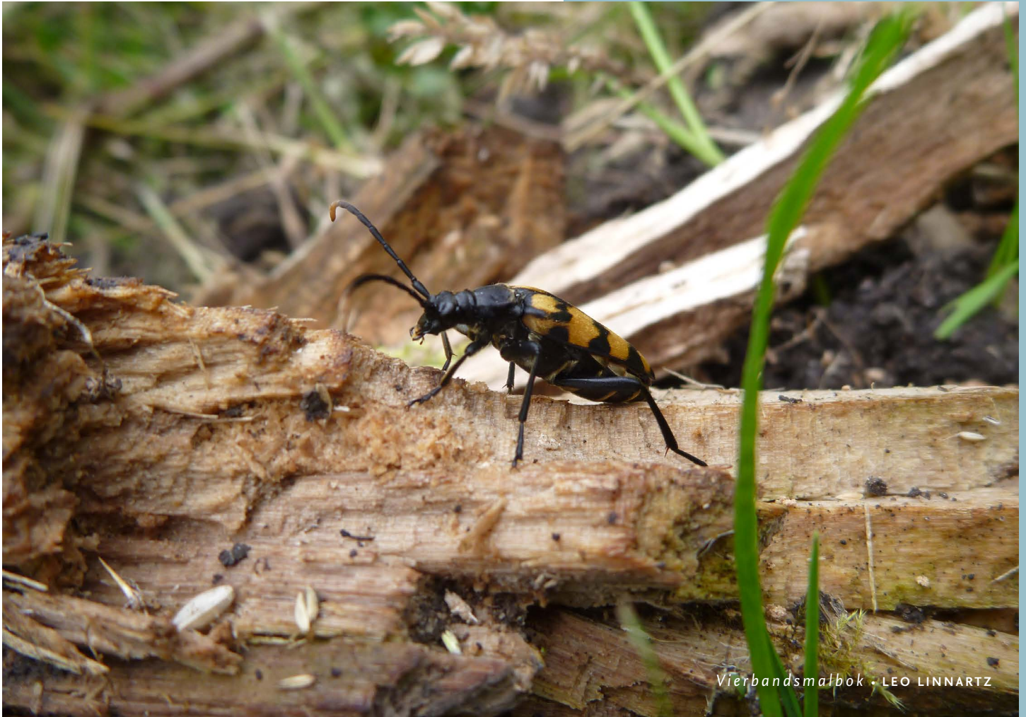
Vierbandsmalbok • LEO LINNARTZ