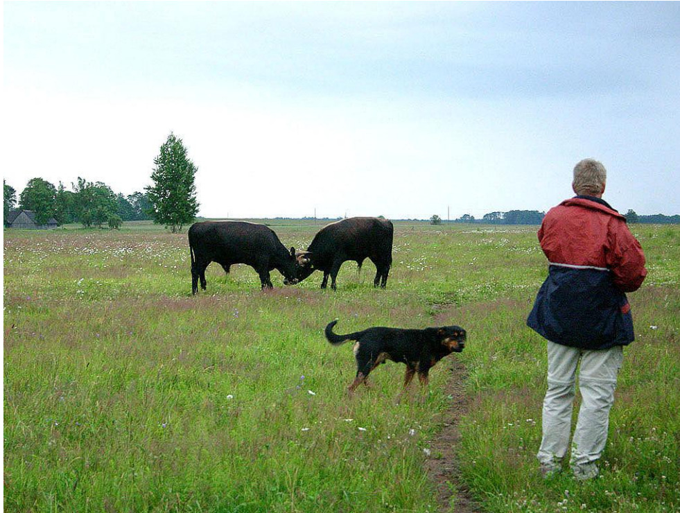
Foto 7: veel runderen beschouwen honden als een soort wolf en handelen ook als zodanig. Als runderen meer met mensen en hun honden in aanraking komen, dan treedt er gewenning op. Toch verdient het aanbeveling om de kat niet op het spek te binden en honden niet toe te laten tot de zone met heckrunderen.