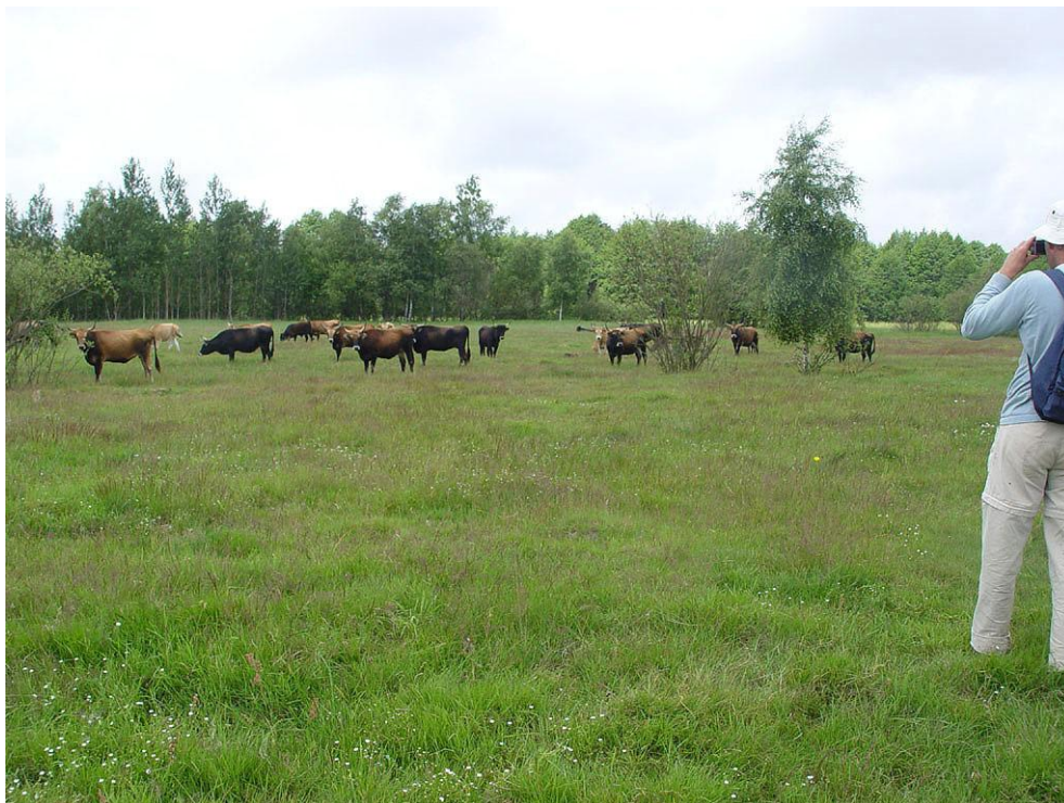
Foto 2: Nederlandse hekrunderen laten in Lake Pape, Letland, zien dat publiek en grazers ook bij dit ras samen kan gaan.