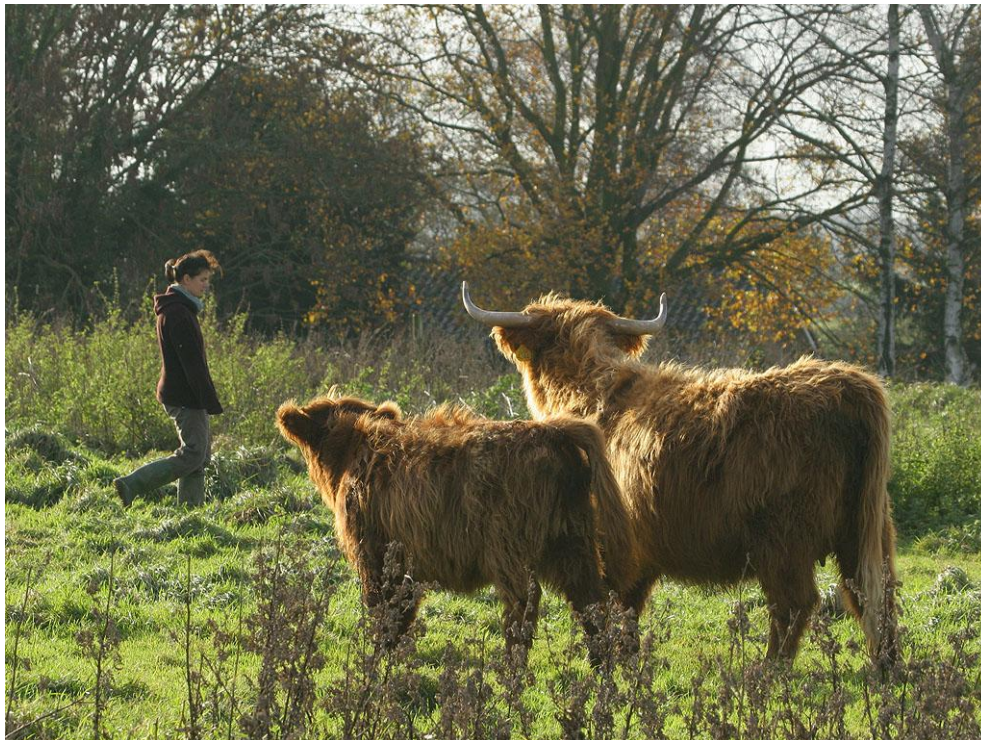
Foto 6: ook bij andere runderrassen moeten bezoekers gepast afstand houden.

Begeleide excursies te voet, een toegespitst jongerenprogramma, goede voorlichting en artikelen in (lokale) media kunnen een belangrijke rol spelen in het opvoeden van het publiek in de omgang met de wilde grazers in het OostvaardersWold. Hierbij moet het verschil tussen de grazers in het OostvaardersWold en andere natuurgebieden nadrukkelijk voor het voetlicht gebracht worden. Het is overigens goed mogelijk dat dit verschil in de loop der tijd verdwijnt. In dat geval dient ook de voorlichting hierop aangepast te worden. Naast voorlichting is ook toezicht nodig op bezoekers in de zone met struinnatuur. Hierbij kunnen bezoekers die zich niet aan de adviezen houden nogmaals gewezen worden op de risico's van hun gedrag (aaien, voeren, etc.). Ook horeca in de omgeving kan hierbij een rol spelen door bijvoorbeeld placemats met informatie over de wilde hoefdieren en hoe er mee om te gaan.