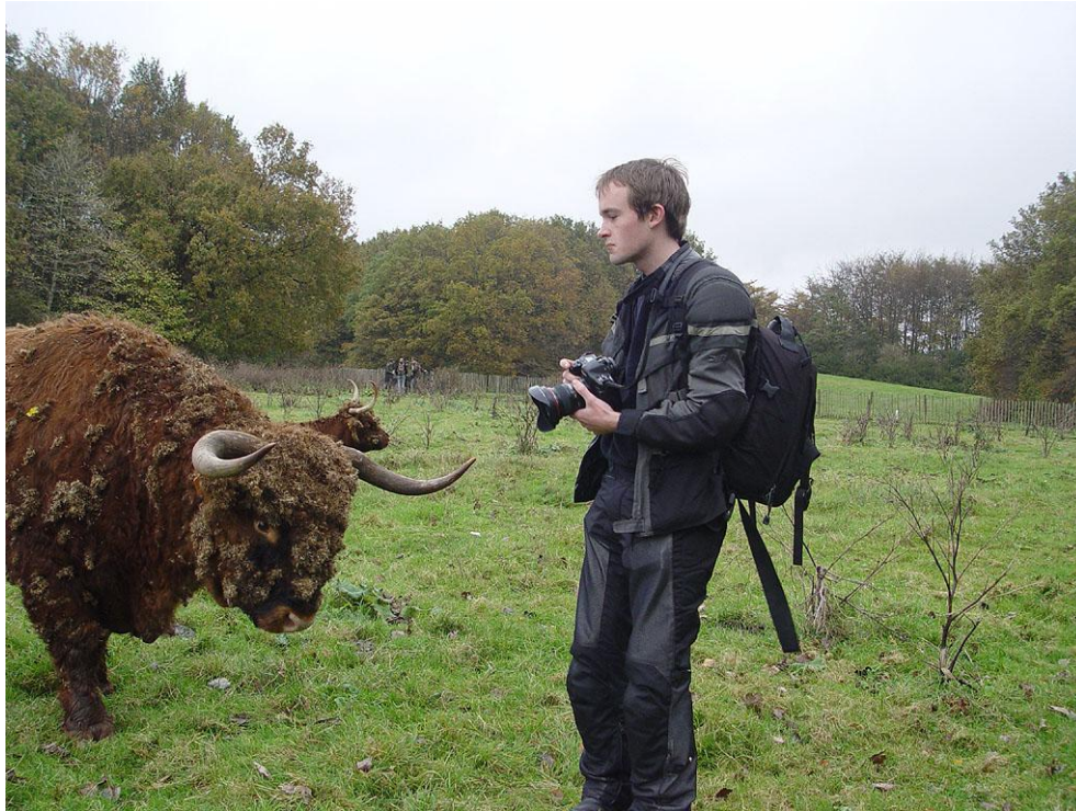
Foto 1: deze Schotse Hooglander geeft duidelijk aan dat wat hem betreft de grens bereikt is: “een stapje terug graag!”. Nadat de fotograaf aan zijn verzoek voldaan had, ging het dier rustig verder met herkauwen.