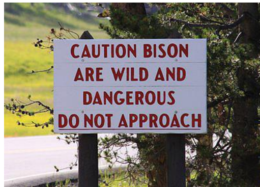
Foto 5: twee voorbeelden uit Yellowstone van waarschuwingen aan publiek voor risico's bij het benaderen van grote grazers, in dit geval de Amerikaanse Bison. Ook voor andere potentieel gevaarlijke soorten wordt gewaarschuwd.