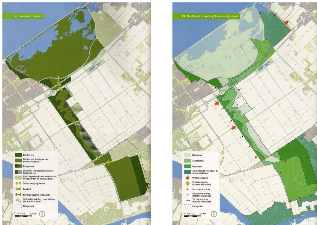
Figuur 1: zonering grote grazers (links) en recreanten (rechts) in de Groenblauwe Zone (bron: Structuurvisie OostvaardersWold, 2009).

Het ontwerp van de Groenblauwe Zone (Kotterbos, OostvaardersWold en HorsterWold) bevat een driedeling in doenatuur, zwerfnatuur en kijknatuur. In de eerste zijn veel voorzieningen voor recreanten en zal het relatief druk zijn, in de tweede zijn de voorzieningen zeer beperkt en in de laatste zelfs afwezig. Edelherten zijn in al deze zones aanwezig, koniks en heckrunderen vooral in de zone met zwerfnatuur en deels in de rustige zone met kijknatuur. Deze driedeling zorgt er voor dat grote grazers zelf het publiek kunnen mijden als dat nodig is. Daarnaast zorgt het ontwerp er voor dat bezoekers er zelf voor kiezen om de zwerfnatuurzone in te gaan en dus heckrunderen en grote groepen koniks tegen te kunnen komen.