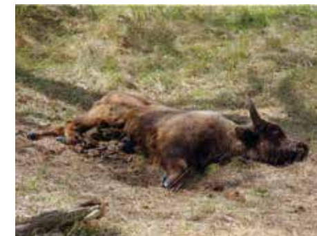
Dode wisent in de Kennemerduinen

Grote grazers zijn sociale dieren. Ze leven in kuddeverband met sterke familiebanden. Als mens nemen we afscheid en rouwen we om het verlies van een dierbare. Grote grazers doen dat ook, wanneer ze de kans krijgen. De kuddedieren bezoeken het dode dier gedurende enkele dagen tot weken. De omgeving wordt platgetrapt en er ontstaan wildpaadjes. Het laten liggen van een dood dier op de plek waar het geleefd heeft, is ook een uiting van