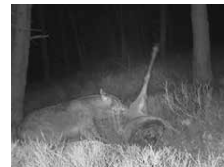
Wolf in actie op cameravalbeeld Veluwe

In de cyclus van leven en dood speelt de wolf een natuurlijke rol. Wolven doden om de paar dagen een groot hoefdier. Een roedel doodt al snel 200 dieren per jaar. Een wolf eet vooral het spierweefsel, organen en botten. De maag en darm van zijn prooi laat hij liggen (deze bevatten plantenresten die wolven maar moeilijk kunnen verteren). Dat komt aaseters bijzonder goed uit. In plaats van een gesloten kadaver, ligt er een rijk gedekte tafel met ingewanden, doorgeknaagde ribben en resten huid en