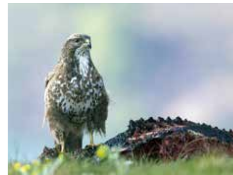
Buizerd op een kadaver

profiteren indirect door van de larven te eten. Vogels eten de vliegenmaden en gebruiken haren als nestmateriaal. Vlinders komen van de mineralen snoepen en wespjes doen zich te goed aan deze enorme bron van eiwitten. Niet alleen aaseters profiteren van kadavers in de natuur: de kadavers zitten namelijk boordevol met nutriënten en mineralen, die de dieren tijdens hun leven hebben opgenomen en na hun dood weer teruggeven. Aaseters zijn een belangrijke schakel in deze kringloop van voedingsstoffen.