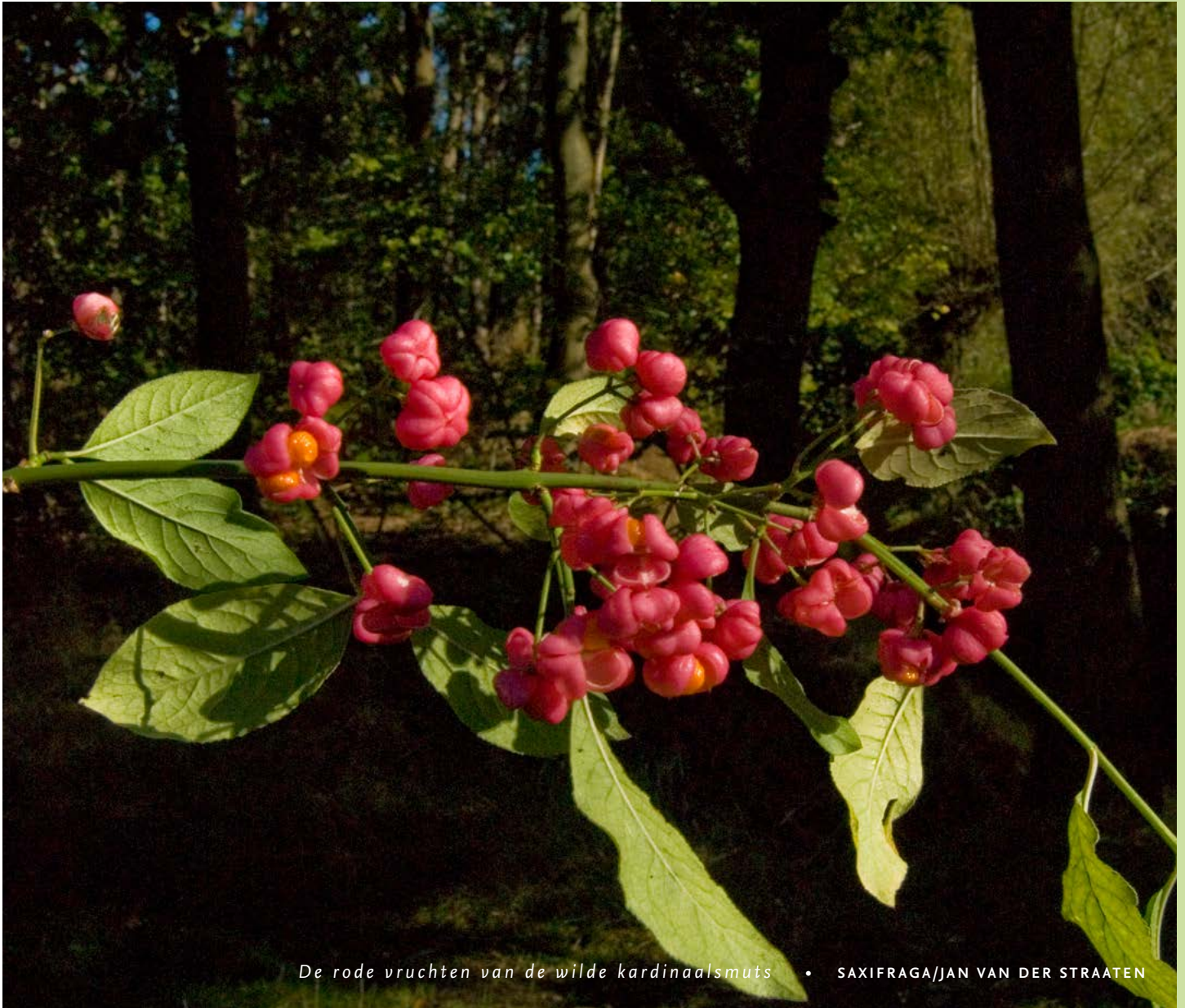
De rode vruchten van de wilde kardinaalsmuts