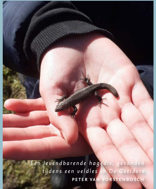
Een levendbarende hagedis, gevonden tijdens een veldles in De Geelders • PETER VAN VORSTENBOSCH