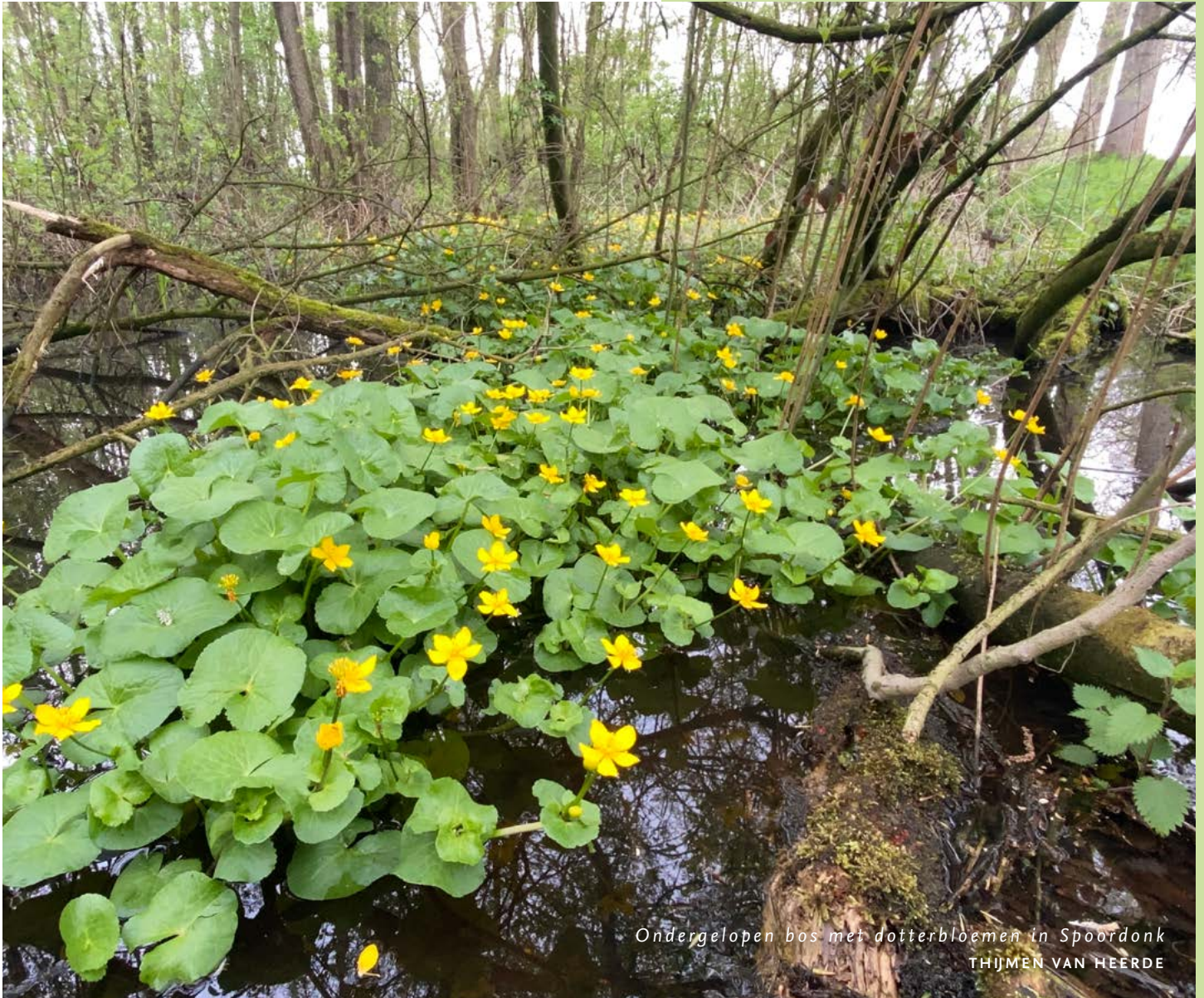
Ondergelopen bos met dotterbloemen in Spoordonk THIJMEN VAN HEERDE