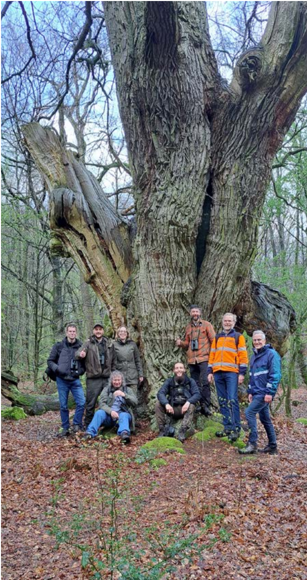
Het ARK-team onder de 1.200 jaar oude Friedrichs-eik in het leembos van Hasbruch

Op dinsdag 11 april 2022 bezochten we als 'ARK-team Het Groene Woud' drie prachtige leembossen in Noord-Duitsland. Onder leiding van een gids wandelden we door het Borkener Paradies, het natuurgebied Am Baumweg en het oerbos van Hasbruch. Allemaal oude bossen vól prachtige biodiversiteit.