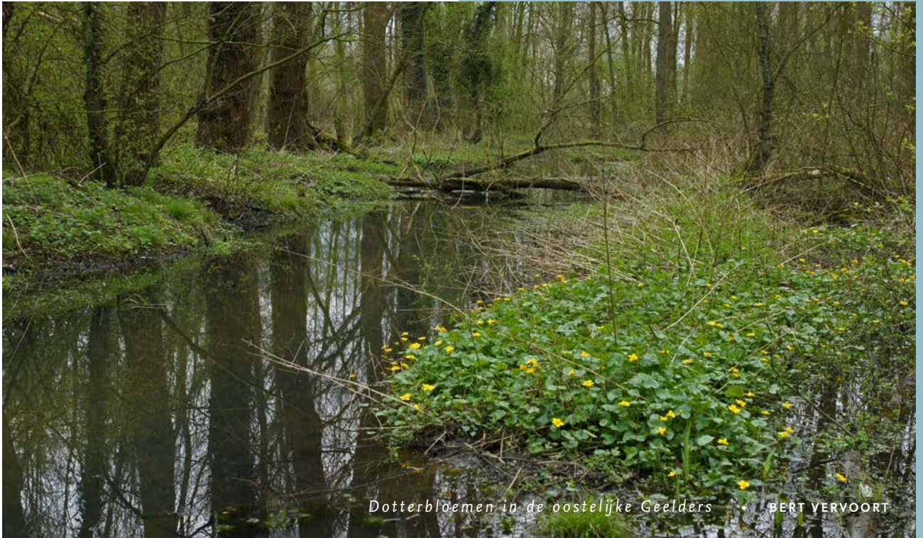
Dotterbloemen in de oostelijke Geelders • BERT VERVOORT