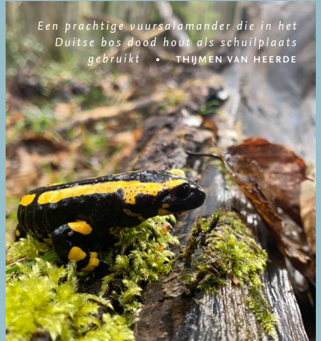
Een prachtige vuersalamander die in het Duitse bos dood hout als schuilplaats gebruikt

Borkener Paradies is een oud bos dat al heel lang begraaasd wordt. De dieren lopen hier tussen het voorjaar en het najaar vrij rond. Met hun aanwezigheid zorgen ze voor kleinschalige open plekjes en houden ze de aanwezige open weides kort. Op de tweede locatie, Am Baumweg, stonden we stil bij prachtige haagbeuken die vroeger werden geknot en daardoor heel bijzondere vormen aannamen. Tot een aantal jaren geleden werd ook dit gebied begraaasd. Hierdoor is het haagbeuken-eikenbos langzaam veranderd in een beukenbos.