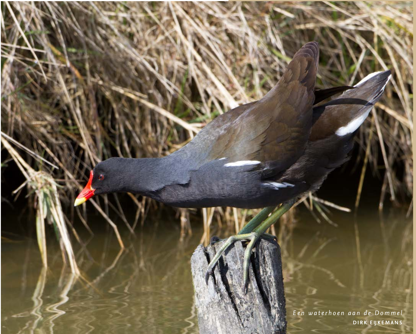
Een waterhoen aan de Dommel

Langs de Dommel – maar ook in kleine sloten en vijvers – zijn waterhoenen goed vertegenwoordigd met dank aan het zoete water. Ze hebben een lichte voorkeur voor water dat ook nog eens voedselrijk is. Ze leven van waterplanten, grassen, insecten, spinnen, kikkervisjes maar eten soms ook eieren van andere vogels. Hun eigen nestjes (komvormig en gemaakt van waterplanten) bevinden zich altijd goed beschermd in de oevervegetatie. In de wintermaanden zoeken waterhoentjes elkaar op in de buurt van grote vijvers en sloten, mits ze er genoeg voedsel en dekking kunnen vinden.