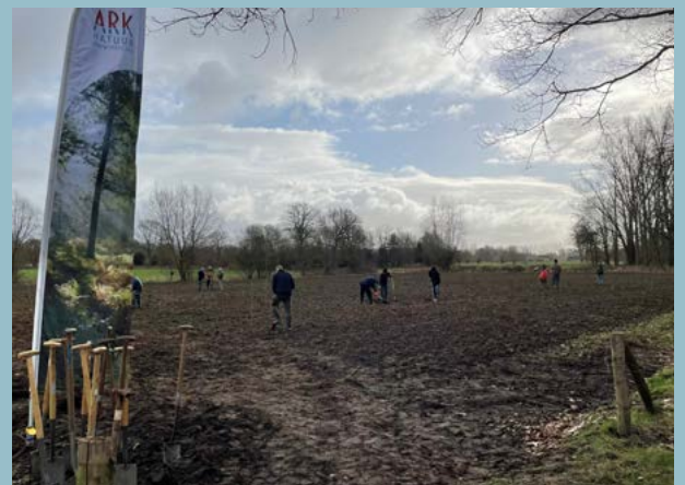
Vele vrijwilligers plantten op 3 maart bomen en struiken aan bij de Beeksche Waterloop

De percelen aan de Beeksche Waterloop maken deel uit van het Natuurnetwerk Brabant NNB, hét netwerk waarvoor ARK in Het Groene Woud al sinds 2019 percelen verwerft en inricht of anderen daarbij faciliteert. Natuurgroep Gestel hielpen we hier met een aantal bouwstenen voor de inrichting. De Beeksche Waterloop heeft onze volle aandacht omdat ze een ecologische verbingszone vormt tussen De Geelders en het Wijboschbroek, een belangrijke stapsteen die een aaneengesloten NNB nog een stapje dichterbij brengt. Omdat deze verbinding zowel droog als nat is, verwachten we dat ze een ideaal leefgebied gaat vormen voor libellen, vissoorten, waterspitsmuizen, grote modderkruipers, levendbarende hagedissen en kleine marterachtigen. ARK wil alle vrijwilligers hartelijk danken voor hun inzet bij het toewerken naar een biodivers leembos bij de Beeksche Waterloop.