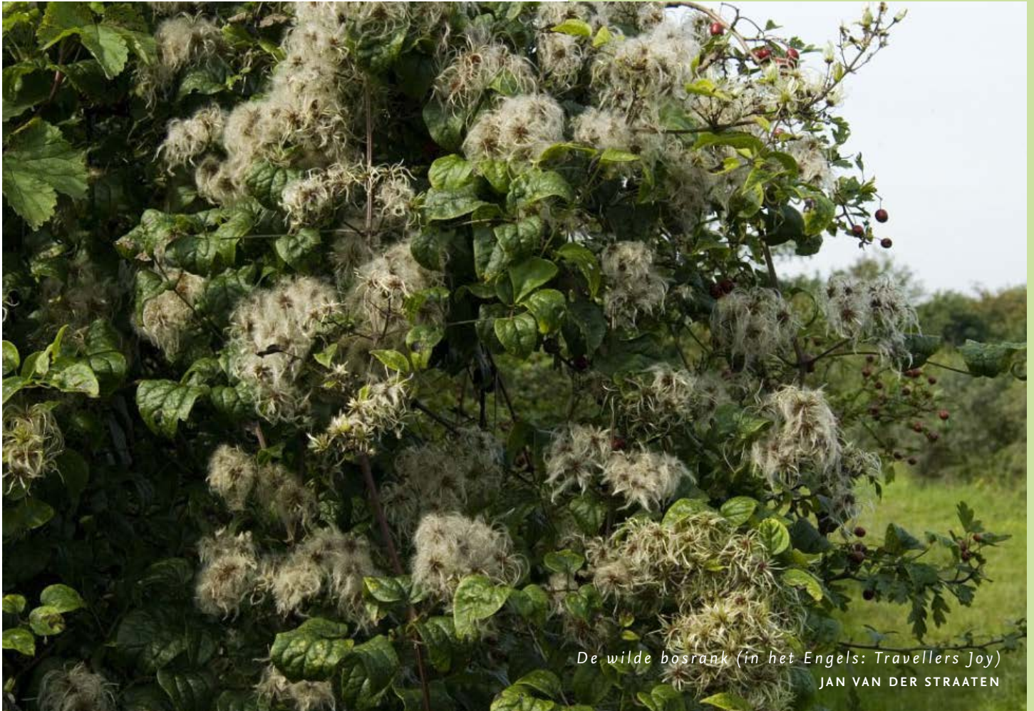
De wilde bosrank (in het Engels: Travellers Joy) JAN VAN DER STRAATEN