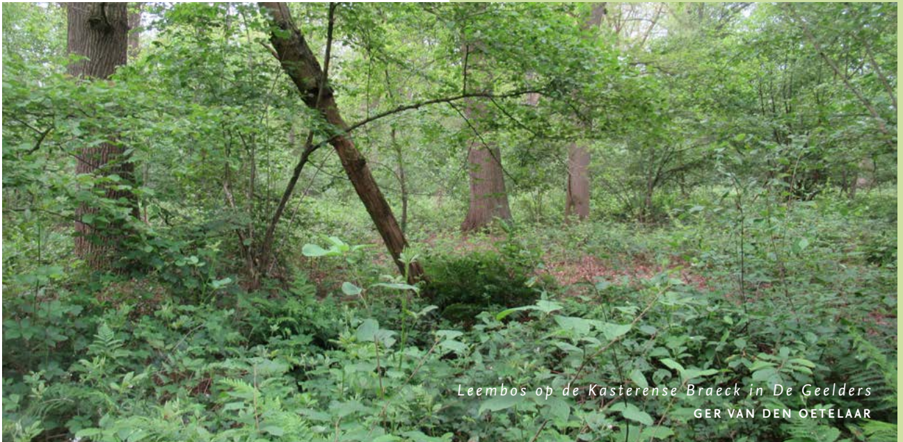
Leembos op de Kasterense Braeck in De Geelders