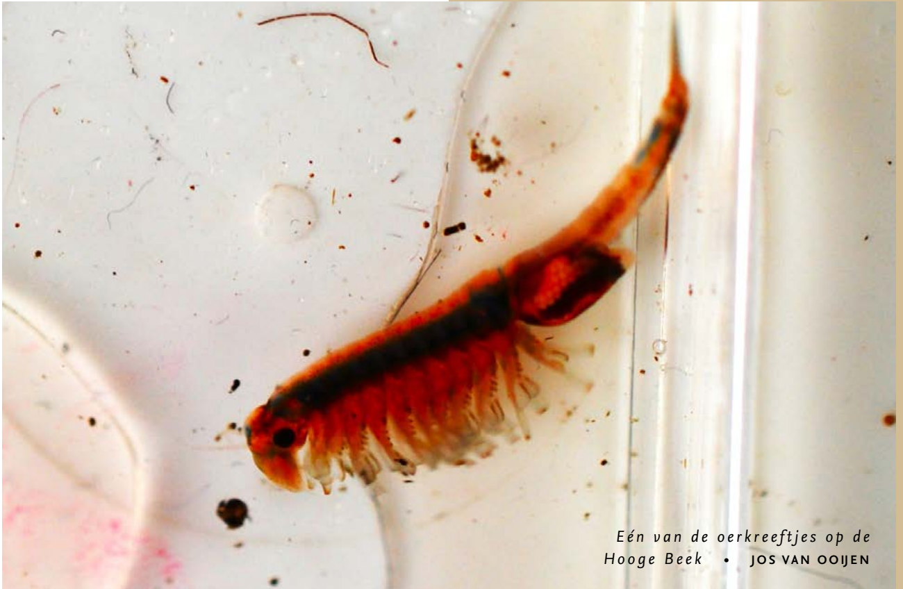
Eén van de oerkreeftjes op de Hooge Beek