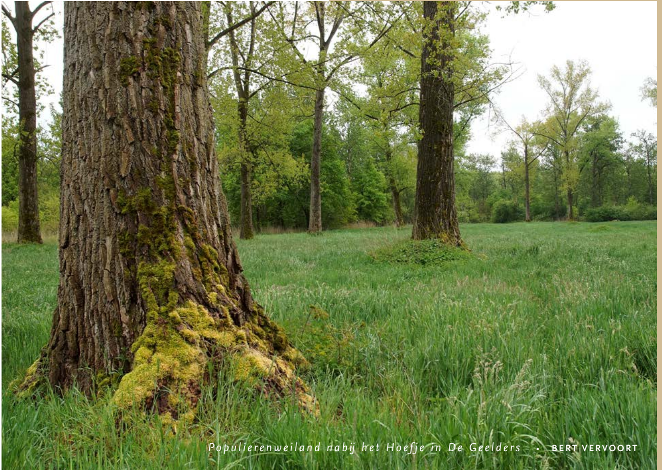
Populierenweiland nabij het Hoefje in De Geelders