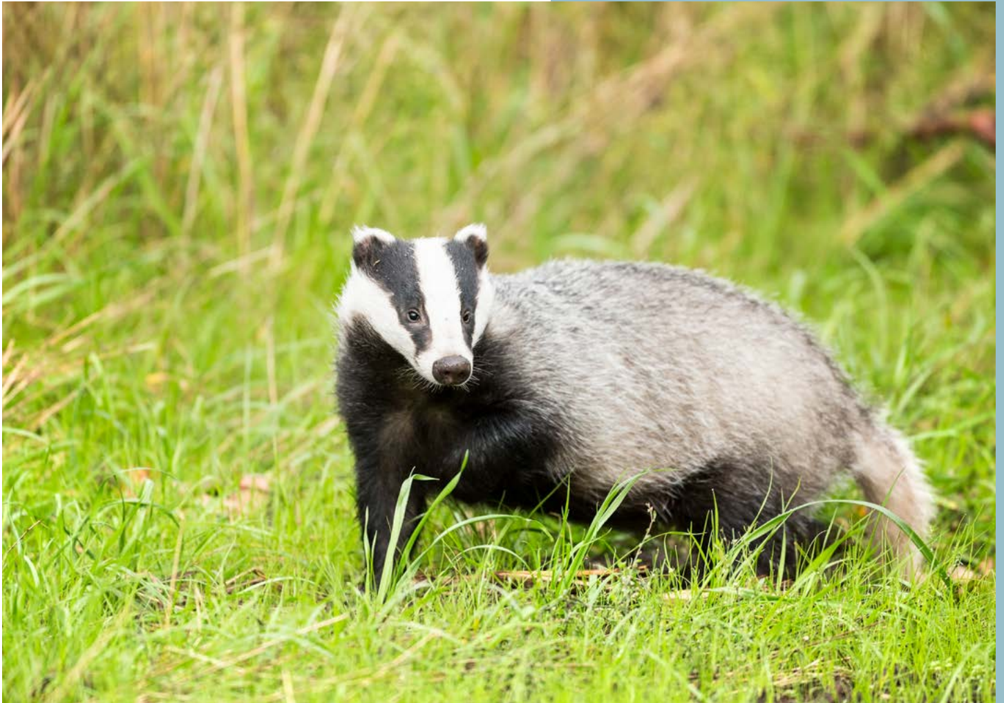
De das • BOB LUIJKS

uitwerpselen en bewoningssporen. Zie je een grote hoeveelheid zand in combinatie met 'gemorst' nestmateriaal (blaadjes, takjes)? Dan zou dat een dassenburcht kunnen zijn. Op deze 'stortbergen' loopt ook vaak een geul en zijn dassenharen en loopsporen te vinden. Verder vind je vaak mestputjes in de buurt van de burcht. Héél soms laten dassen zich zien. Zo werd vlinderspecialist Joep Steur op 5 maart 2022 nog verrast door twee dassen die op De Prekers in het Wijboschbroek naar hem toe renden.