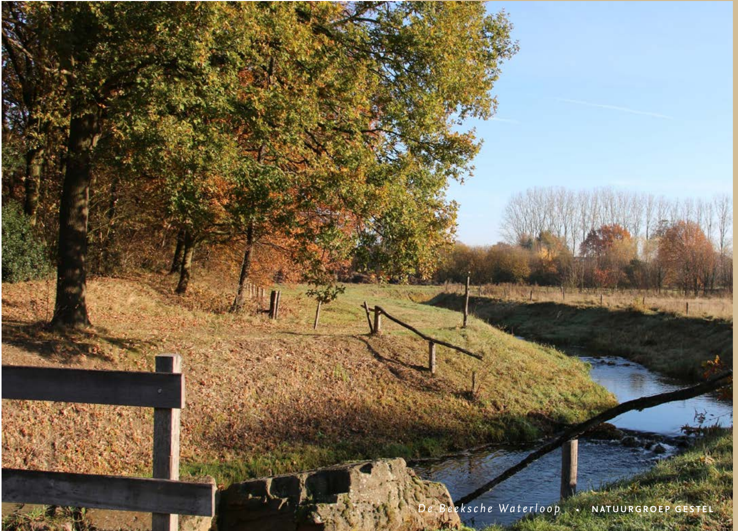
De Beeksche Waterloop - NATUURGROEP GESTEL