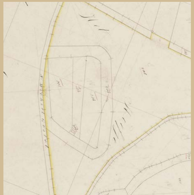
Op deze Kadasterkaart uit 1832 is de bijzondere vorm van het Hoefje te zien, mét omringende voorpootstrook.