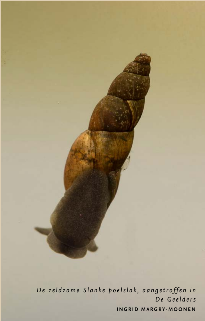
De zeldzame Slanke poelslak, aangetroffen in De Geelders