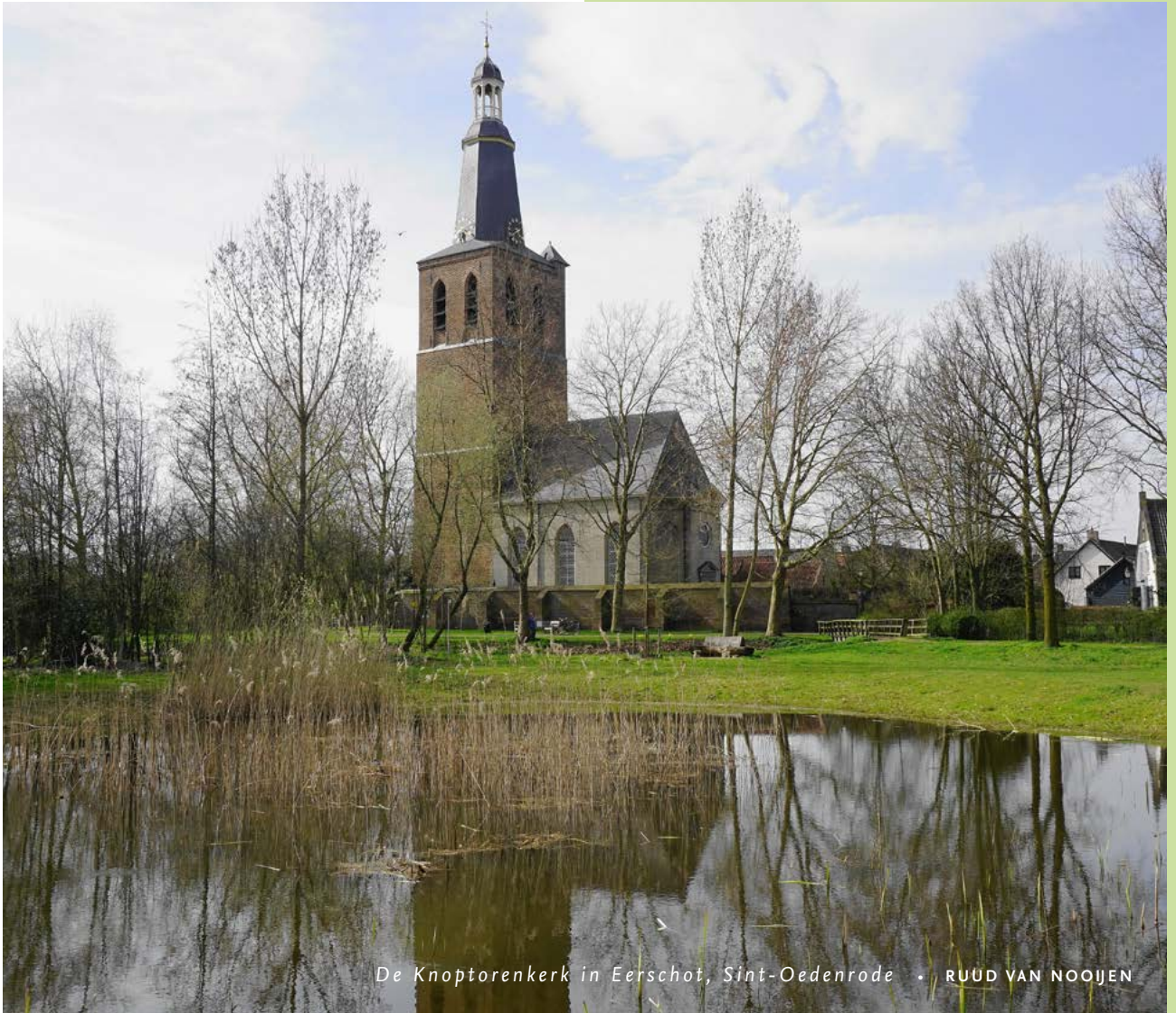
De Knoptorenkerk in Eerschot, Sint-Oedenrode