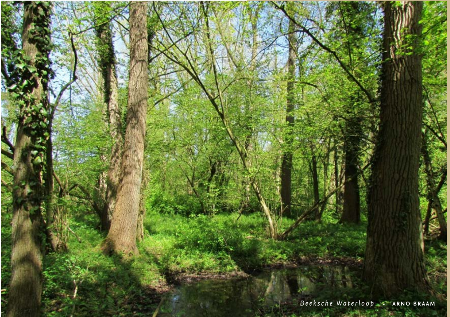
Beeksche Waterloop • ARNO BRAAM