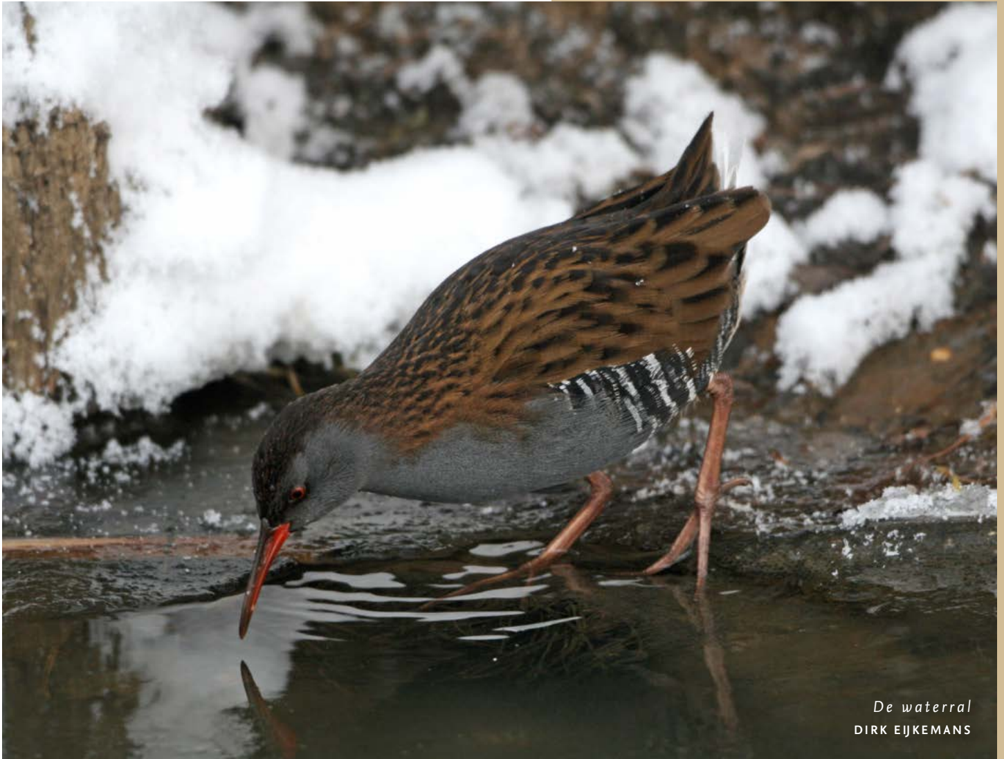
De waterrall DIRK EJKEMANS