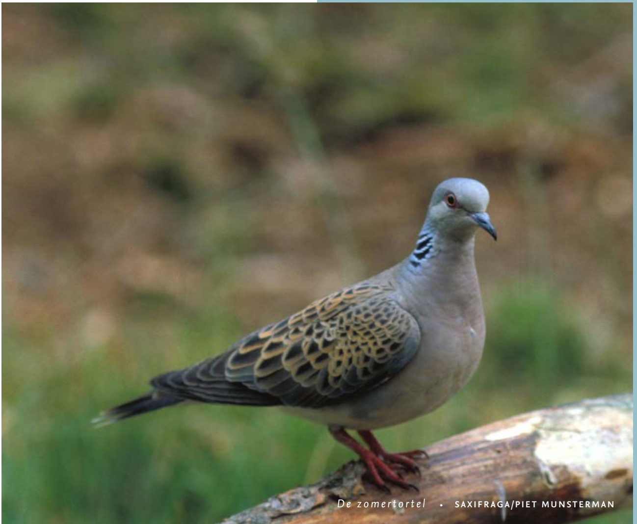
De zomertortel

brenghen – als enige duivensoort uit Nederland – de winter door in zuidelijke streken. In het najaar trekken ze via West-Frankrijk en het westelijk Iberisch schiereiland naar tropisch West-Afrika. Eind april, begin mei keren ze weer terug. Helaas worden ze in Frankrijk en Spanje al jarenlang massaal afgeschoten. Toch blijkt uit onderzoek dat de belangrijkste oorzaak van hun afname hier in Nederland te vinden is: zomertortels brengen al decennialang nauwelijks nog jongen groot. Ze zoeken namelijk langs zandige akkerranden naar de zaden van relatief kleine akkeronkruiden, maar door de introductie van grote machines en landbouwgiften zijn die bijna helemaal verdwenen uit het landschap. Sinds de jaren zeventig van de vorige eeuw is hun aantal met maar liefst 85 procent afgenomen. Daarmee is de zomertortel een zeldzame, bedreigde duivensoort geworden. Af en toe zie je ze nog, al zijn ze erg schuw en onopvallend. Het meest kenmerkend is hun getrapte, ruitvormige staart met een witte eindband.