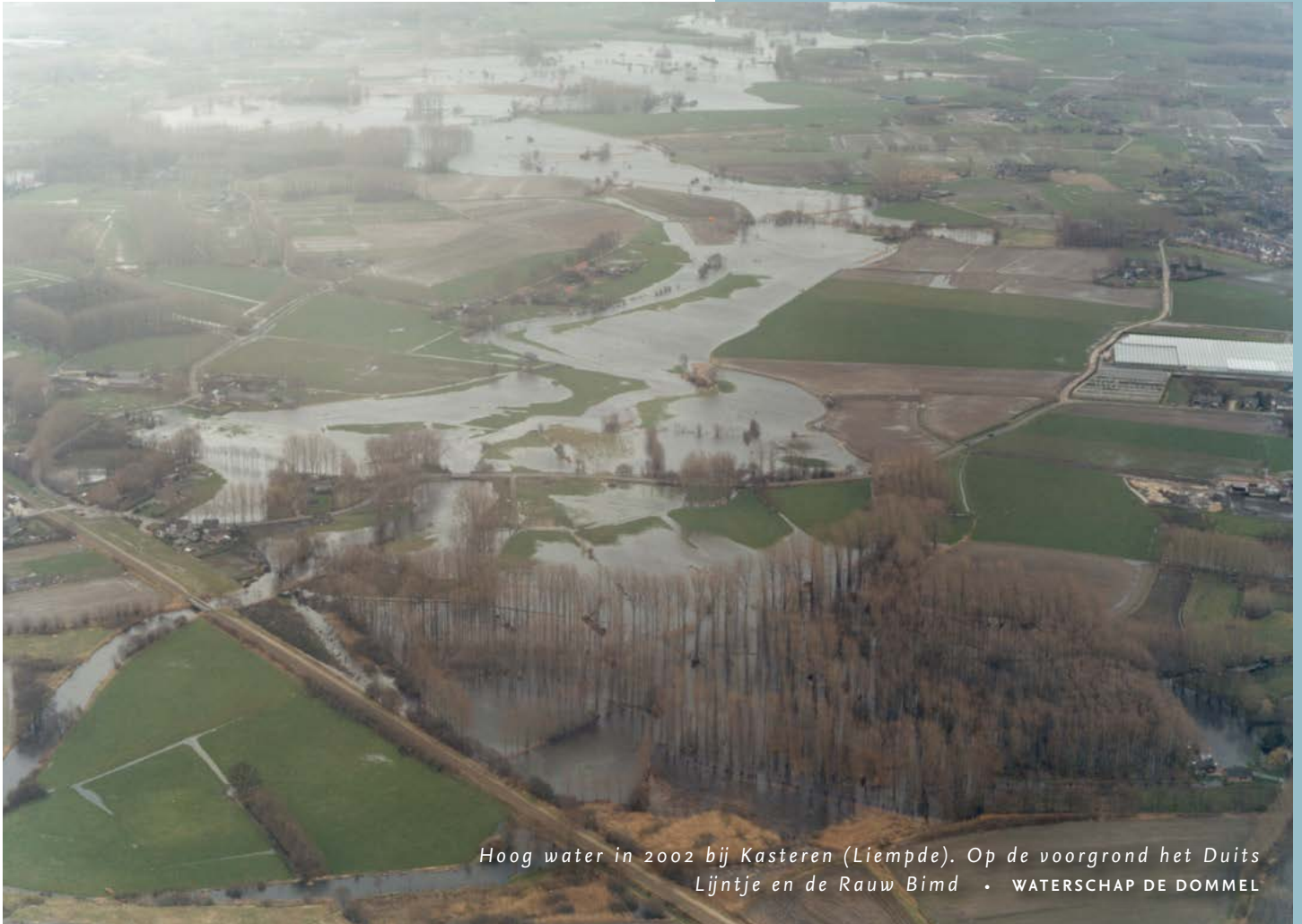
Hoog water in 2002 bij Kasteren (Liempde). Op de voorgrond het Duits Lijntje en de Rauw Bimd