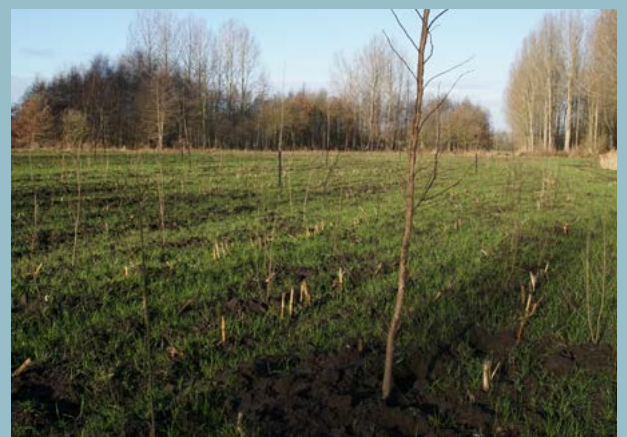
Op Espendonk is ARK dit voorjaar gestart met de aanplant van vijf hectare leembos

ligt, kende vroeger rijke leembossen. Maar door onder meer versnippering en verdroging is de kwaliteit van het totale gebied stevig achteruit gegaan. Om het tij te keren, werken ARK en Brabants Landschap aan de terugkeer van de oude waarden. Concreet betekent dit dat we op grotere eenheden nieuw bos aanplanten, zoals op Espendonk, waar we vijf hectare leembos toevoegen aan de bestaande begroeiing.