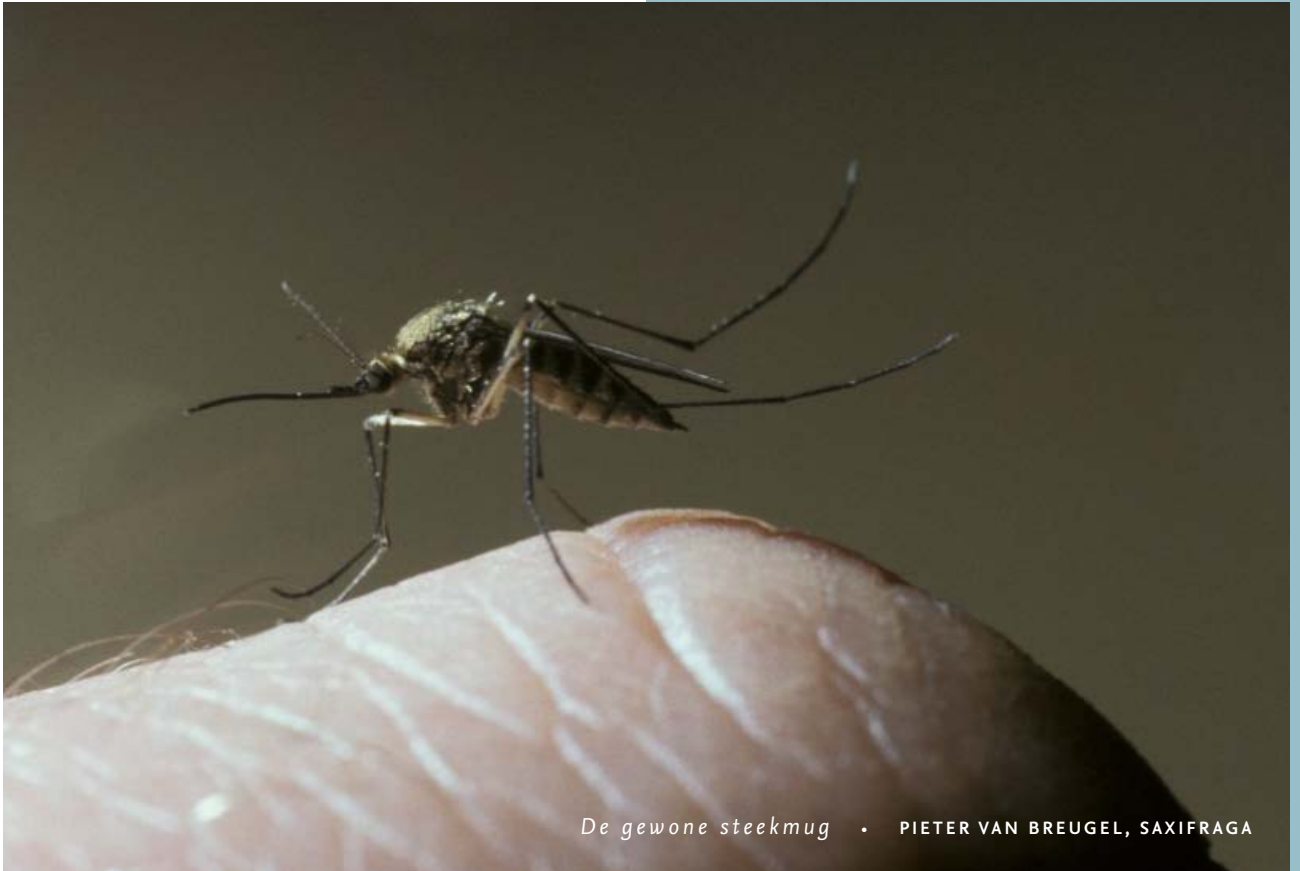
De gewone steekmug