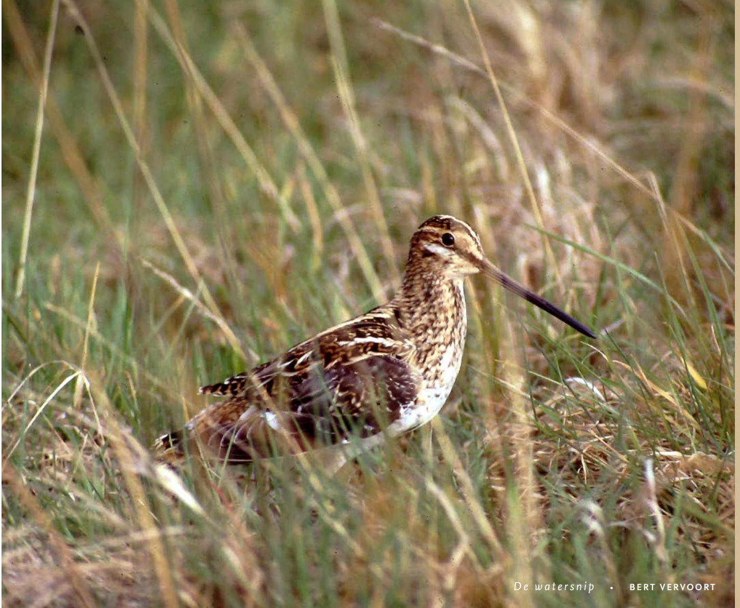
De watersnip • BERT VERVOORT