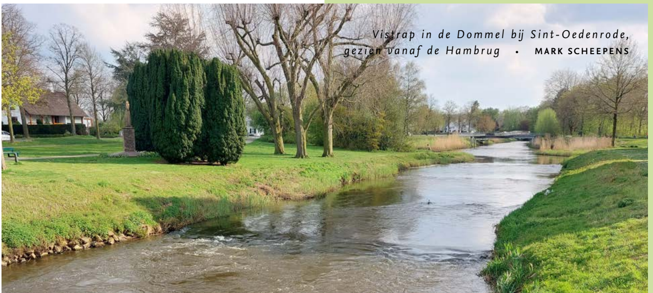
Vistrap in de Dommel bij Sint-Oedenrode, gezien vanaf de Hambrug