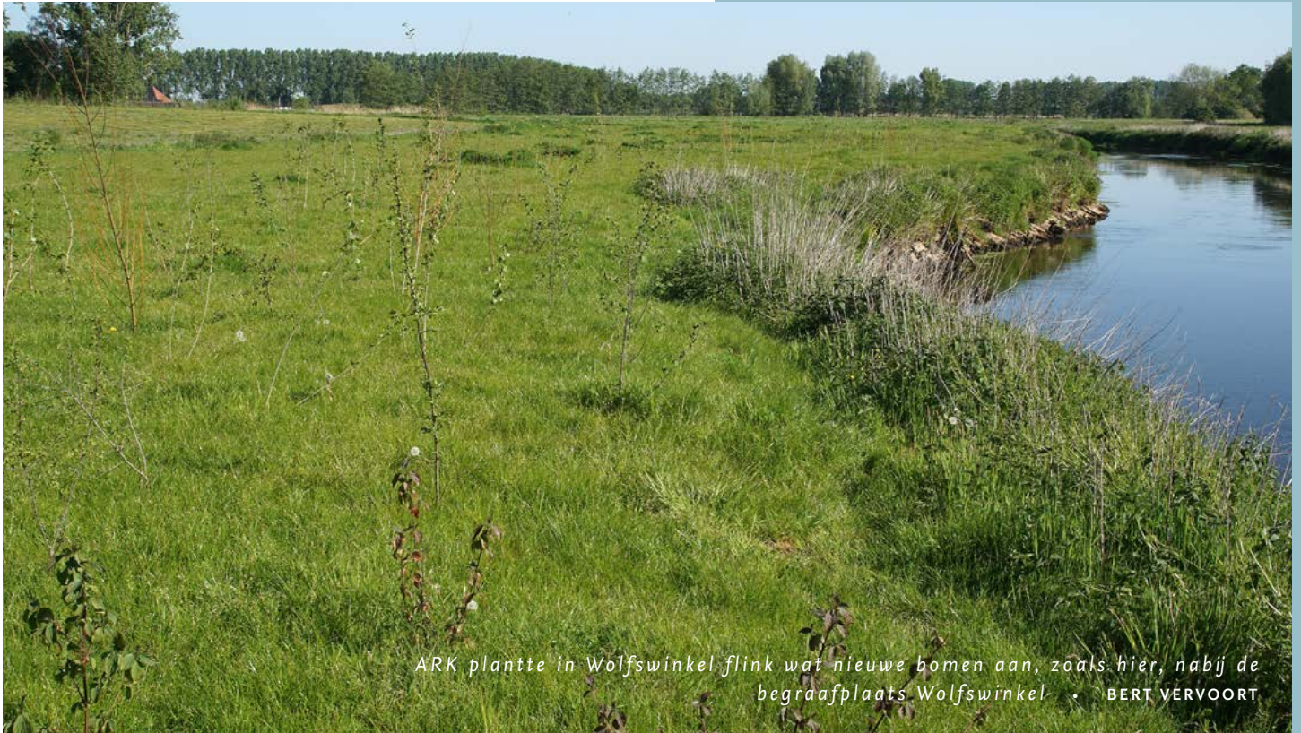
ARK plantte in Wolfswinkel flink wat nieuwe bomen aan, zoals hier, nabij de begraafplaats Wolfswinkel