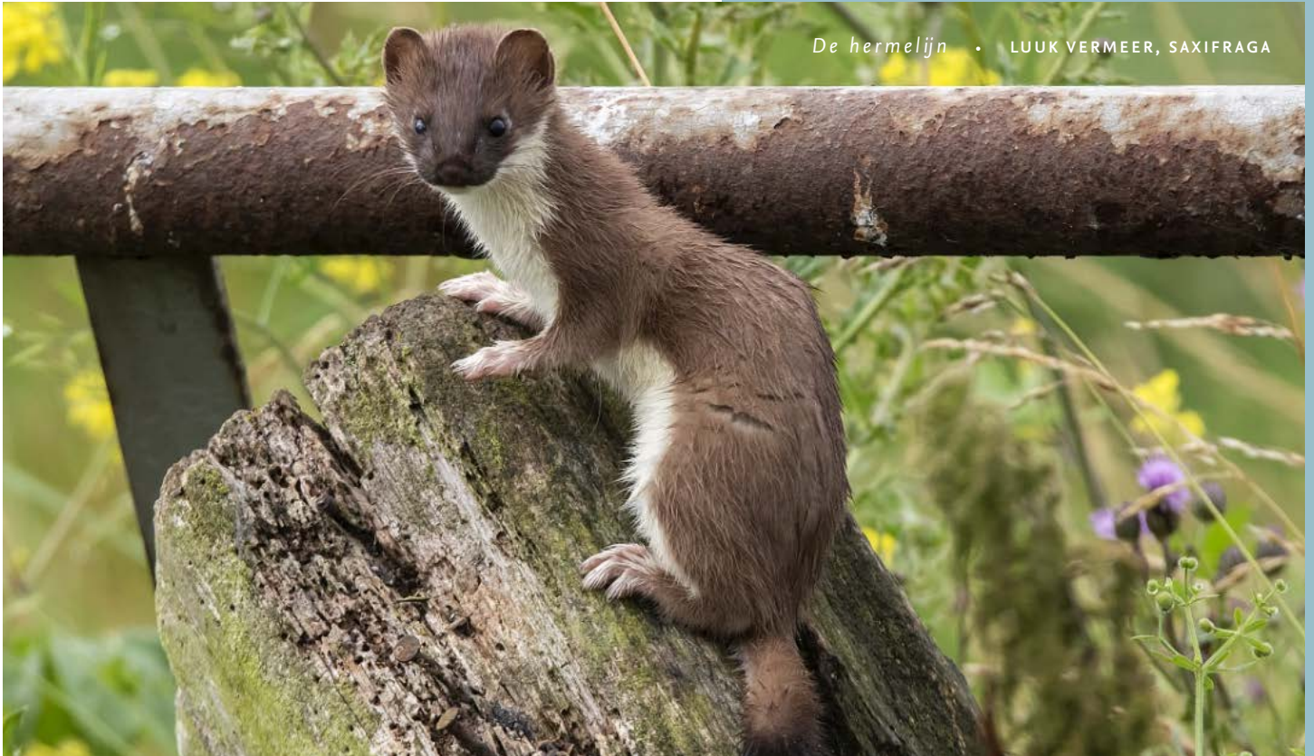
De hermelijn