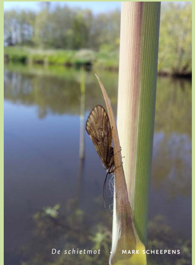
De schietmot · MARK SCHEEPENS

Deze recente vondst is heel bijzonder. Deze soort vond je in Nederland tot nu toe alleen nog langs de Roer in