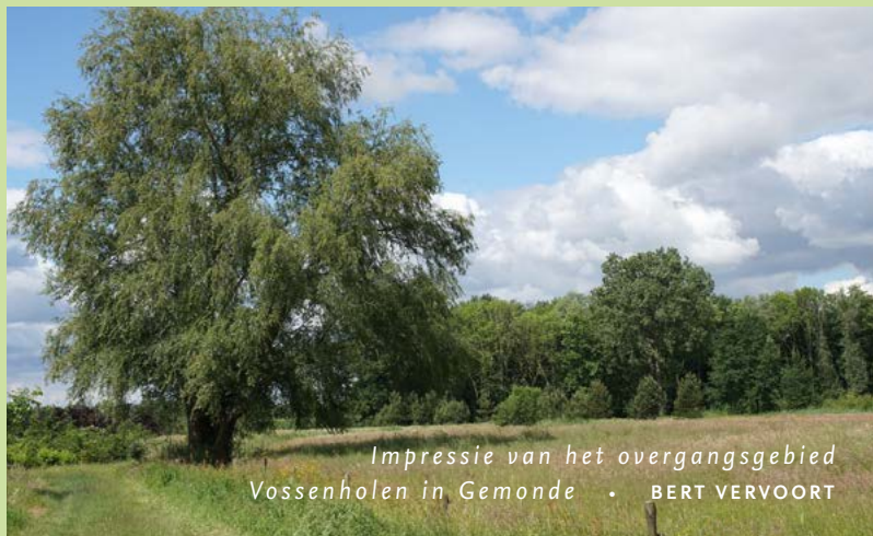
Impressie van het overgangsgebied Vossenholen in Gemonde • BERT VERVOORT

Om het Natuurnetwerk Brabant te realiseren, verwerft ARK Natuurontwikkeling gronden in Het Groene Woud. Dat doen we in het kader van het project Brabants Goud in Het Groene Woud. Per 1 juni 2022 beschikten we over ruim 317 hectare grond. De ARK-methode: we verwerven gronden, zorgen voor de natuurinrichting en het tijdelijk beheer ervan. Na enkele jaren dragen we de ontstane natuur over aan andere beheerders. Ons meest recente Brabants Goud-perceel dat we toevoegden ligt aan de Dommel in Boxtel.