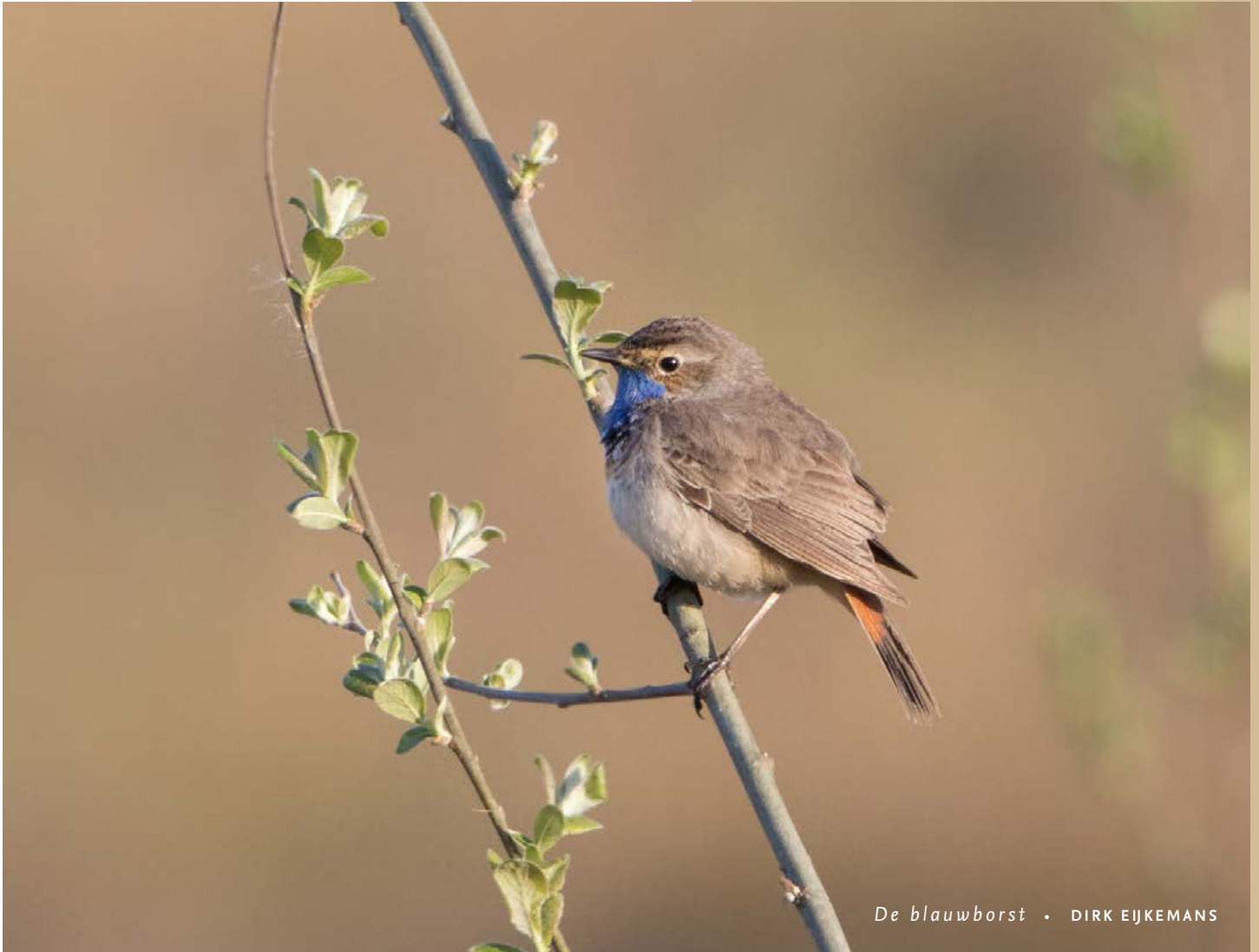
De blauwborst • DIRK EJKEMANS