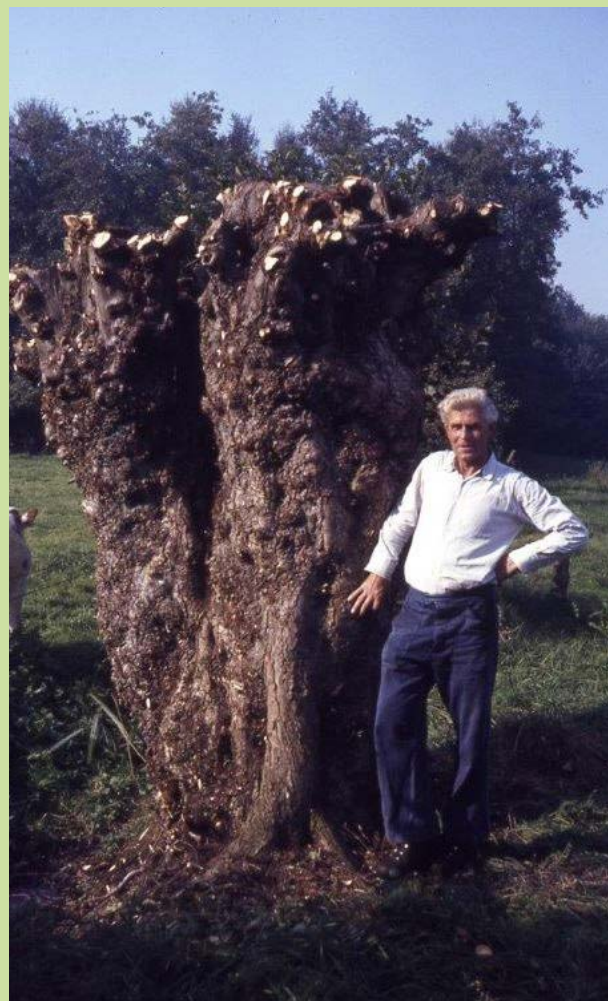
Kolossale fladderiep in De Mortelen