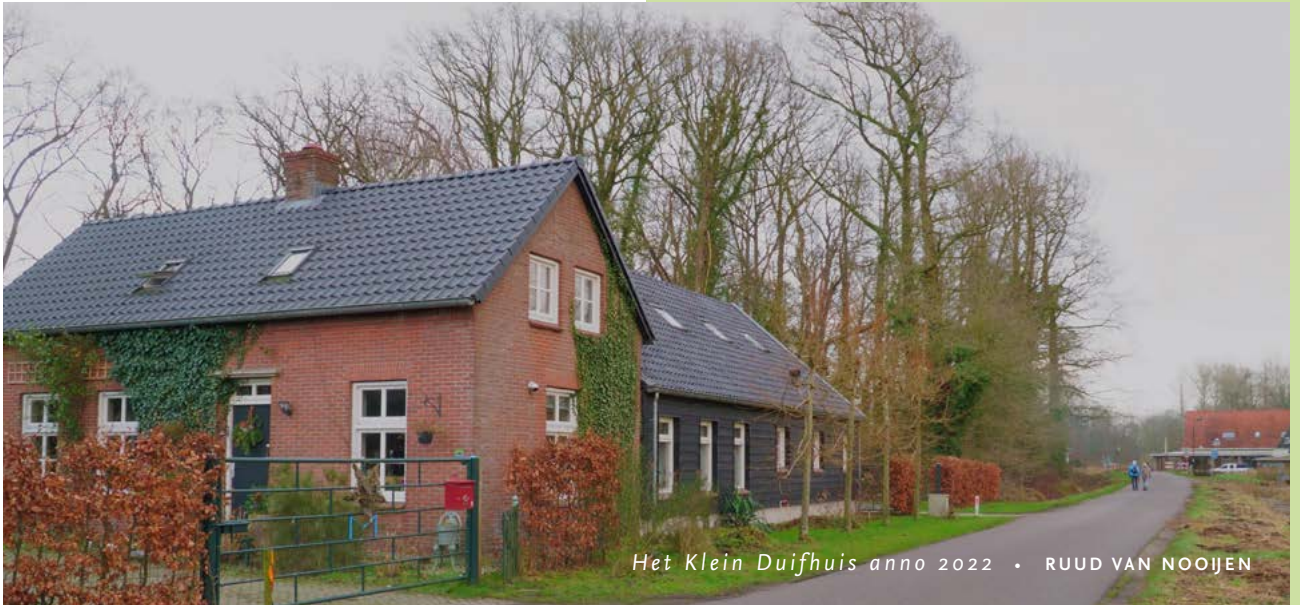
Het Klein Duijfhuis anno 2022