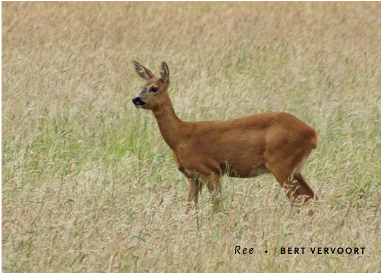
Ree • BERT VERVOORT