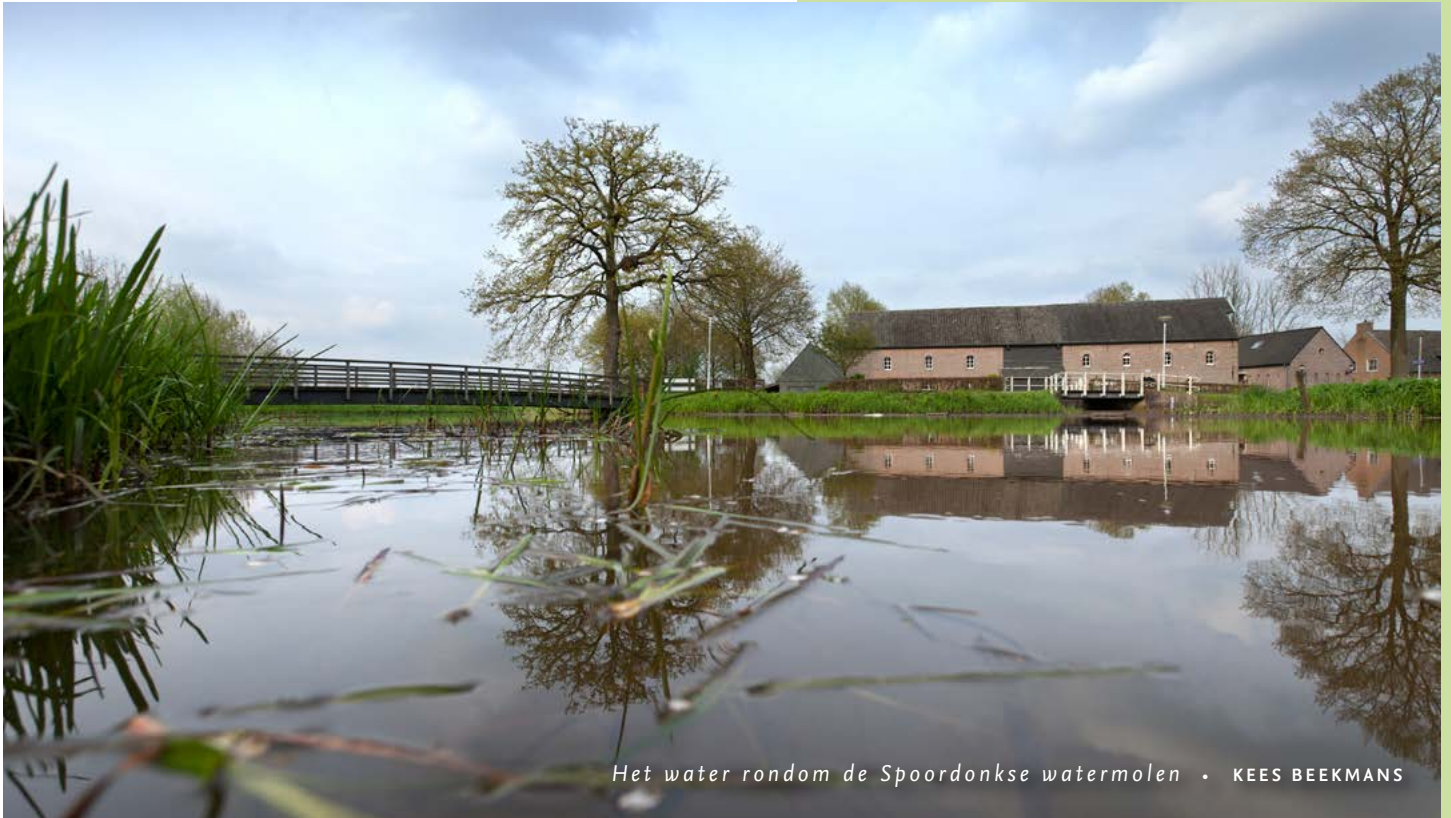
Het water rondom de Spoordonkse watermolen • KEES BEEKMANS