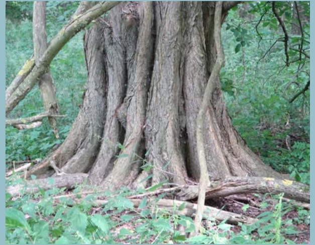
De fladderiep met zijn kenmerkende stam en plankwortels