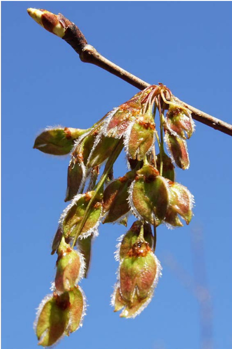
De bloemvruchtjes hangen als klokjes aan de steeltjes • BERT VERVOORT

Hij wordt beschouwd als 'de mooiste boom van Het Groene Woud': de fladderiep of steeliep (Ulmus laevis). Deze boom komt uit de iepenfamilie (Ulmaceae) en groeit van nature in Europa, tot Bulgarije, de Krim en de Kaukasus aan toe. Door overbegrazing in de voorbije eeuwen is deze 'smakelijke' boom op veel plaatsen verdwenen.