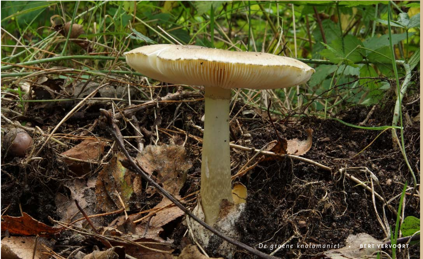
De groene knolamaniet • BERT VERVOORT