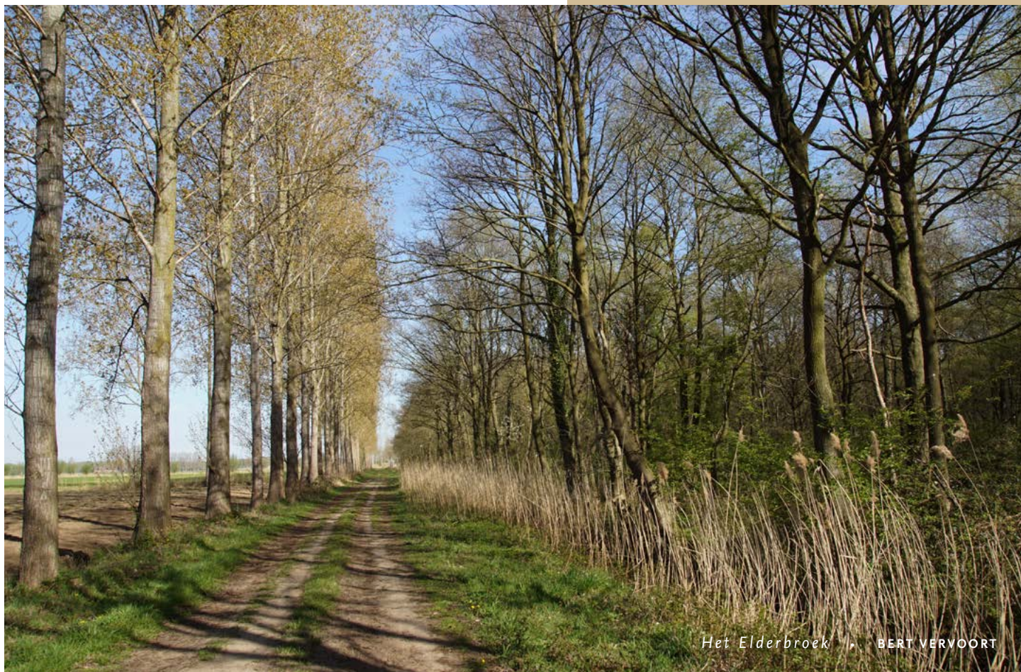
Het Elderbroek | BERT VERVOORT