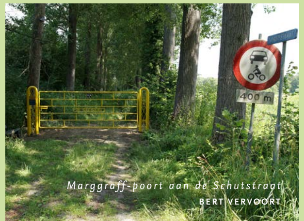
Marggraff-poort aan de Schutstraat BERT VERVOORT

Ter bescherming van de zandpaden in en rond De Geelders heeft de Marggraff Stichting robuuste, gele Marggraff-poorten aan ARK geschonken. De poorten zijn door maker Sjef Vingerhoeds uit Oirschot op verschillende locaties in De Geelders geplaatst. Ze moeten, samen met verbodsborden, voorkomen dat zandpaden worden vernield door 4-wiel aangedreven auto's die hier