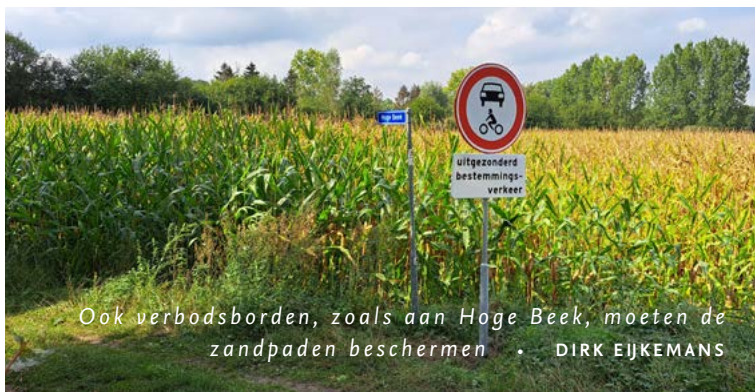
Ook verbodsborden, zoals aan Hoge Beek, moeten de zandpaden beschermen

regelmatig crossen. De poorten zijn de uitkomst van een overleg in het voorjaar van 2022. Daar spraken we samen met de handhavers van ODBN, de gemeente Meierijstad, fietsclubs, bewoners, Staatsbosbeheer en Brabants Landschap over de overlast en vernielingen van de paden. De Marggraff-poorten en de verbodsborden die nu in en rond De Geelders staan, kwamen er met medewerking van de gemeenten Meierijstad en Boxtel. Ook op andere plaatsen in deze gemeenten worden acties voorbereid ter bescherming van paden en natuur.