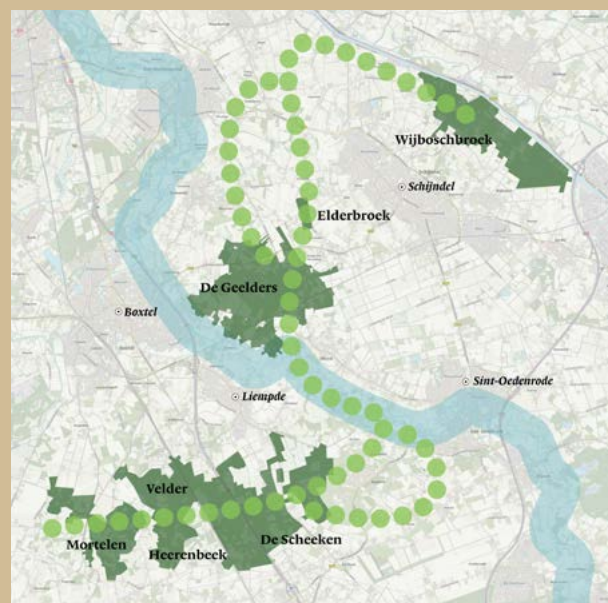
Enkele natuurgebieden in Het Groene Woud en de tussenliggende verbindingen