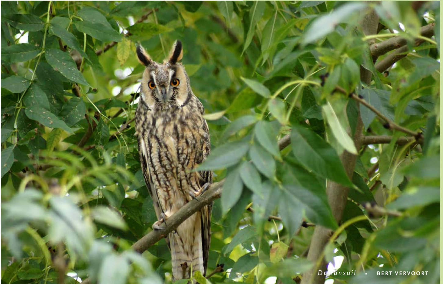
De ransuil • BERT VERVOORT