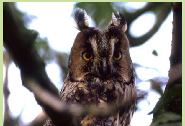
Een ransuil in De Geelders

nestomgeving, maar niet per se aan hetzelfde nest. Jagen doen ze bij voorkeur in het open veld, langs wegbermen en op kalere plekken in het bos. Op het menu: woelmuisen, met de veldmuis als belangrijkste prooi. Ook aard- en bosmuizen en kleine vogels als mussen, merels, spreuwen en vinkachtigen laat de ransuil zich goed smaken.