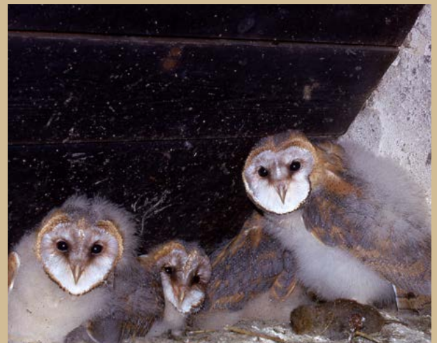
Jonge kerkuilen bovenin het bakhuis van de familie Van Esch aan de Hogenbergseweg in Liempde (1974)

In 1973 werd de Nederlandse populatie op tweehonderd geschat. En hun aantal daalde destijds snel. Zo kwam slechts de helft van de kerkuilen in dat jaar tot broeden en dat was aanzienlijk lager dan een jaar eerder. Ook in Het Groene Woud had de kerkuil het moeilijk. Gelukkig was er het redelijk gifarme Dommeldal waarvan de laatste broedparen uit de regio gebruik maakten. Dat heeft hier de kerkuilenpopulatie gered. Ook de inspanningen van Roofvogelwerkgroep Meierij (opgericht in 1973) droegen daaraan bij: de leden zorgden ervoor dat de kerkuilen allemaal een goede nestkast kregen. Op dit moment gaat