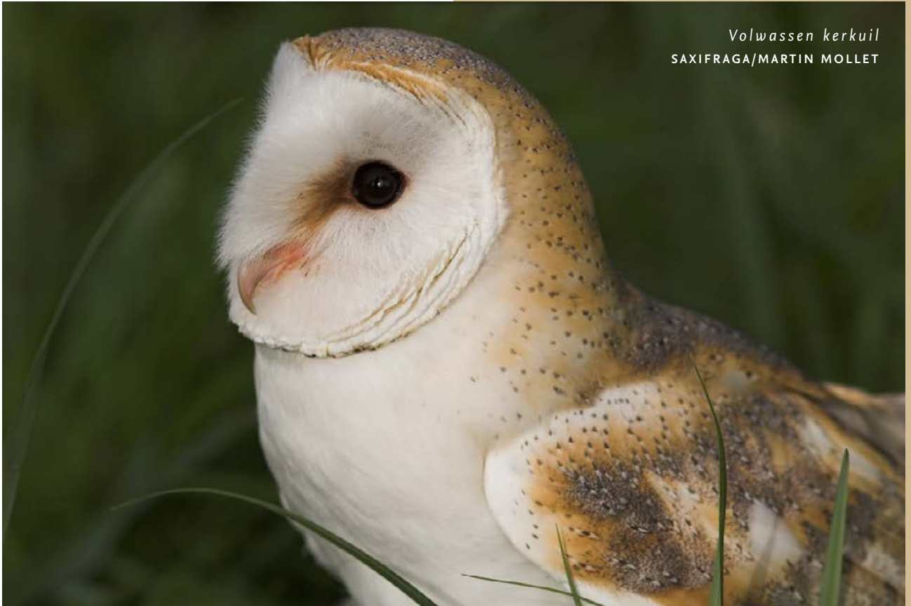
Volwassen kerkuil