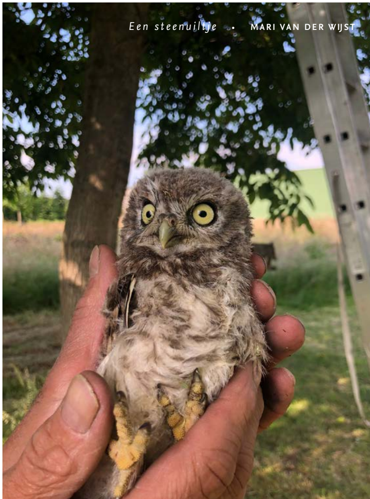
Een steenuiltje • MARI VAN DER WIJST