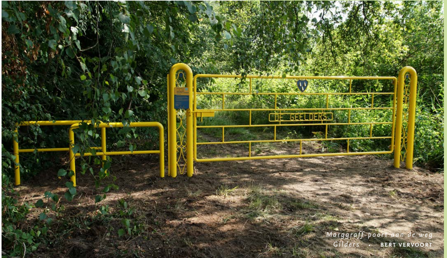
Marggraff-poort aan de weg Gilders • BERT VERVOORT