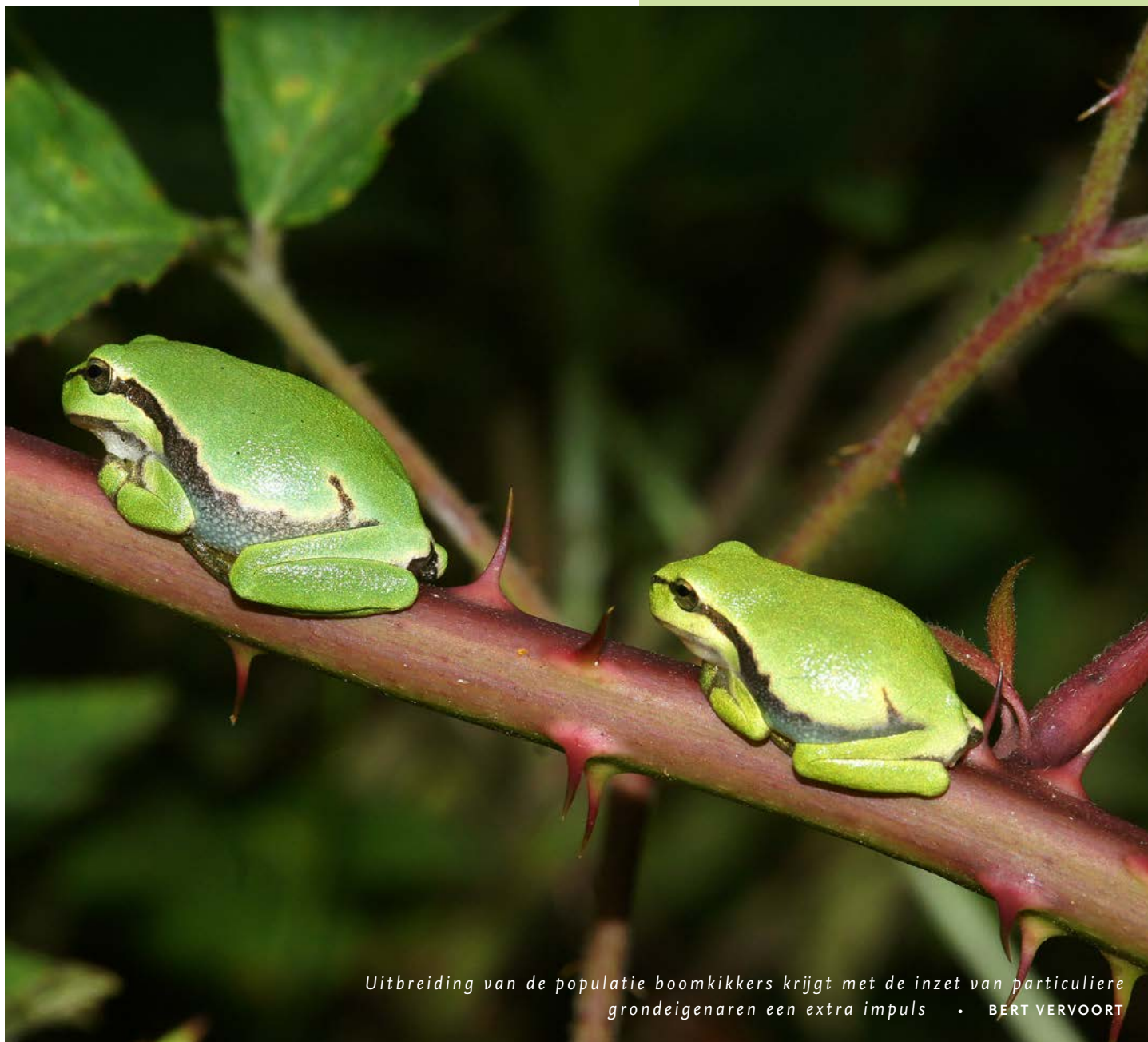
Uitbreiding van de populatie boomkikkers krijgt met de inzet van particuliere grondeigenaren een extra impuls • BERT VERVOORT