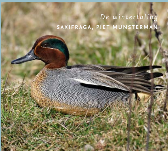
De wintertaling

Om het Natuurnetwerk Brabant te realiseren, verwerft ARK Natuurontwikkeling gronden in Het Groene Woud. Dat doen we in het kader van het project Brabants Goud in Het Groene Woud. Per 1 september 2022 beschikten we over ruim 335 hectare grond. De ARK-methode: we verwerven gronden, zorgen voor de natuurinrichting en het tijdelijk beheer ervan. Na enkele jaren dragen we de ontstane natuur over aan andere beheerders. Ons meest recente Brabants Goud-perceel dat we toevoegden, ligt aan de Dommel in Boxtel.