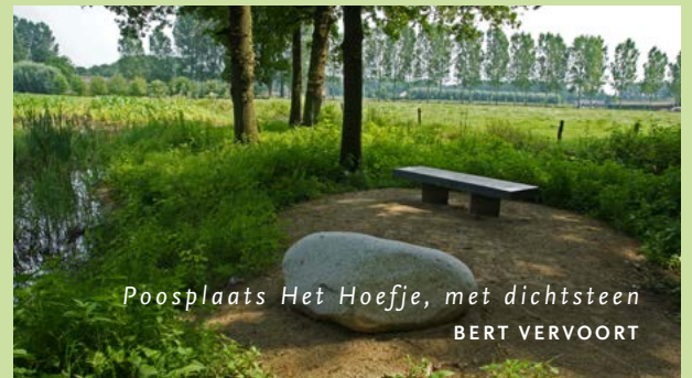
Poosplaats Het Hoefje, met dichtsteen BERT VERVOORT

zwijgzaam nabij vloeit tijdloos de stroom hier kluisden Kartuizers een wijle, in sobere stilte en innig bezinnen dichter tot God verlangen in bede na bede beleden omademde eenheid in eindeloos licht