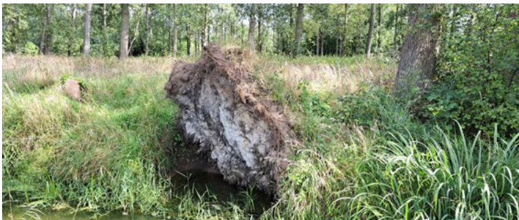
In de kluit van deze omgevallen populier groef een ijsvogel onlangs zijn nest

Een blauwe flits en een fluitende roep: zo kondigt een ijsvogel zich vaak aan. De soort is in Nederland beschermd en het aantal broedende exemplaren is erg wisselvallig. Dat heeft te maken met de invloed van strenge winters die onder ijsvogels veel slachtoffers maken.