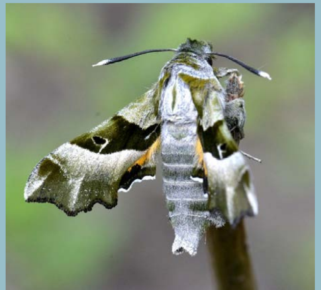
Teunisbloempijlstaart •