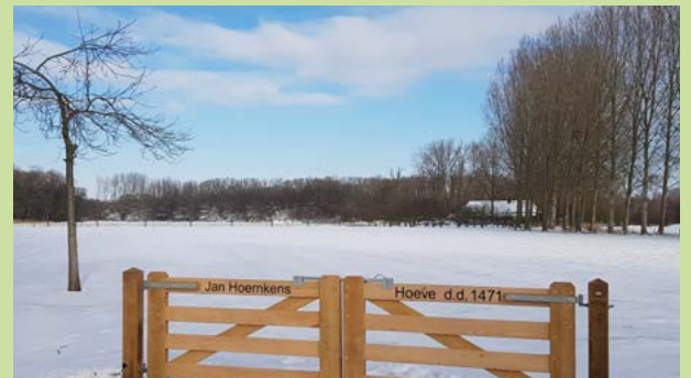
Een poort met opschrift herinnert aan de Jannes Hoernskenshoeve die de kartuizers hier eeuwen geleden kochten • BERT VERVOORT