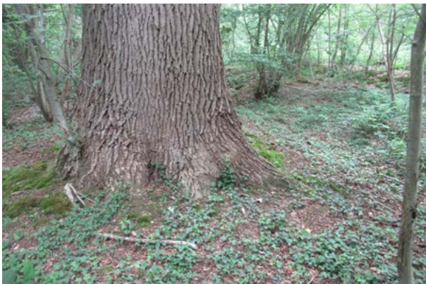
Een kolossale zomereik in de Kasterensche Braeck in De Geelders

We noemen De Geelders altijd een uniek leembos, zeldzaam in zijn soort. Maar wat maakt dit bos nou zo uniek? Dat zijn – onder meer – de zeldzame en autochtone (= oorspronkelijke) planten en bomen die je hier nog vindt.