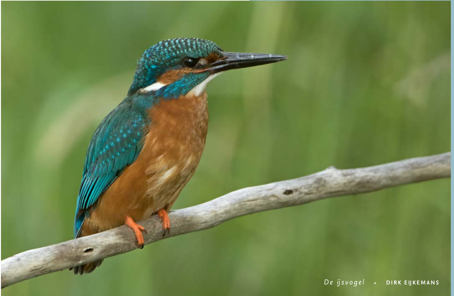
De ijsvogel • DIRK EIJKEMANS