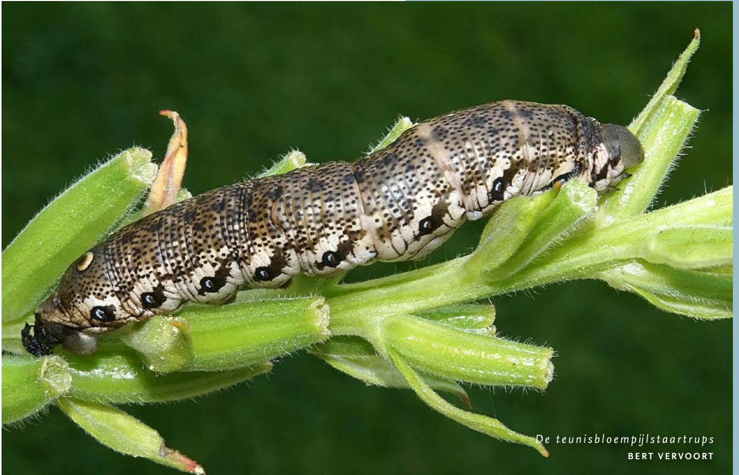
De teunisbloempijlstaartrups BERT VERVOORT