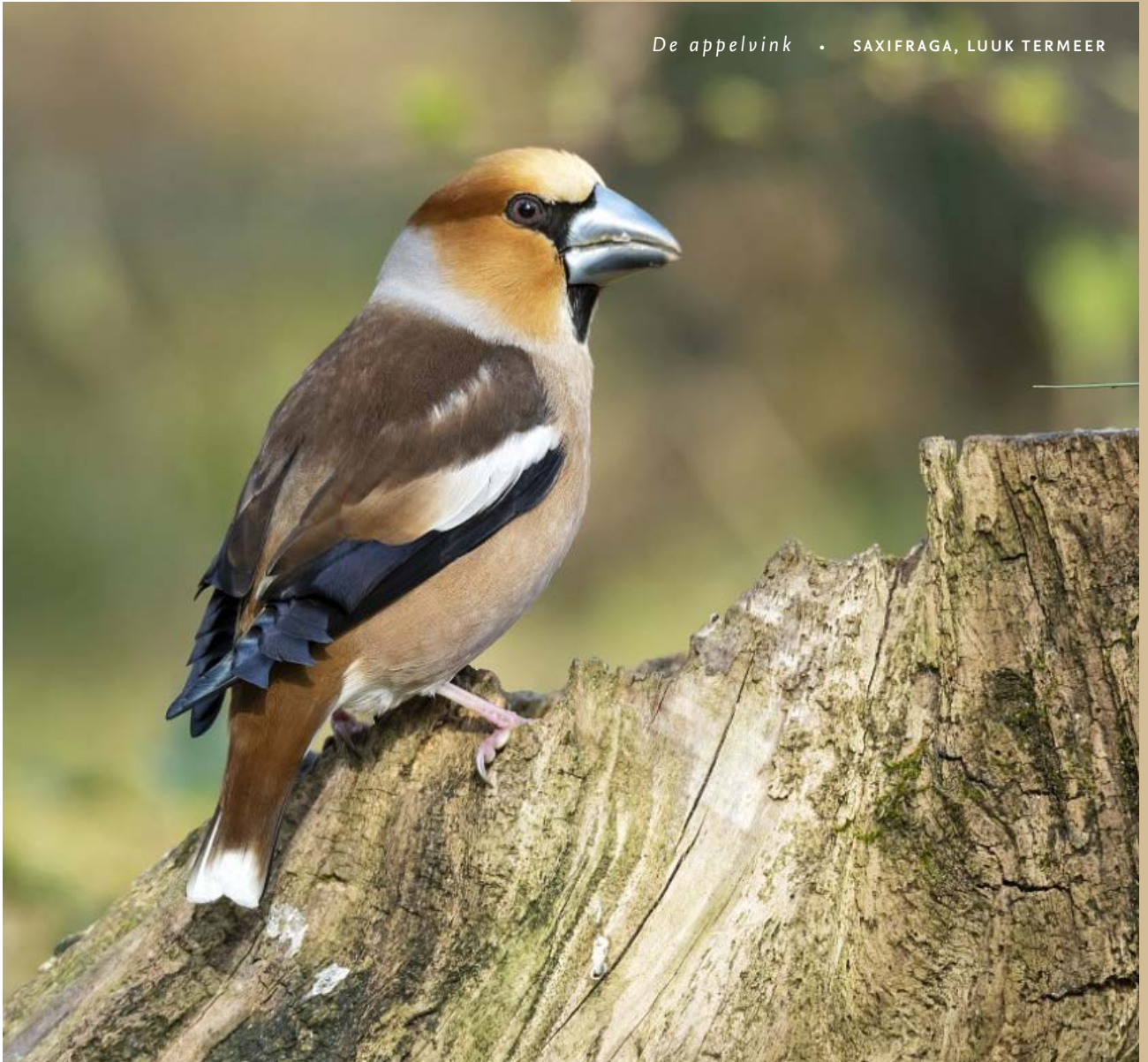
De appelvink