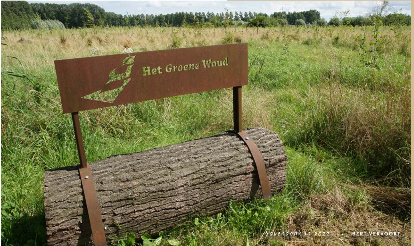
Savendonk in 2022 • BERT VERVOORT