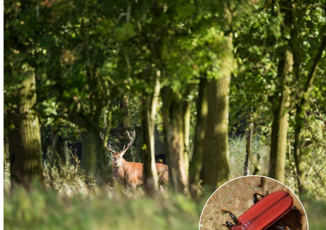
Boven: Edelhert Rechts: Vermiljoenkever

ARK is vijf jaar lang te gast in Het Groene Woud. In die periode werken we in en ten dienste van het gebied aan natuur. Dat doen we nadrukkelijk samen met de streek. Zo zorgen we ervoor dat de natuurdoelen ook op de lange termijn geborgd zijn bij lokale overheden, terreinbeheerders, boeren en andere belanghebbenden in het gebied. Ook contact met lokale terreinbeheerders hoort erbij: aan deze partijen dragen we de gronden na afloop over.