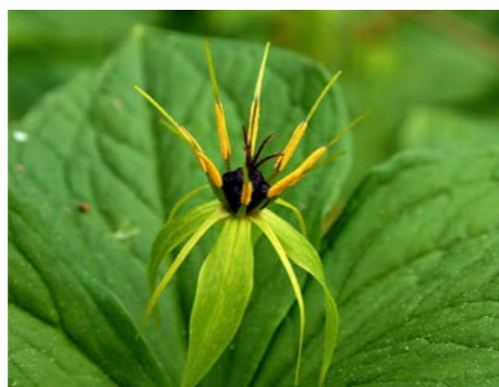
Eenbes, Bert Vervoort

ARK combineert een persoonlijke aanpak met voortvarendheid. We inventariseren de wensen van eigenaren en agrariërs en kunnen stap voor stap werken waardoor snel resultaten zichtbaar worden in het veld. Omdat geen enkele aankoop of grondruil hetzelfde is, is elke actie die we ondernemen maatwerk. We onderhouden intensief contact met alle betrokkenen en zorgen voor een goede prijs voor grondeigenaren.