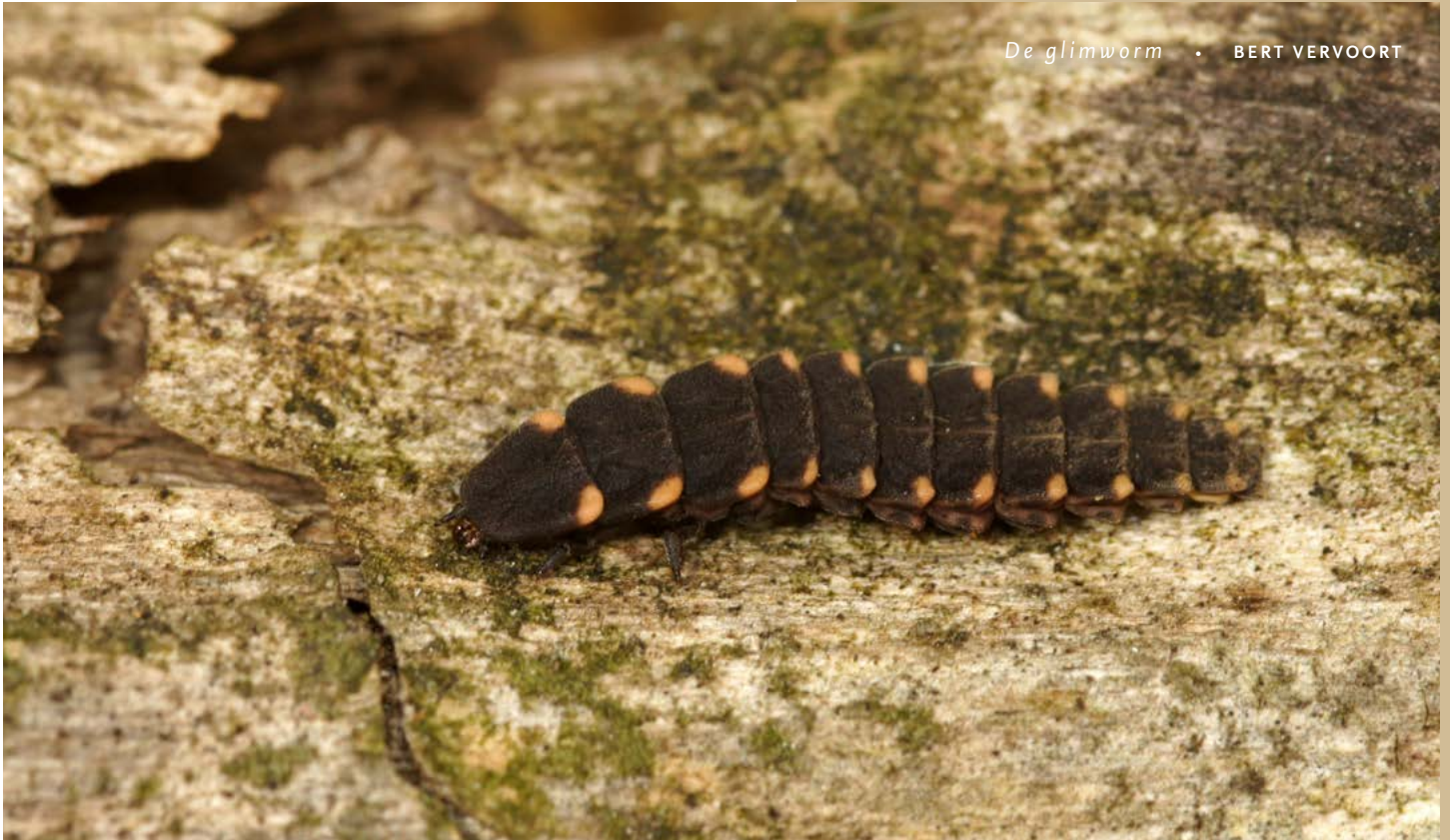
De glimworm • BERT VERVOORT