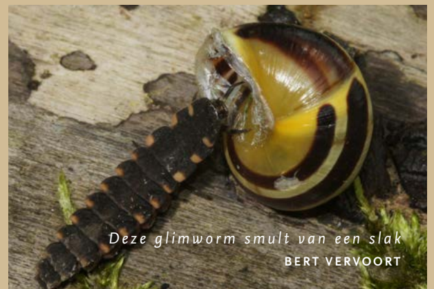
Deze glimworm smult van een slak BERT VERVOORT

kleine kever met vleugels waarmee hij twee á drie uur kan vliegen, het vrouwtje is twee keer groter, vleugelloos en lijkt eerder op een larve. Volwassen glimwormen eten huisjesslakken, maar teren vooral op de reserves die ze als larve opbouwden. In dat stadium zijn glimwormen echte jagers en ook dan doen ze zich te goed aan huisjesslakken. Hun jacht bestaat uit het bijten van de slak waarmee ze giftige verteringssappen in de slak injecteren. Door de beet trekt de slak zich terug in zijn huisje. Dat is het moment waarop de glimwormlarve wacht, want die kruipt vervolgens mee in het huisje om zich te voeden.