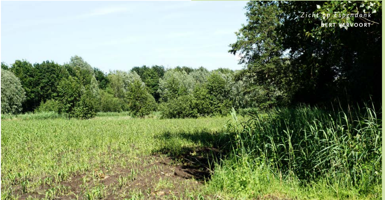
Zicht op Espendonk BERT VERVOORT