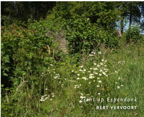
Zicht op Espendonk BERT VERVOORT

In Sint-Oedenrode verwierf ARK eind 2020 ruim vier hectare landbouwgrond van een particulier in het gebied Espendonk in het Dommeldal. Deze percelen maken het mogelijk het Dommeldal te verbinden met natuurgebied De Scheeken. Dat gaan we doen door hier de oorspronkelijke bosstructuur te herstellen die erg heeft geleden onder verdroging, verzuring en vermesting. Dit herstel moet ertoe leiden dat hier een robuustere natuurkern ontstaat met een florerend leembos waarvan ook aangrenzende gebieden (van Brabants Landschap en Staatsbosbeheer) deel uitmaken.