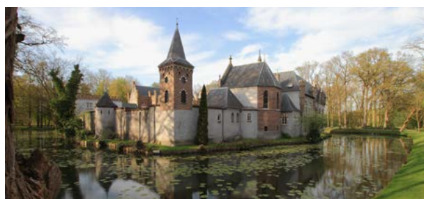
Kasteel Stapelen aan de Dommel in Boxtel