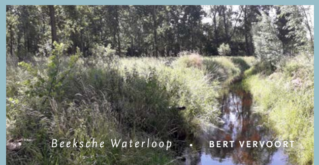
Beeksche Waterloop • BERT VERVOORT

Gemondser kan het niet worden dankzij alle lokale vrijwilligers die zich samen met de Natuurgroep Gestel voor de Beeksche Waterloop willen inzetten. De vernieuwde Stichting Landschap Het Groene Woud, dat zich inzet voor lokale initiatieven, helpt mee. En ook ARK gaat het initiatief ondersteunen. Het past naadloos in onze ambities, want de Beeksche Waterloop is als verbinding