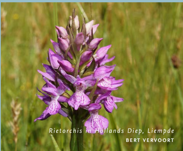
Rietorchis in Hollands Diep, Liempde BERT VERVOORT

Om het Natuurnetwerk Brabant te realiseren, verwerft ARK gronden in Het Groene Woud. Dat doen we in het kader van het project Brabants Goud in Het Groene Woud. Per 1 oktober 2021 beschikten we over ruim 280 hectare grond. Onze methode: we verwerven gronden, zorgen voor de inrichting en het tijdelijk beheer ervan. Na enkele jaren dragen we de gronden over aan andere beheerders. Ons meest recente Brabants Goud-perceel dat we toevoegden ligt aan de Beeksche Waterloop in Sint-Oedenrode.