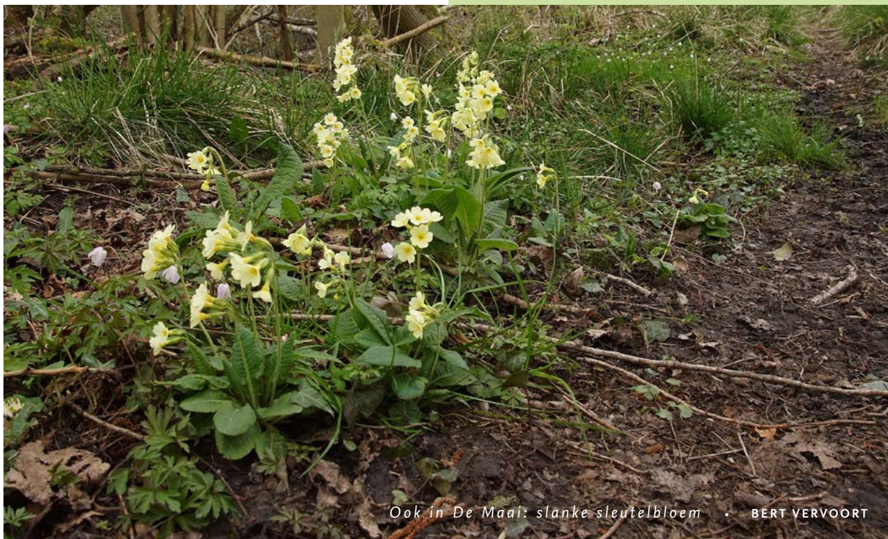
Ook in De Maai: slanke sleutelbloem • BERT VERVOORT