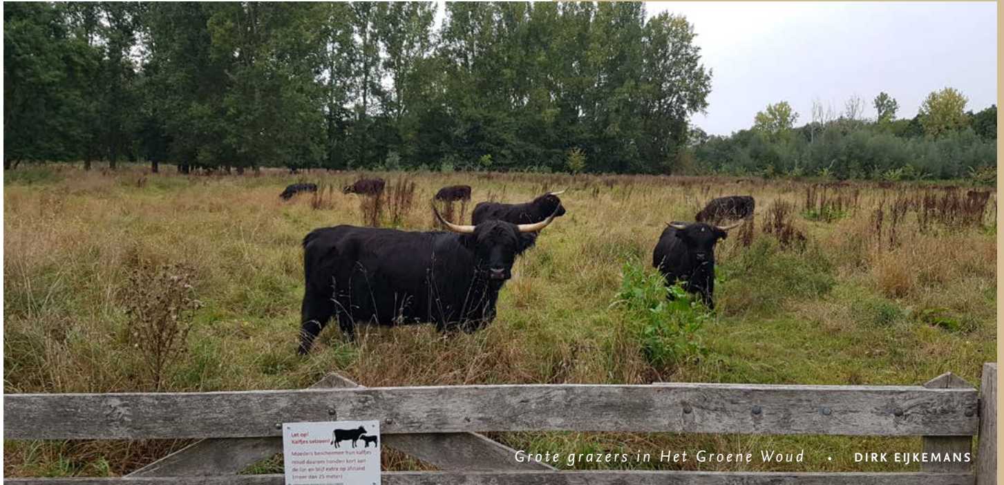
Grote grazers in Het Groene Woud • DIRK EJKEMANS