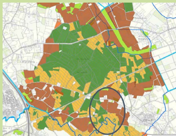
De Maai aan de Dommel

In deelgebied De Maai, tussen Liempde en Olland, komen de leembossen van De Geelders en het stromende water van de Dommel bij elkaar. Precies zoals dat tien eeuwen geleden ook het geval was. De bossen 'liepen' toen ononderbroken via Savendonk, Vosboel en Leemskuilen letterlijk tot aan de oevers van de Dommel. De open beemden zoals we die nu kennen, zijn pas in de elfde, twaalfde eeuw door ontginning ontstaan. Met de recente ontwikkeling van nieuwe