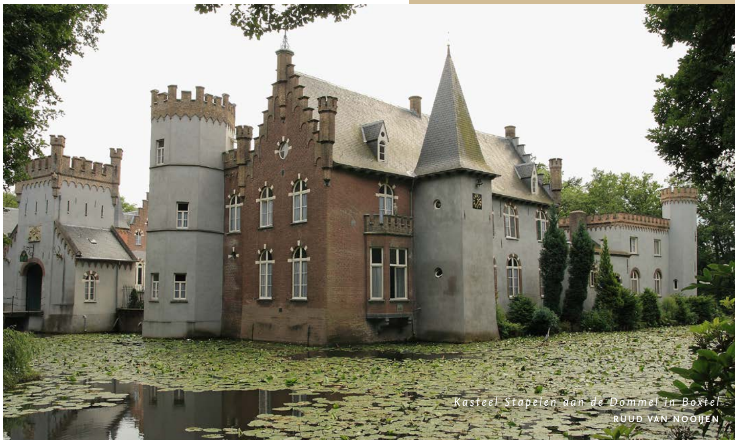
Kasteel Stapelen aan de Dommel in Boxtel RUUD VAN NOOIJEN

Een van de bekendste Dommelmonumenten is Kasteel Stapelen in Boxtel. Het staat precies op de plek waar de Dommel het Boxtelse centrum binnenstroomt. De naam, die al in 1219 voorkomt, is vermoedelijk afkomstig van het woord 'Stapel' dat zoveel betekent als 'hooggelegen plaats'.