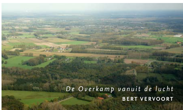
De Overkamp vanuit de lucht BERT VERVOORT