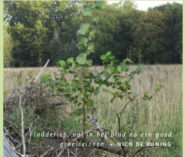
Fladderiep, vol in het blad na een goed groei seizoen

Zonder aanplant kan het tot tientallen jaren langer duren voordat hier zoveel struiken en bomen staan. Die zijn dan ook nog eens van een beperkt aantal soorten. De natuur een handje helpen, is dus het credo. Al benadrukt Nico dat de natuur vooral zelf bepaalt welke tijd ze nodig heeft. “We willen echter wel voorkomen dat bepaalde snelgroeiende kruiden overal dominant worden. In De Geelders zou je dan vooral beplanting gaan zien die van voedselrijke gronden houdt en van veel zonlicht, simpelweg omdat je deze factoren veel vindt op de voormalige landbouwgronden. Die consequentie is niet optimaal voor de biodiversiteit en soorten die De Geelders en Het Groene Woud juist zo bijzonder maken.”