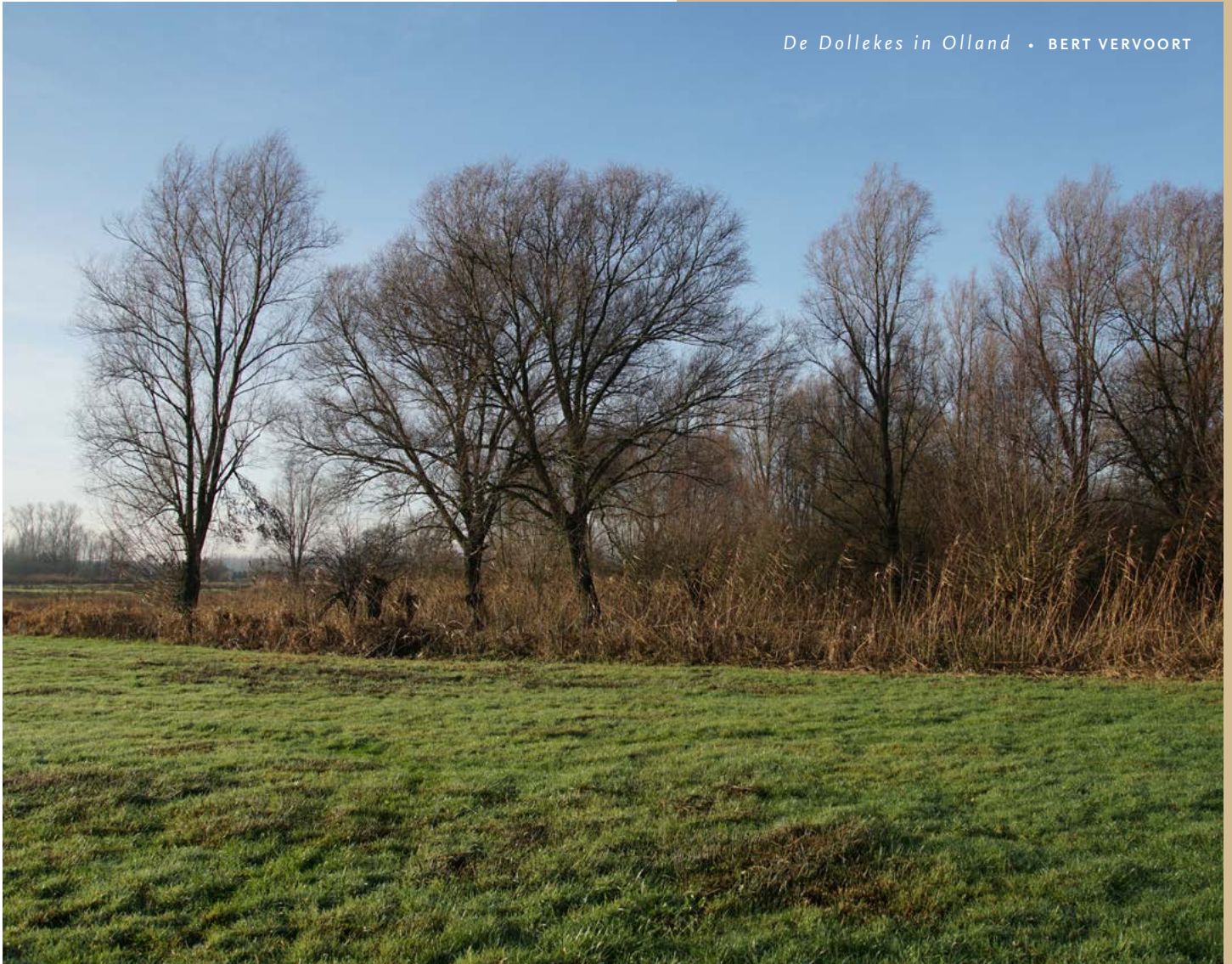
De Dollekes in Olland • BERT VERVOORT