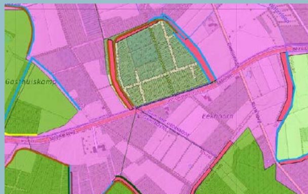
De rode lijnen geven de voorpootstroken weer JAC HENDRIKS

Er zijn maar weinig plekken in Het Groene Woud waar je dit ziet. De stroken zijn in de 15e eeuw aan de Overkamp toegevoegd nadat aan de eigenaren het voorpootrecht werd verleend. Dat betekent dat de kartuizers het recht kregen om in eigen bezit bomen te planten en te rooien vóór het eigen grondstuk. De Overkamp leverde in die tijd veel hout voor de kartuizers. De monniken verkochten het grondbezit in 1659 aan Pieter Lus, die er een huis en een gemetselde wind- en rosmolen bouwde. In de 17e eeuw gebruikte de Gemonde gemeenschap de Overkamp om turf te winnen. Dit gebeurde onder strenge restricties en toezicht van de gezworenen van de Bodem van Elde. Op dit moment is de Overkamp eigendom van Brabants Landschap.