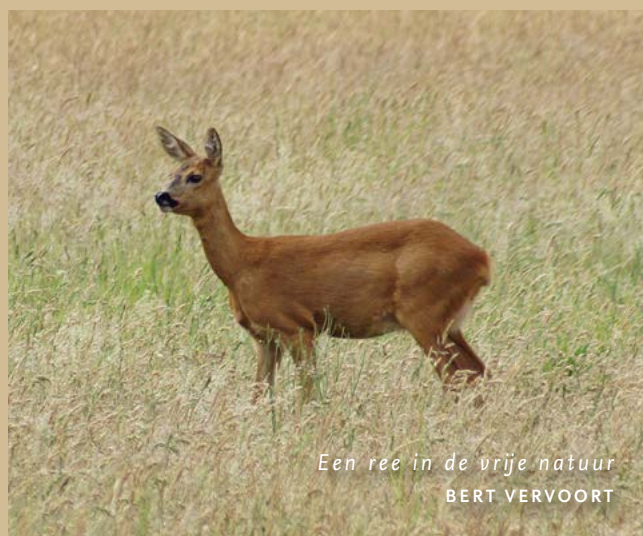
Een ree in de vrije natuur BERT VERVOORT

De voorbereidingen voor de Geeldersdag op 10 april 2022 zijn in volle gang. De organisaties die in deze bossen actief zijn (professionele partijen en vrijwilligersgroepen) hebben positief op onze naderende publieksdag gereageerd. Ook is bekend dat Stichting Landschap Het Groene Woud een actieve bijdrage zal leveren. Voor alle mensen die de publieksdag bezoeken, is inmiddels een klein naslagwerk in de maak dat zij gratis ontvangen. Hierin staat de unieke natuur van De Geelders centraal en komen de organisaties en vrijwilligersgroepen aan bod die in deze bijzondere leembossen actief zijn.