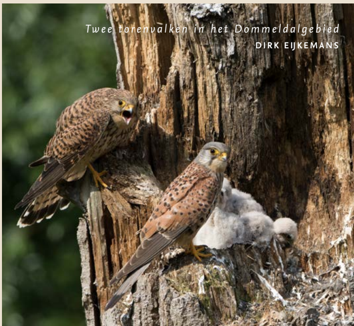
Twee torenvalken in het Dommeldalgebied DIRK EIJKEMANS