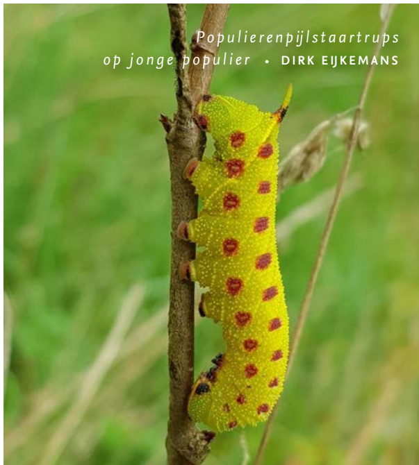
Populierenpijlstaartrups op jonge populier • DIRK EJKEMANS

In de winter van 2020/2021 is ARK in De Geelders gestart met het aanplanten van honderden bomen en struiken. “We planten om twee redenen”, legt Nico de Koning van ARK uit. “We willen een aantal zeldzaam geworden boom- en struiksoorten terugbrengen in het landschap én we willen de ontwikkeling van bosvorming op gang brengen.”