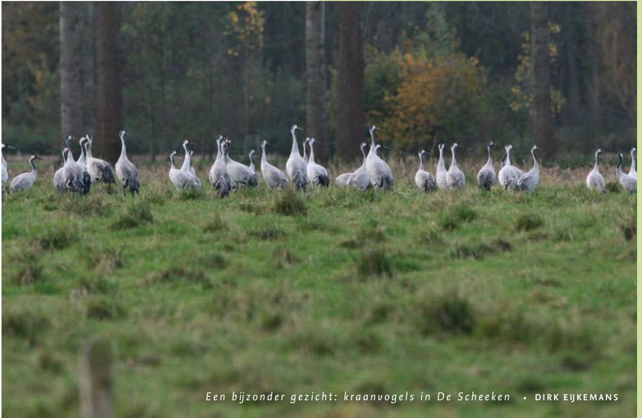
Een bijzonder gezicht: kraanvogels in De Scheeken • DIRK EIJKEMANS