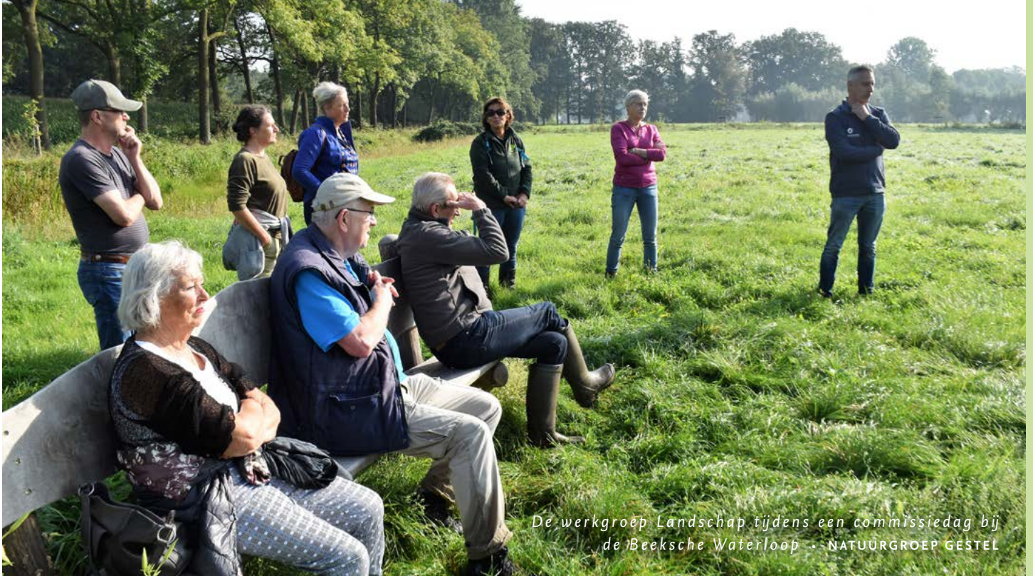
De werkgroep Landschap tijdens een commissiedag bij de Beeksche Waterloop - NATUURGROEP GESTEL