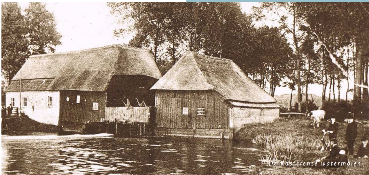
De Kasterense watermolen