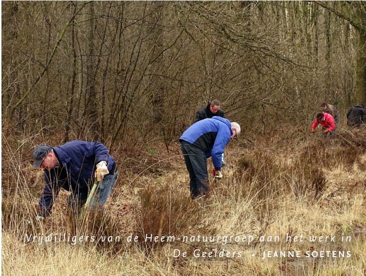
Vrijwilligers van de Heem-natuurgroep aan het werk in De Geelders

Met een bosmaaier, kniptangen en ander gereedschap trekt Heem-natuurgroep Sint-Oedenrode een paar keer per jaar De Geelders in. Met acht man sterk onderhouden de leden er het Weike, nabij de Schutstraat en de Lussendreef. Verderop, op het Heike, hielpen ze in 2017 mee het veld grootscheeps te plaggen.