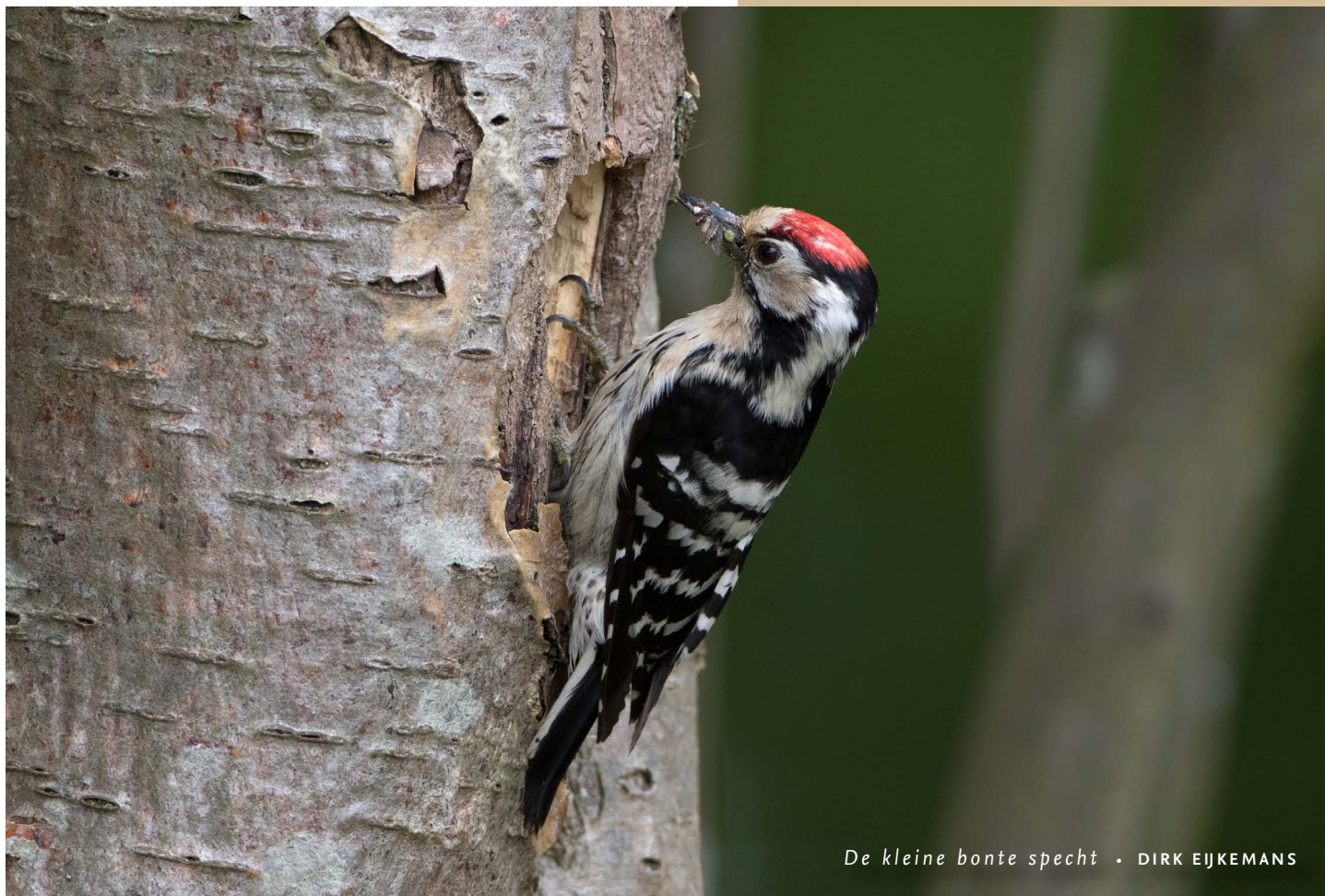
De kleine bonte specht • DIRK EJKEMANS