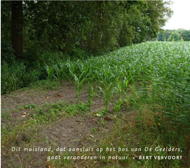
Dit maisland, dat aansluit op het bos van De Geelders, gaat veranderen in natuur • BERT VERVOORT

In het noordelijke deel van De Geelders ligt de Gasthuiskamp , een 68 hectare groot loofbos dat eigendom is van Brabants Landschap. Hierbinnen verwierf ARK in het najaar van 2020 in totaal 3,7 hectare aan bouwlandpercelen. Door deze te herontwikkelen, zorgen we ervoor dat ze ecologisch aansluiten bij de omliggende bossen. Waardevol, want daarmee breiden we het leefgebied uit van diverse bijzondere bewoners die het gebied kent.