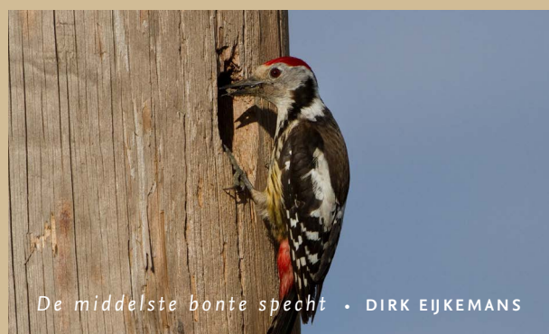
De middelste bonte specht • DIRK EJKEMANS

Middelste bonte spechten vinden hun voedsel (vooral insecten en hun larven) óp bladeren en in de groeven van boomstammen. De vogelsoort is relatief nieuw in Nederland; de eerste paartjes vestigden zich midden jaren negentig van