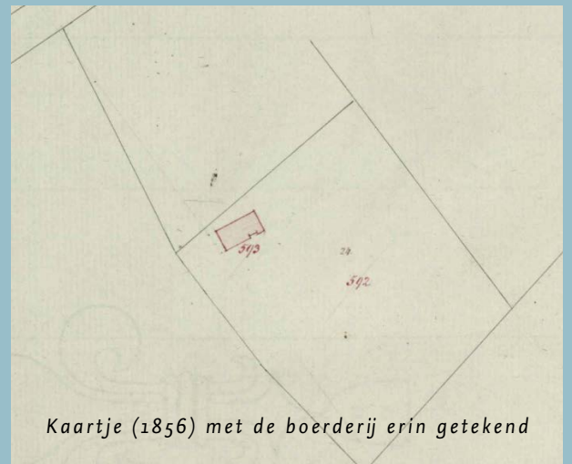
Kaartje (1856) met de boerderij erin getekend