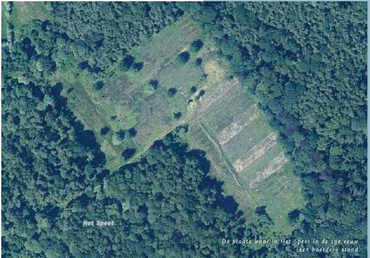
De plaats waar in Het Speet in de 19e eeuw een boerderij stond