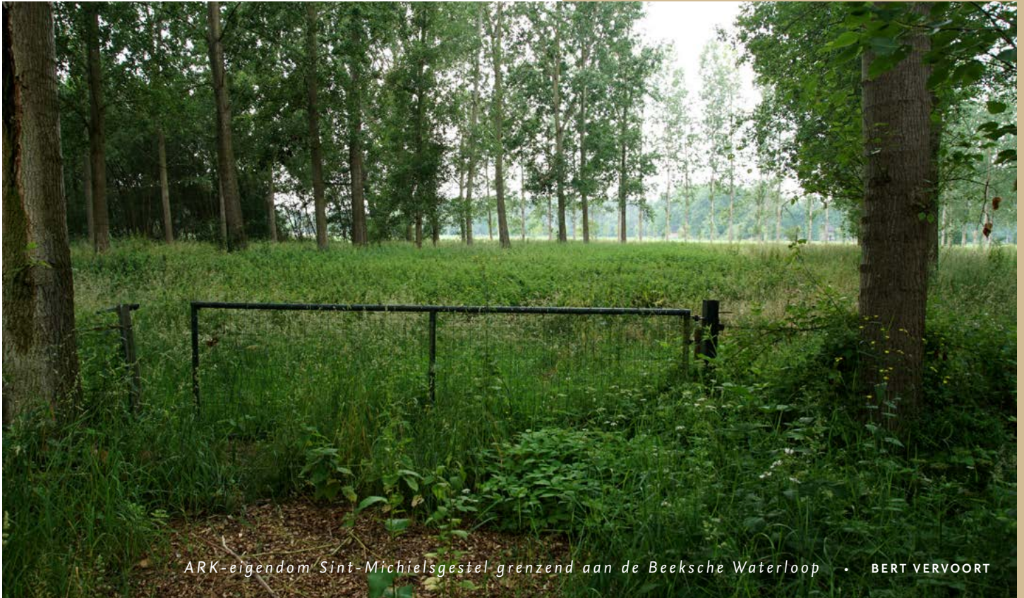
ARK-eigendom Sint-Michielsgestel grenzend aan de Beeksche Waterloop • BERT VERVOORT