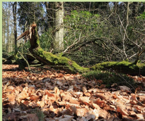
De leembossen bij Velder • RUUD VAN NOOIJEN

In Oirschot, aan De Beerze, verwierven we bijna 25 hectare grond, zowel op de grens met de Kampina (bij De Logt) als net bovenstrooms aan de Spoordonkse watermolen. Samen met de Brabantse Molenstichting, gemeente Oirschot en Waterschap De Dommel realiseren we daar de komende jaren een watermolenlandschap met een zeer hoge biodiversiteit.