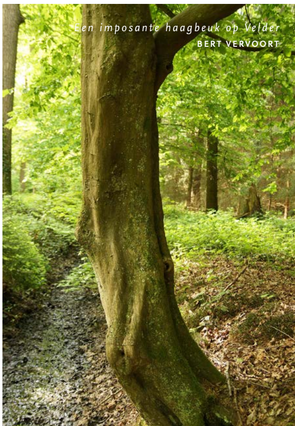
Een imposante haagbeuk op Velder BERT VERVOORT

ARK Natuurontwikkeling is niet alleen actief in De Geelders en het Dommeldal, we zijn in Het Groene Woud ook bezig met natuurontwikkeling in het Beerze-gebied (tussen de Kampina en landgoed Baest) en in De Hemel (grenzend aan het Liempdse landgoed Velder).