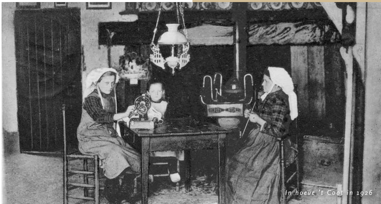
In hoeve 't Coot in 1926