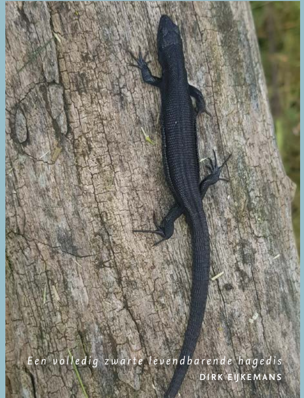
Een volledig zwarte levendbarende hagedis DIRK EIJKEMANS