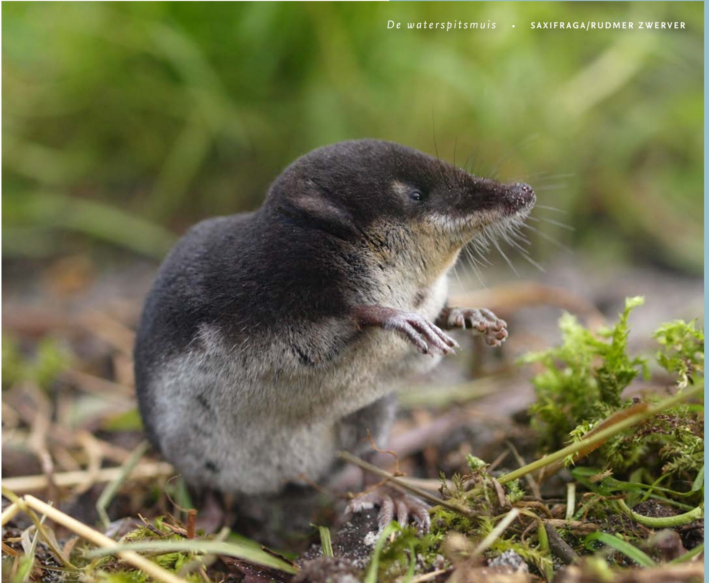
De waterspitsmuis