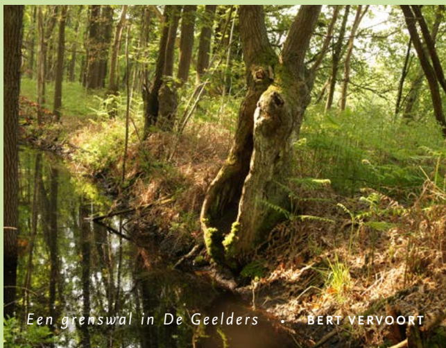
Een grenswal in De Geelders • BERT VERVOORT

Om het Natuurnetwerk Brabant te realiseren, verwerft ARK gronden in Het Groene Woud. Dat doen we in het kader van het project Brabants Goud in Het Groene Woud. Per 1 september 2021 beschikten we over ruim 285 hectare grond. Onze methode: we verwerven gronden, zorgen voor de inrichting en het tijdelijk beheer ervan. Na enkele jaren dragen we de gronden over aan andere beheerders. Onze meest recente Brabants Goud-percelen die we verwierven, liggen in het Dommeldal aan het Everse Akkerpad (Sint-Oedenrode) en aan het Hoefje in De Geelders.