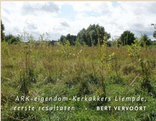
ARK-eigendom-Kerkackers Liempde, eerste resultaten • BERT VERVOORT