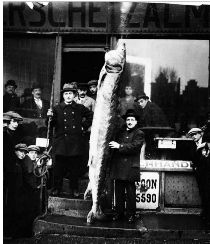
★ Aangelande steur, vishandel Amsterdam, 1921. Een van de laatste 'Rijn'-steuren.

Het is logisch dat de Europese steur niet uit zichzelf, dus zonder hulp van de mens, het stroomgebied van de Rijn weer zal koloniseren. Hier is het dier verdwenen, maar in de winter verblijft een klein deel van de