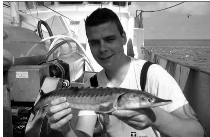
★ Steur gevangen door beroepsvisser, gemeld en weer levend teruggezet. Samenwerking met de visserij is doorslaggevend voor de toekomst van de steur.

Franse populatie op de Noordzee. Deze dieren zwemmen in het begin van het voorjaar terug naar de delta van de Garonne-Gironde-Dordogne. Deze Atlantische steuren herkennen de Rijn niet meer als paaigebied en geboortegrond. De kans dat twee geslachtsrijpe dieren tegelijk de Rijn op zwemmen en paaien moet als uitgesloten worden beschouwd. We zullen de Europese steur daarom moeten helpen.