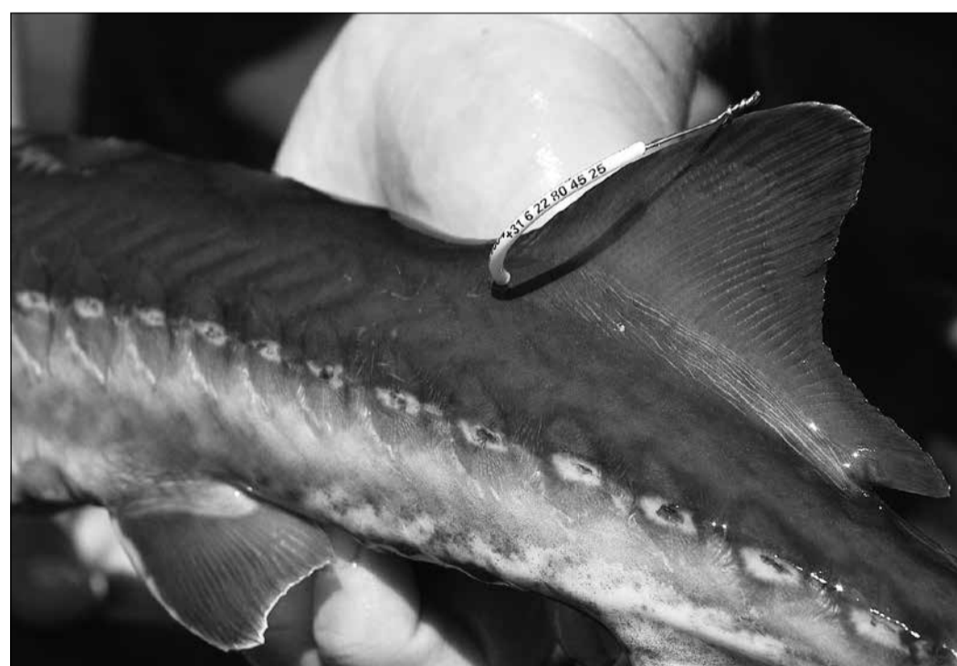
★ Uitgezette steuren zijn makkelijk te herkennen aan het merkje door de rugvin.

De steur is hiermee echter nog niet definitief terug in de Rijn en de Noordzee. Dat is een langdu-